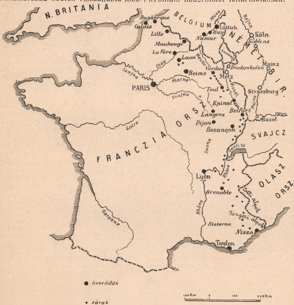
A francia erődítési rendszer.

Ismét más orosz seregrészek a Visztulánál állhatnak, hogy a Nowo-Giorgiewsk, Varsó és Ivangorod várak által védett vonalon, az észak felé előnyomuló haderőnket feltartóztassák.