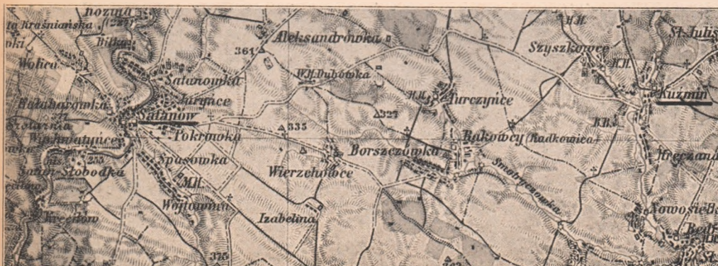
Honvéd lovasságunk harcának színtere.

Schirmek elzászi város közelében egy vakmerően és elővigyázatlanul előnyomuló német különítményt kudarc ért.