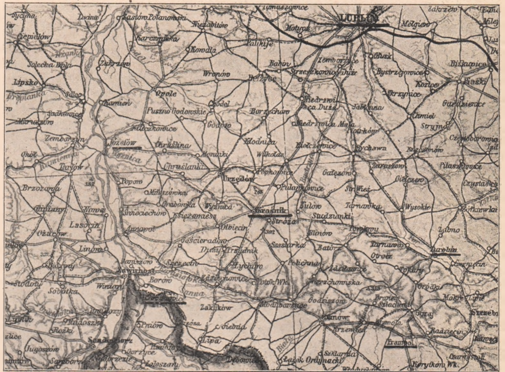
A krasniki csata színtere.

A német lakosság Belgiumban Pervez mellett, visszavetette az 5. francia lovas hadosztályt.