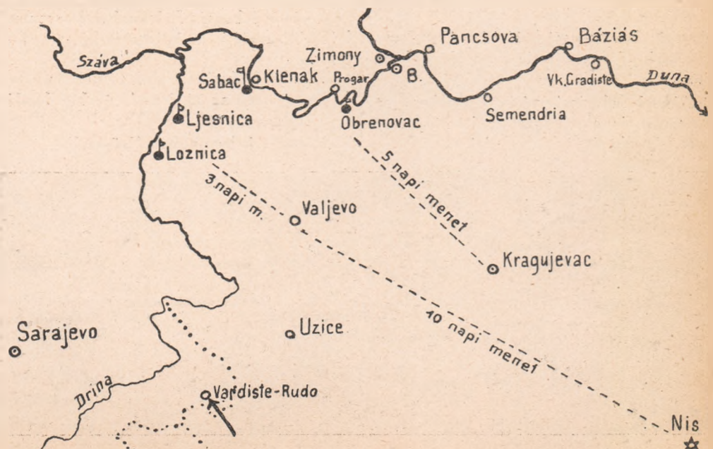
A szerb hadszíntér.

Egyik cirkálónk elpusztította Antivari radioállomását.