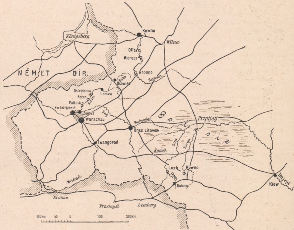
Az orosz erődítési rendszer.

Londoni nagykövetség a követség személyzetével és mintegy 250 osztrák és ma-