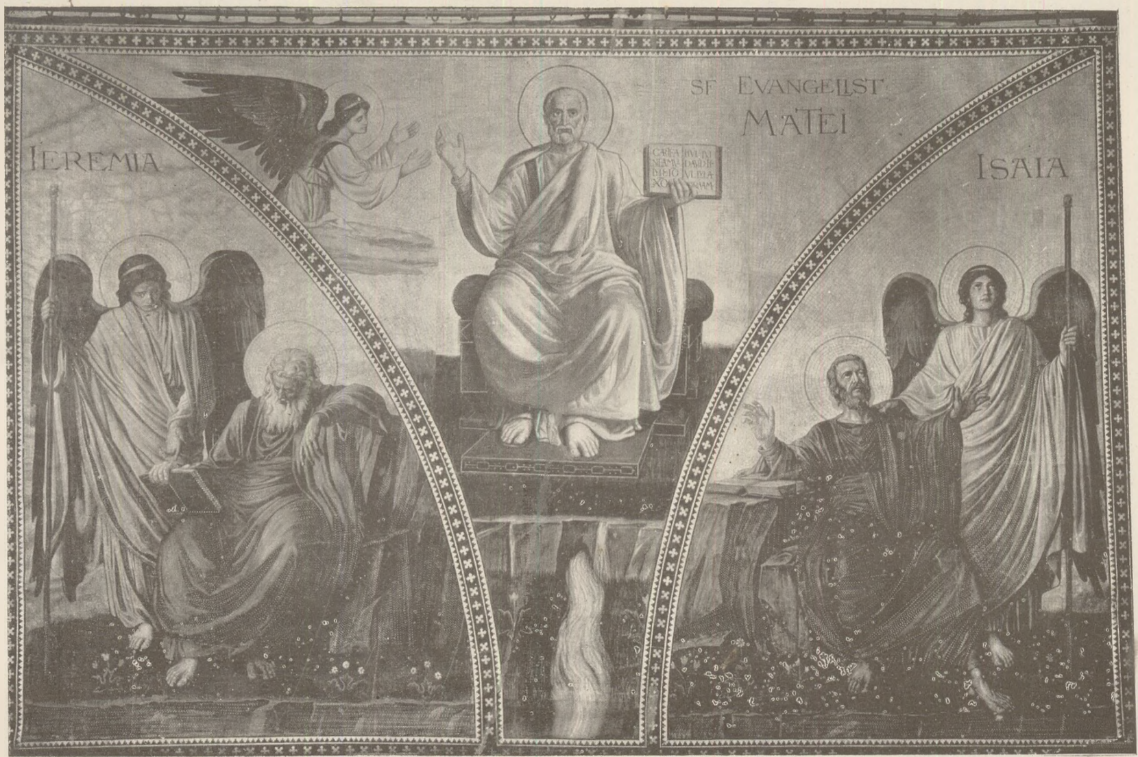
OCTAVIAN SMIGHELSCI: Profetul Ieremie. Evangelistul Mateiu, Profetul Isaia.