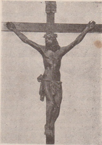
Crucifixul de Michelangelo.