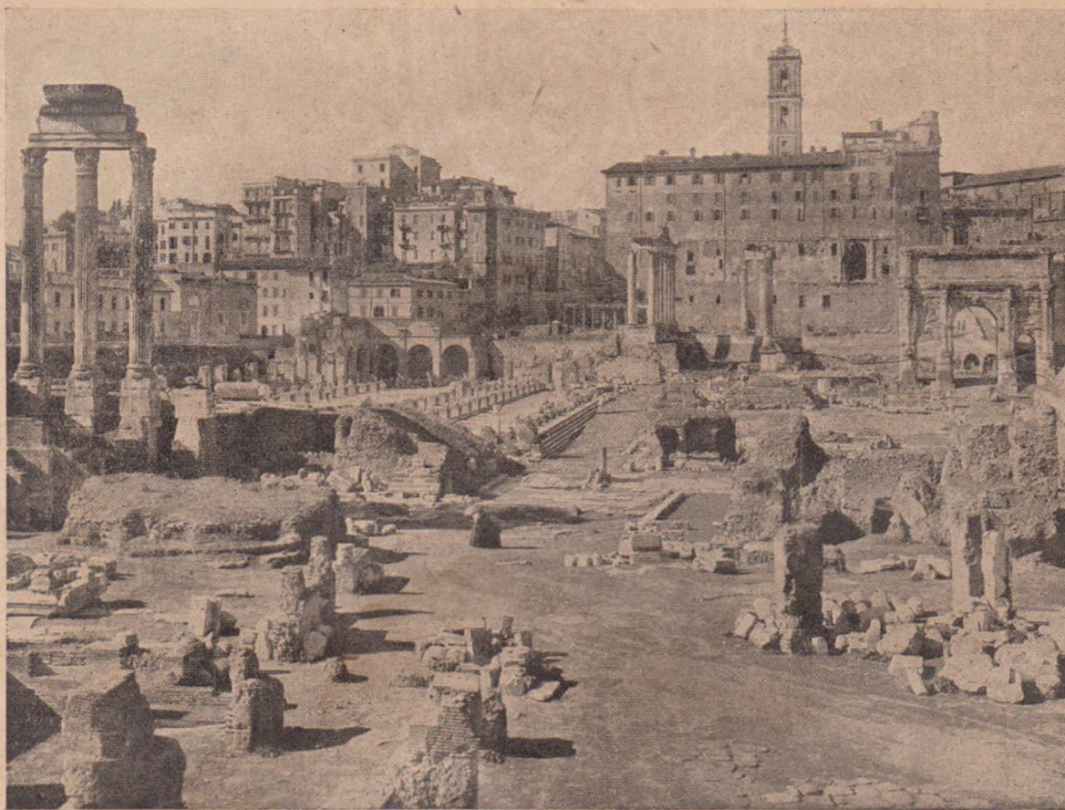
Forul roman actual cu vedere spre nord. În față: Casa Vestalelor cu atrium. Incepând dela stânga: Templul lui Romulus (rotund); bazilica lui Constantin (cu 3 arcade); biserica S. Francesca Romana (=templul Venerii și Romei).

său învingător Constantin cel mare, al cărui nume și poartă. Ceeace a rămas dela ea — zidurile cu pilaștri și cu o parte din tavanul casetat și boltit — e destul spre a ne da seamă de arhitectura acestei bazilici. Boltitura semicirculară sau apsida, caracteristică acestui fel de clădire ca și bisericei noastre, care ca nume și plan e fătul ei, se vede și acum în păretele, cu care se incheie spre mează-noapte arcada dela mijloc. Ea era