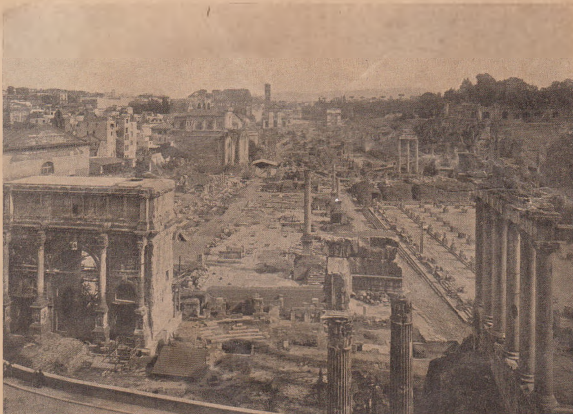
Forul roman actual, văzut dinspre Capitol. La dreapta: Templul lui Saturn; basilica Iulia (jos); templul Castorilor; mai la dreapta: templul și biblioteca lui August; mai la stânga: Casa Vestalelor cu atrium la mijloc; în fund: Palatinul. La mijloc (între cele două căi sacre): Templul lui Vespasian (coloanele în față); stăvilarul lung: Rostra; urmează piața forului (coloana din față e a lui Focas); ruinele templului lui Cezar; la capăt: arcul lui Titus (pe Velia). La stânga: arcul lui Septimiu Sever; la stânga lui, fațada Curiei (se vede frontonul); basilica Aemilia; Templul Faustinei (biserica S. Lorenzo); Templul lui Romulus; basilica lui Constantin (în dosul templului Faustinei); Templul Venerii și a Romei (San Francesca Romana, în fund); Coloseul.

cesc: basilica. Dacă focul ce a bătuit mai târziu n'a lăsat nici o urmă din lucrarea lui Caton, avem însă rămășițe vrednice de luat aminte dela cele două mari basilici, cari stăteau față în față pe cele două laturi ale Forului propriu zis. Una, cea mai veche, despre mează-noapte, basilica Aemilia, se datorește familiei Emiliilor, din care a eșit un Paul Emiliu; cealaltă, mai nouă, despre mează-zi, e opera lui Iuliu Cezar dela care se și numește basilica