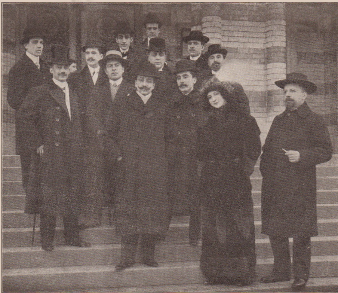
Un grup de scriitori, eșind din biserica catedrală: