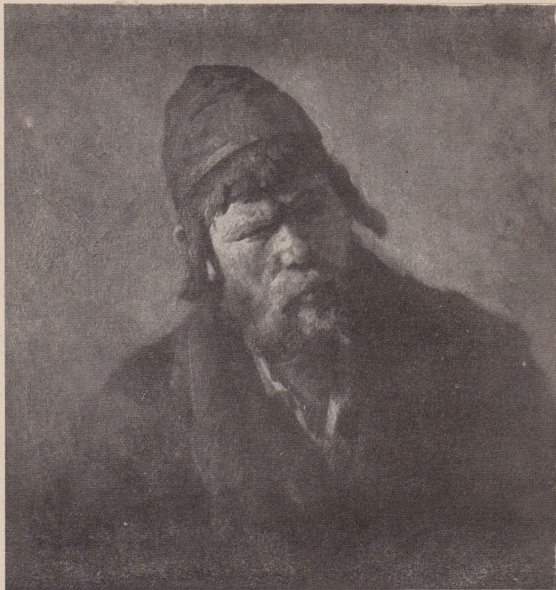
Grigorescu: Ovreiu din Galifița.

Am auzit spuindu-se despre alți pictori, și despre tablourile lor vorbe de acestea. S'a ocupat prea mult de formă, și-a neglijat culoarea; sau: cutare tablou e frumos colorat, ce păcat că desenul ori construcția, ori așezarea pe pânză lasă de dorit! La Grigorescu linie, culoare, viață, aer, mișcare, toate acestea fac una. Sunt una, — cum de altfel trebuie să fie la orice artist adevărat. Aceeași pensulă, cu aceeași atingere, așază, construiește, desenează și colorează, — într'un cuvânt, pune lucrul în picioare și-i dă viață — just câtă-i trebuie. Cum?