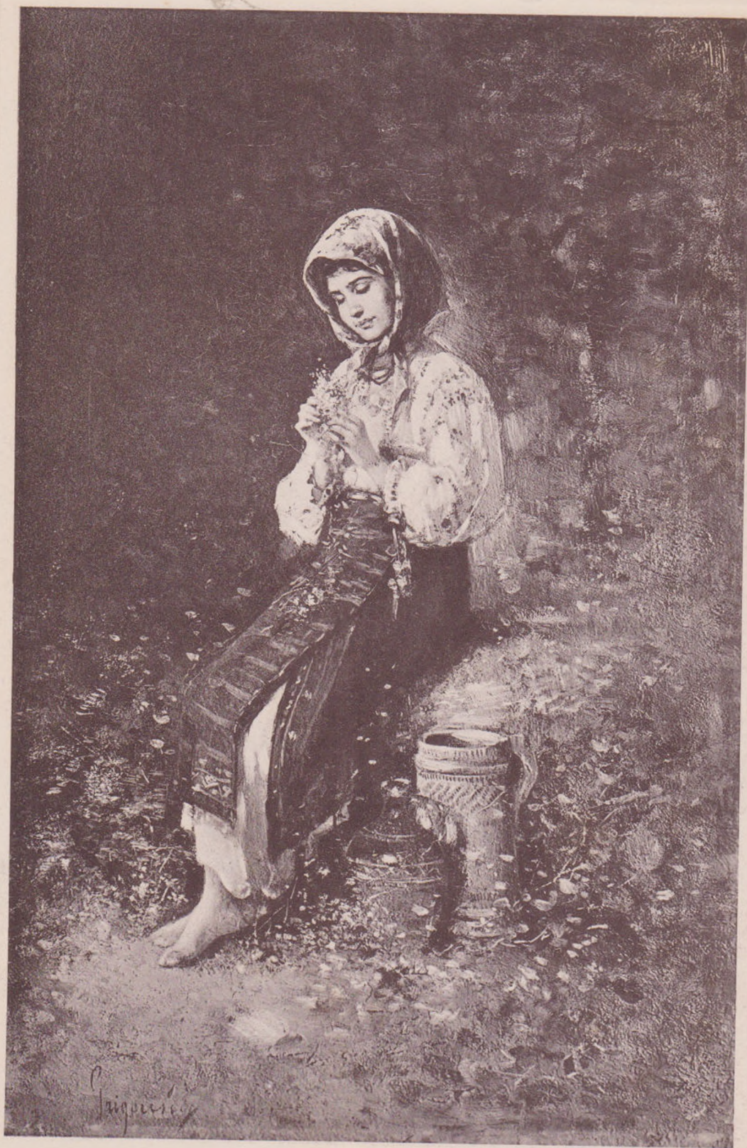
Grigorescu: Gânduri de primăvară,