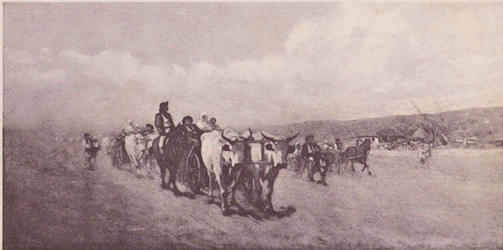
Grigorescu: Intoarcerea dela bălciu.