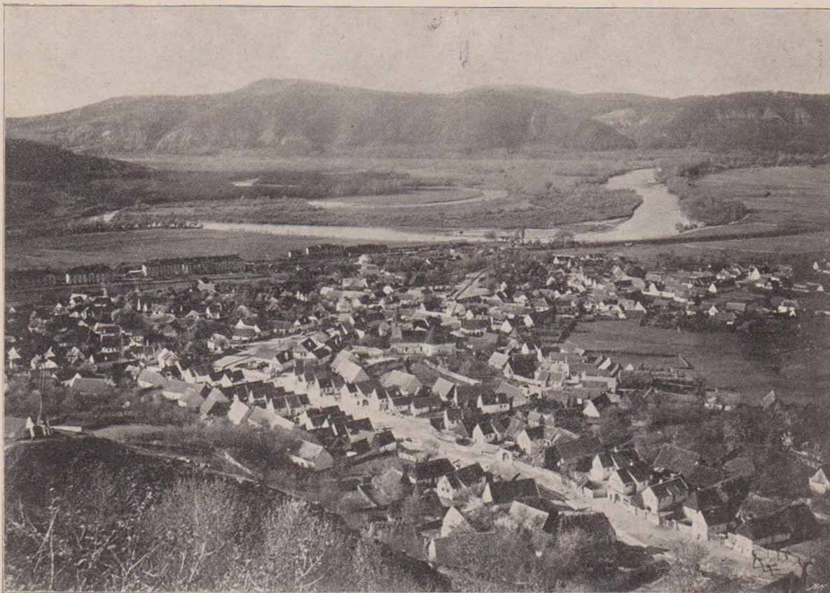
Satul Porcești lângă Turnu-Roșu.

Depart se zărește Dealul Turcilor... Câte oseminte nu vor mai fi pe acolo de pe vremea