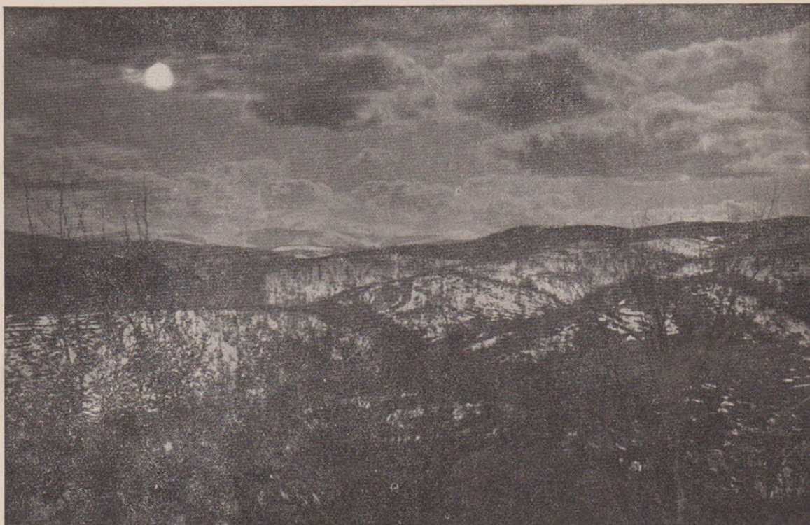
Efect de lună în munți.

În sfârșit sosește, dar caii nu-i mână proprietarul cu care ne tocmisem ci un flăcău zdravăn și priceput. Ne spune, însă, că nu ne poate conduce până sus. Trebuie deci să facem un ocol până la Ucea-de-jos, ceea ce însemnă o pierdere de un ceas, pentru noi, cari ne