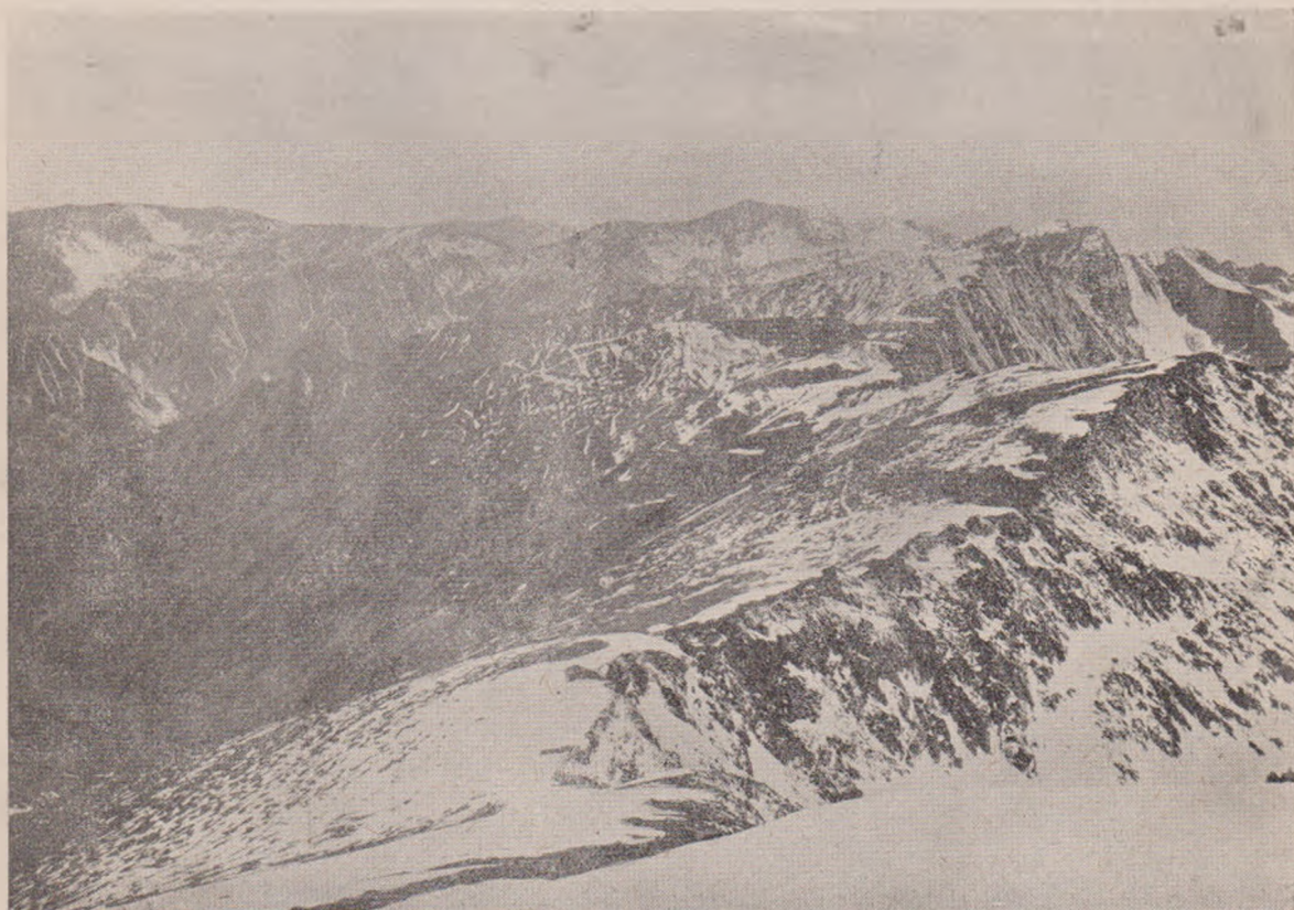
Vedere de pe vârful Urlei spre Vest.