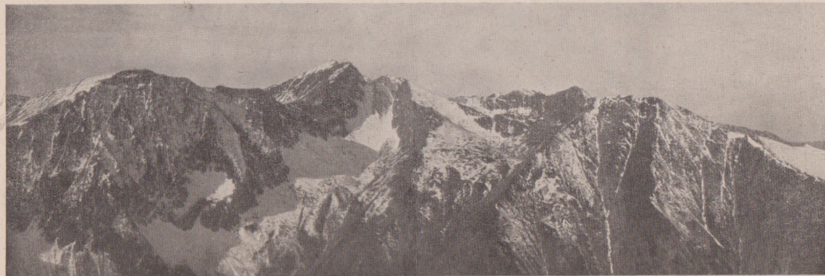
Vedere de pe șeua Laculețe 2250 m.