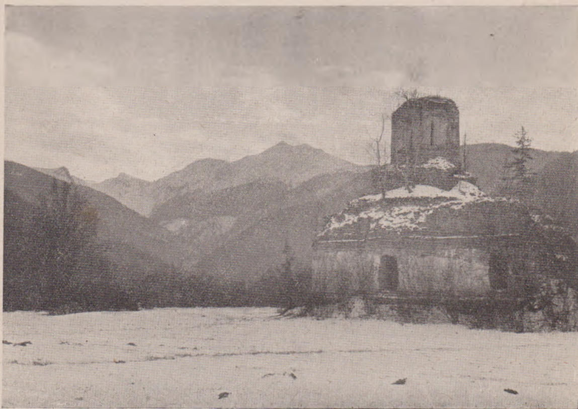
Mănăstirea Grecilor din Brașov în Valea Sâmbetei-de-jos.

Seara eră aproape și întunerecul amenința să ne găsească rătăcind prin munți. Din clipă în clipă cerul se vedeă cum se întunecă de noapte. Luarăm pe noi câte-o haină ceva mai groasă pentru răcoarea serii