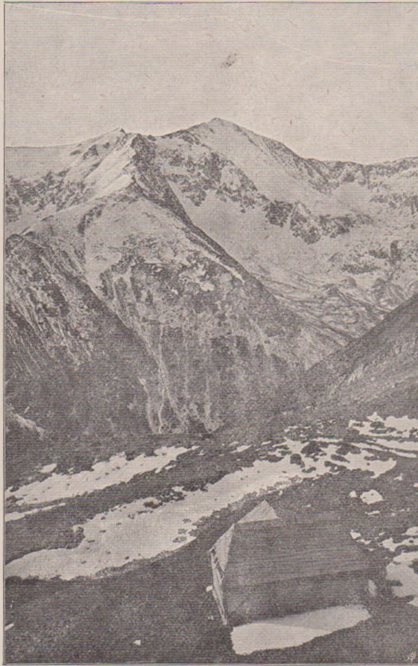
Vârful Urlei (2474 m.) și Piscul Somnului.