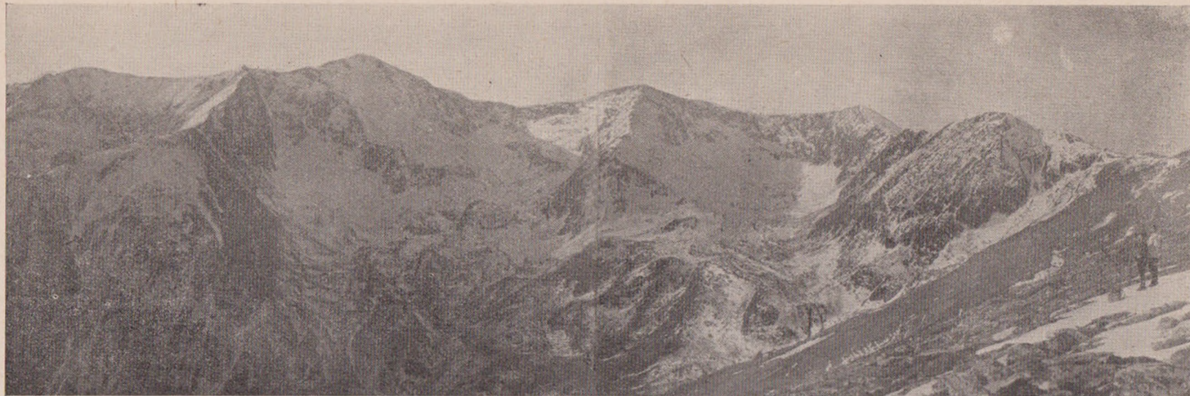
Șeua Laculețe 2250 m.