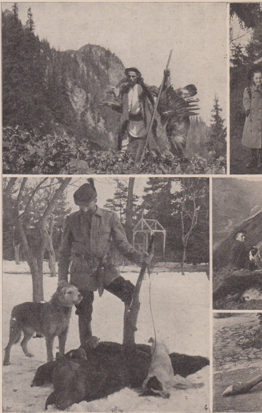
Mayor v. Spiess: 1. Capră neagră și Vultur.

Pereții stâncilor ascuțitului munte Drăguș cad aproape perpendicular în jos.