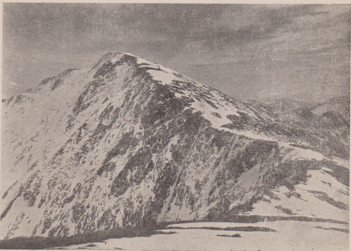
Vârful Urlei 2474_m.