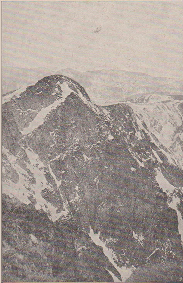
Colțu Bolăceni (2290 m.).

Înainte vreme eră foarte rău întreținută această colibă, deși eră nouă. În lipsa tu-