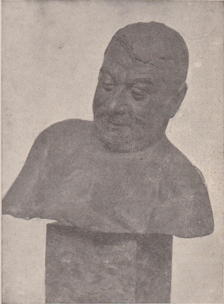
O. Spaethe: Silen.

Să vedem ce zice a cum în această chestie viceprezidentul reuniunii. Iată însaș lucrarea d-lui Pocola, care a fost primită de adunare,