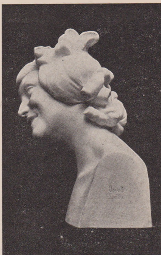
O. Spaethe: Bachantă.

măreață. Și ce trup: prelung, rotund și alb ca fulgul de zăpadă. Numai fruntea i-a stropit-o câțiva scârlioniți, negri corb — părea că-s tăuni — d'aia și copiii l-au botezat Tăunu.