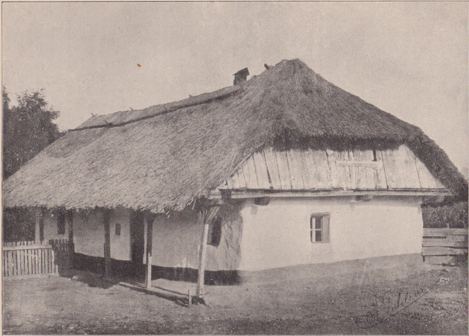
Casa din Jucul de jos, in care s'a născut Gheorghe Barițiu.