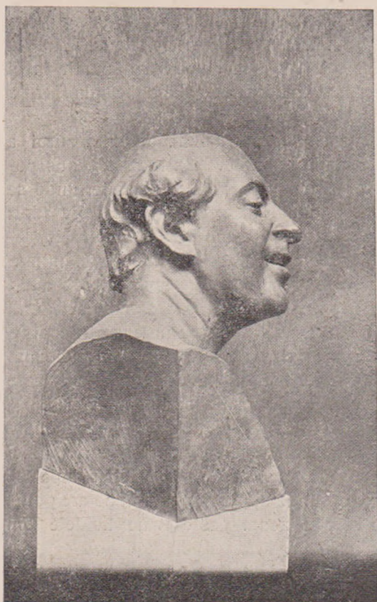
O. Spaethe: Satyr.