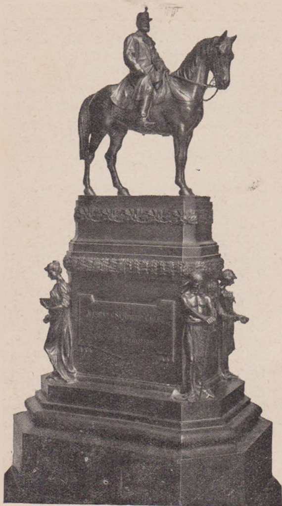
O. Spaethe: Statuia Regelui Carol.

cu ceară. Odată au stat doi băieți o jumătate de zi cocoșați într'un stejar; iar taurul da ocol pe la rădăcina copacului și svârleă din picioare. Noroc, că l-a prins setea pe Tăunu și a coborât devale la izvoare. Numai așa au scăpat băieții cu fuga.