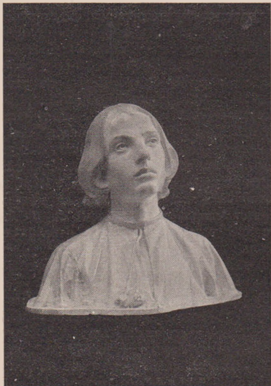
O. Spaethe: Visul.

Părintele C. Lucaciu are meritul de a fi încercat cu toate mijloacele trezirea la conștiință a învățătorimii gherlane. Din parte-i a făcut tot ce a putut, dar singur nu putea să ajungă acolo unde trebuia. Să vedem ce concurs i-au dat alții, și în special învățătorii sălăgeni, cari ne preocupă în acest articol.