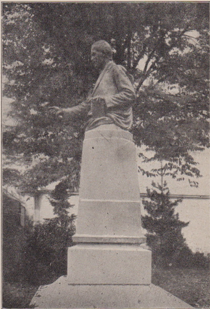
O. Spaethe: Monumentul lui Gheorghe Barițiu ridicat în Sibiu.

Sumedenia asta de bani ne trezi inima, că Chitarcă zise :