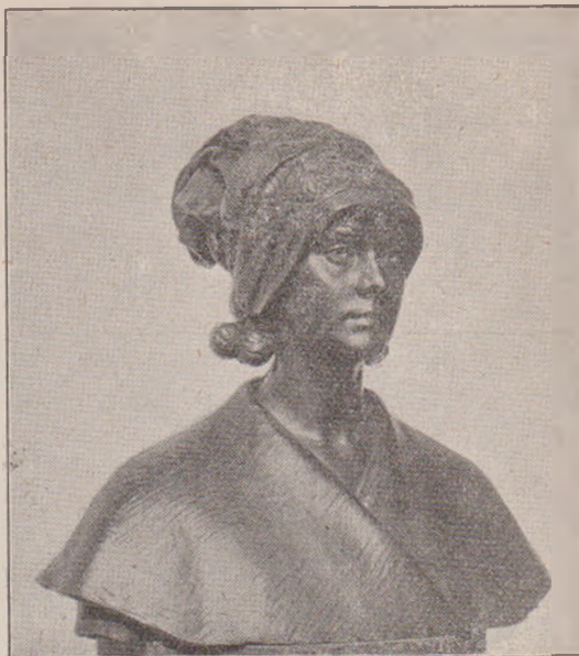
O. Spaethe: Cocoana Tilica, bronz.

„Mergem noi la han, am spus la oameni toată pățărănia și am pornit. Am mai poposit la niște hanuri; la Târgu-Frumos, la Podul-Iloaei și a treia zi am fost la Ieși. Acolo, până am vândut cofele, până una alta, ne-a apucat Dumineca-Mare; Și cum e azi Dumineca-Mare; cum e mâne, Luni, sf. Troiță; și a doua zi Marți, trebuiă să ne întorcem. Când Marți, dimineața, să înjuge oamenii boii, numai ce auzim trânghiți și tobe pe uliți și lume alergând, iar un dorobanț că-