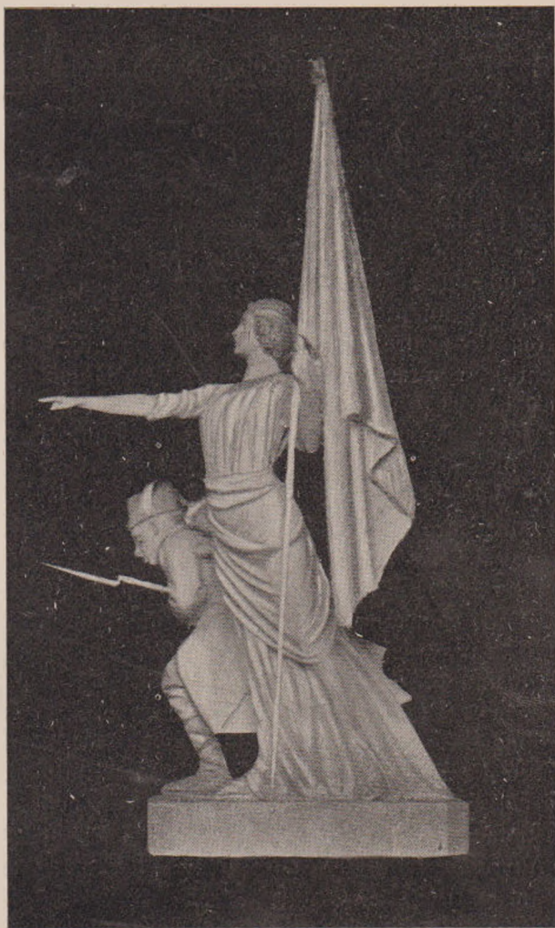
O. Spaethe: Monumentul Putnenilor (1877—78).

Așa s'a făcut între oameni o zarvă ca de huet de ape; iar boerii ce au vorbit între dânșii, că tot acela ce l-a întreat i-a zis: „Asta nu scrie la cele ce ai făptuit. Te-a