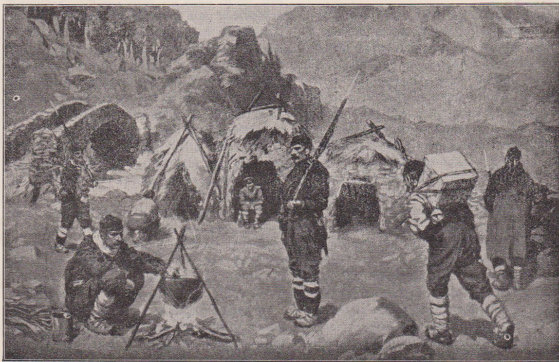
Războiul din Balcani: Un avanpost al infanteriei bulgare în Valea Mariței.

Nu pregețăm a recunoaște că în lupta tre-