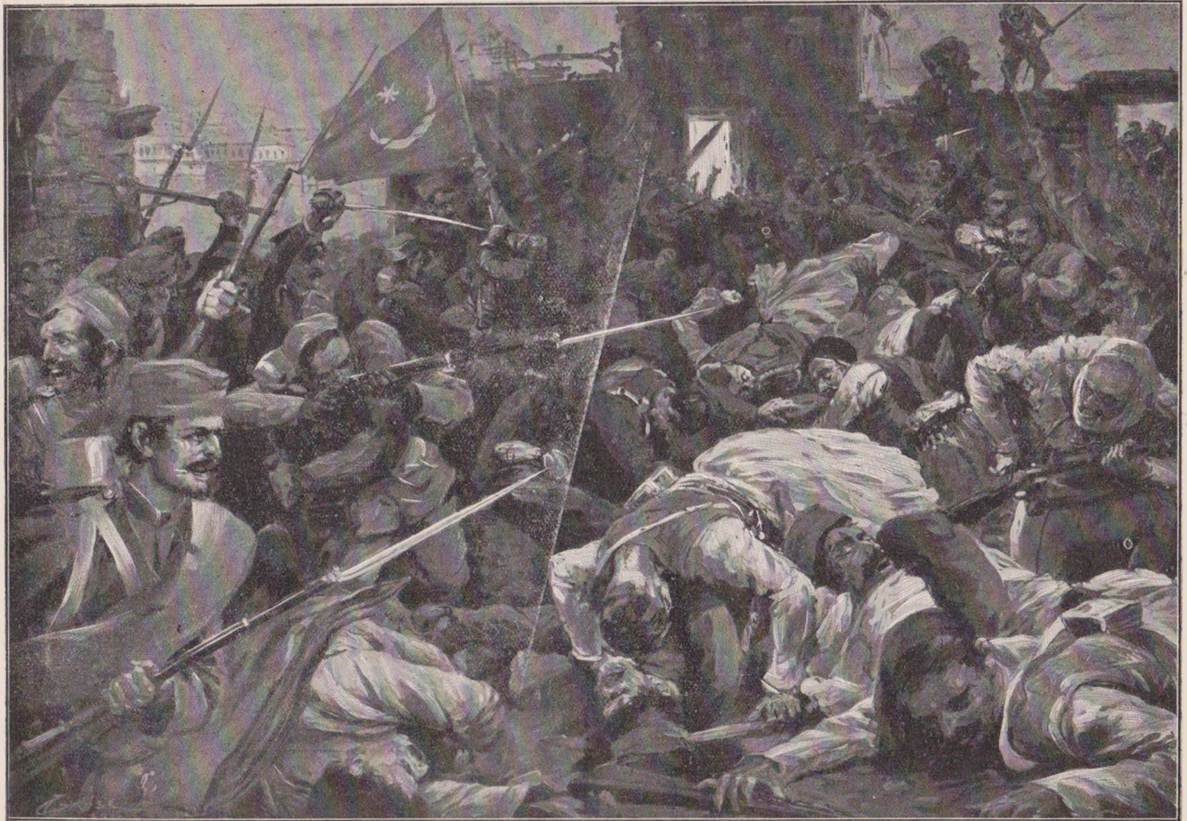
Episod din lupta dela Cumanovo (24 Oct.), dată între Sârbi și Turci. În această luptă Albanezii mahomedani au intrat cu un steag alb. Scena reprezintă ultima lor apărare, având în față un morman de leșuri.