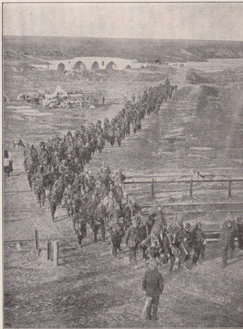
Retragerea Turcilor după bătălia dela Lule Burgas.