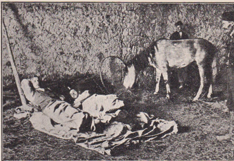
Vieța corespondenților din războiu.

Se știe că la 24 Iunie c. s'a început la Sofia congresul slav. Comitetul organizator al congresului a pus un premiu, pentru cea mai bună poezie de salutare adresată oaspeților Slavi cari aveau să vie în capitala Bulgariei. Congresul a fost considerat de literații moderniști ca operă a Rusiei și tendințelor ei panslaviste, — influență a Rusiei, pe care moder-