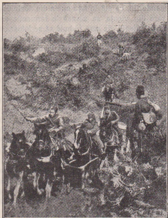
Scenă din fuga Turcilor la Lule Burgas.