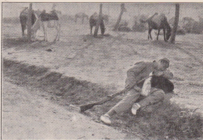
Un soldat montenegrin vizând triumful țării lui.

Eră minciună că înșelase pe d-na Olimpia. Sentința aceasta i se cristalizase mai întâi. El fugise dinaintea Mărioarei. Cu ea nu puteă să se mai întâlnească. Poate se temeă și de domnul Grecu. De aici din depărtare, lucru ciudat, el se puteă gândi, ș'o puteă închipui pe Mărioara. El rămânea ceasuri întregi gândindu-se la toate amintirile ce-l legau de domnișoara Grecu. Incepând cu grădina internatului de fetițe și până la seara despărțirii, el se vedeă în zilele acelea de fericire. Ion Florea urmărea în tăcere desfășurarea acelor tablouri nespuse de frumoase, de curate. O nemărginită părere de rău îi umplea sufletul când Mărioara deschidea poarta și intră repede în noapte. Apoi deodată se cutremură, și ascultă înghețat de spaimă. Din adâncurile ființei lui începeă să vorbească un dușman neîndurat. Vorbea rar, cu glas adânc ca de clopot. La fiecare cu-