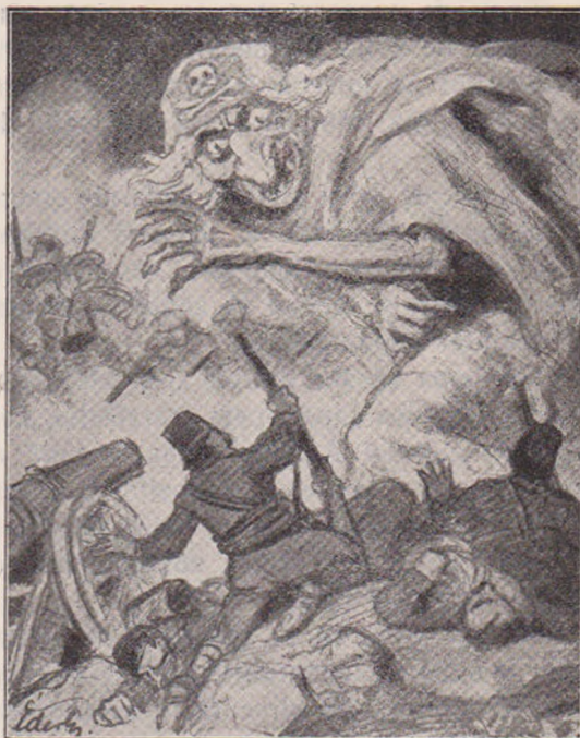
Colera împacând pe Turci și pe Bulgari.

Vieța-i începuse să capete înțeles și farmec și nici nu știă când îi treceau orele până la prânz și cină, în care vreme se îngrijiă mereu cum să mulțumească mai bine pe noul prieten, care știă să vorbească așa de frumos despre atâtea lucruri, de cari bărbatul său habar n'avea, și o înțelegea așa de bine, fără ca ea să-și fi destăinuie cândva durerile sale ascunse.