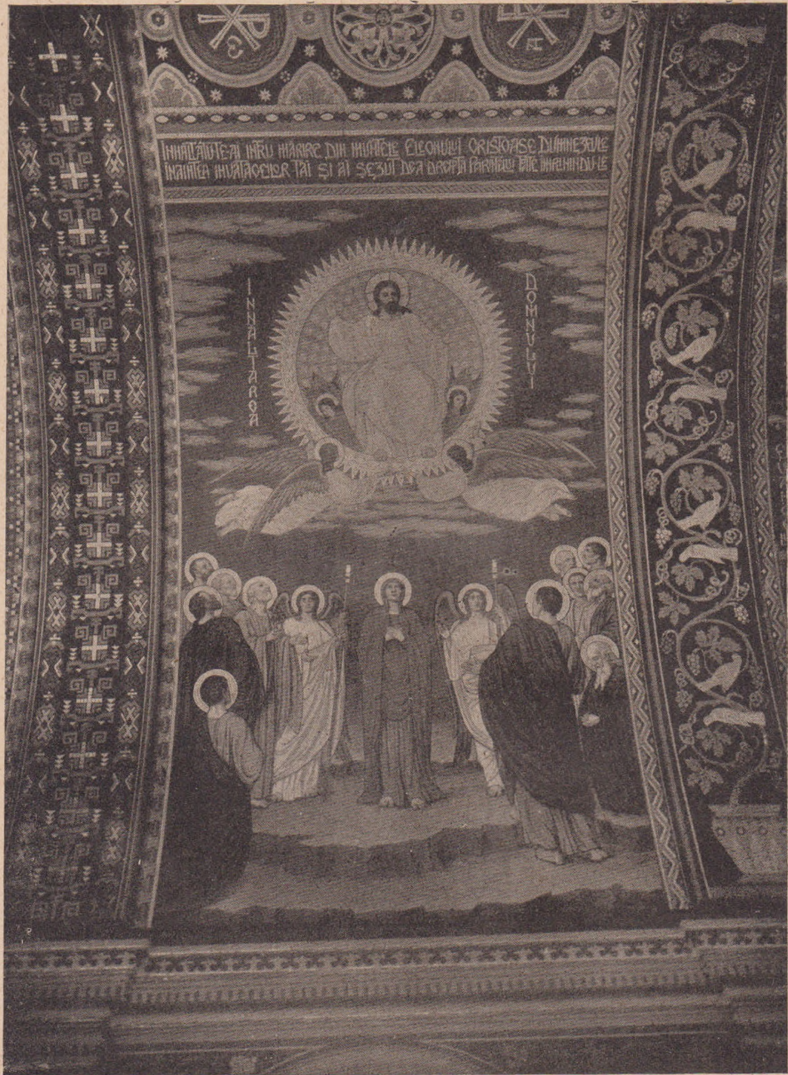
Octavian Smighelschi: Înălțarea Domnului (Biserica din Tâmpăhaza).