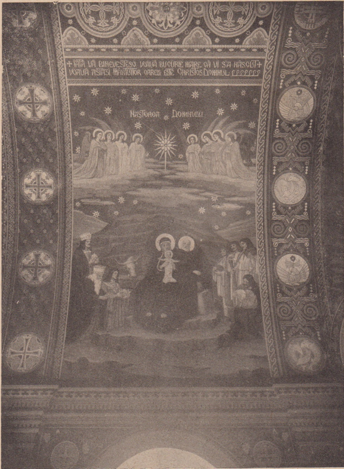
Octavian Smighelschi: Nașterea Domnului (Biserica din Tâmpăhaza).