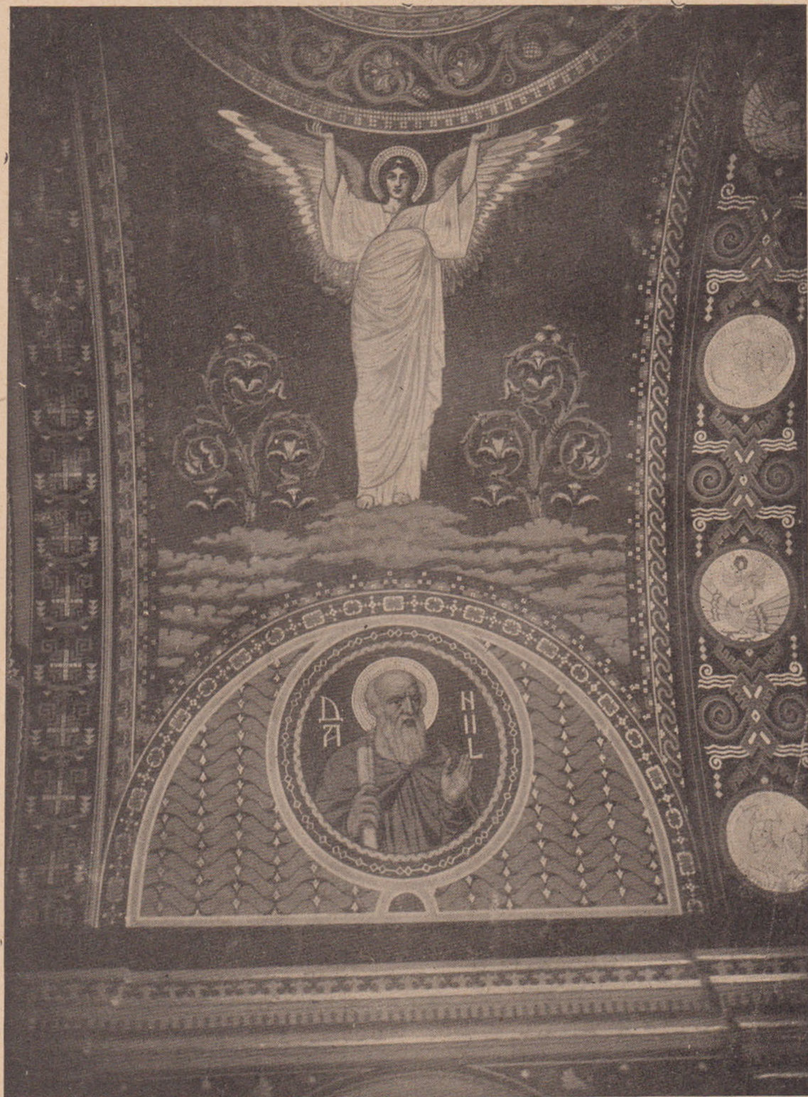
Octavian Smighelschi: Profetul Daniil (Biserica din Tâmpähaza).