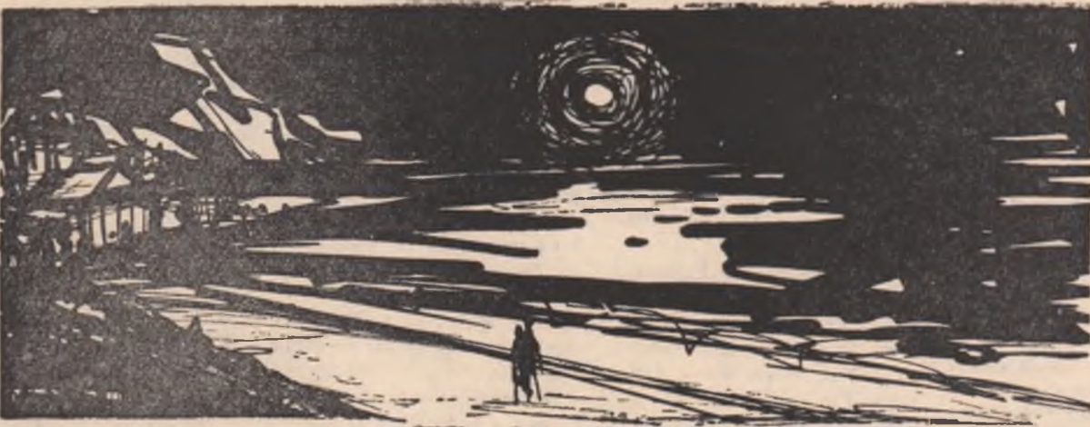
Desen de OANA MIHAI

Iar camera trăiește-o viață-aparte în somnul ei, în mobila cu-arome, în respirarea-atît de-miresmată și străvezie, ca răcoarea lunii. În preajma ei sint plăci de patefon. Și cărți. Un cronometru. Și o lance. Mașinile gonesc spre Sevastopol, pe-autostradă, sus, fără de somn, descoperînd cu fururile-acide tăcuții-ndrăgostiți îmbrățișați. Luminile ard încă pe terasă. Ce rost mai au? Acolo au dansat uitîndu-le aprinse cînd plecară.