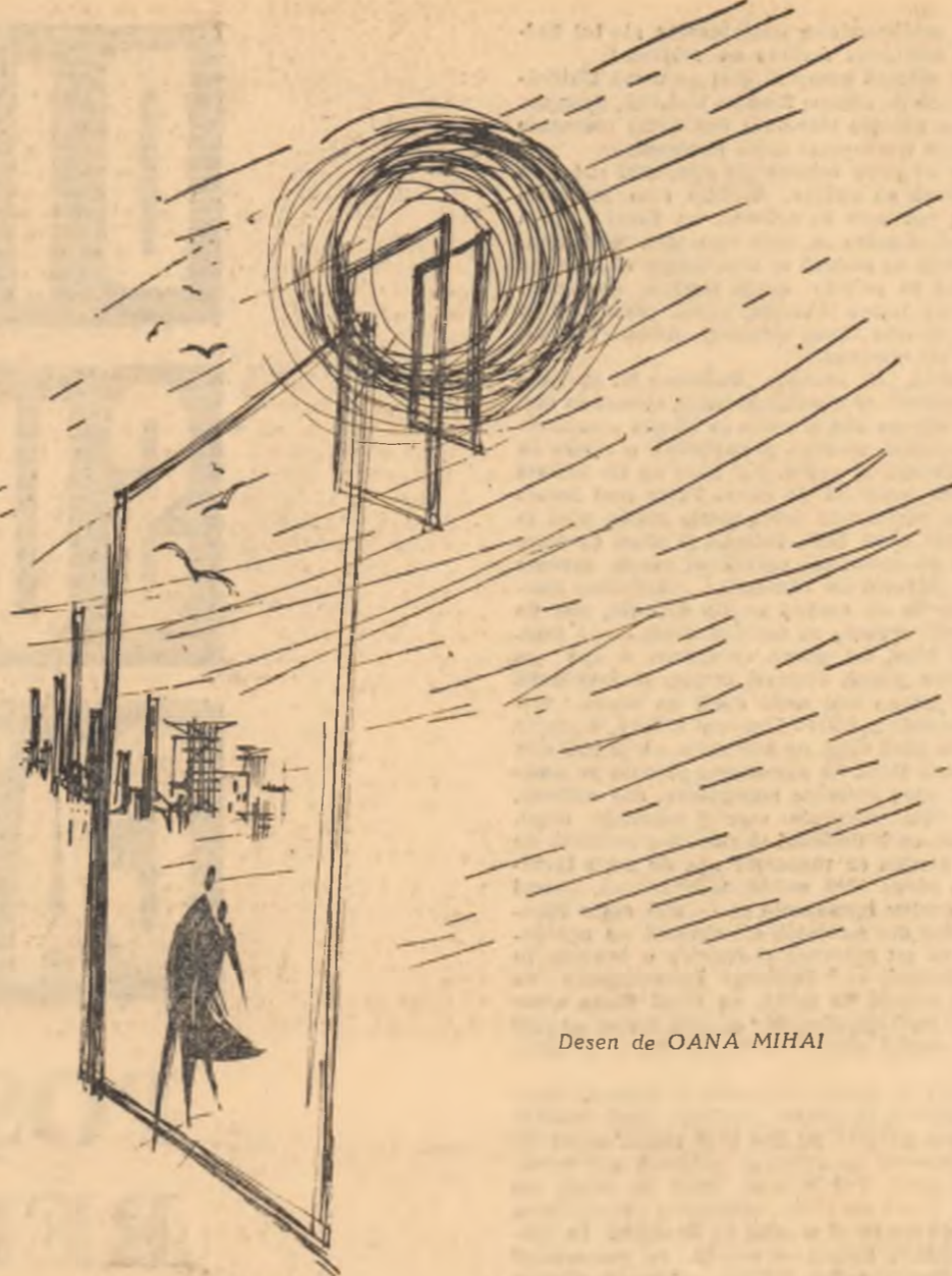
Desen de OANA MIHAI