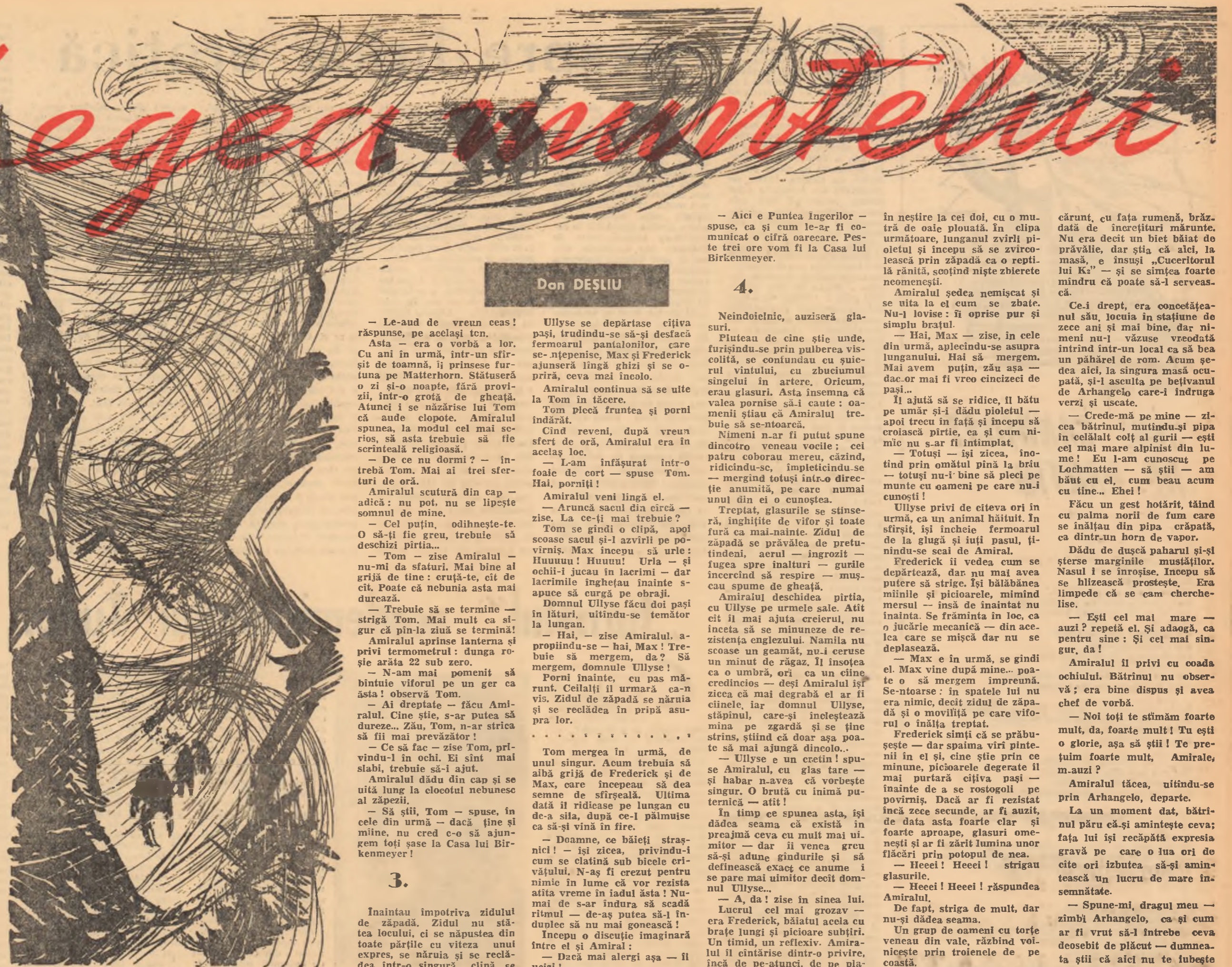
Desen de NICĂ PETRE

— Cred că ne-am ars! făcu Amiralul, fără să-și dezlepească privirea de un punct ipotetic, aflat undeva, în slava cerului. — De ce? Ce s-a întâmplat? — Tom, băiete, la uită-te-acolo... nu, ceva mai la dreapta, peste creneluri! Ei?