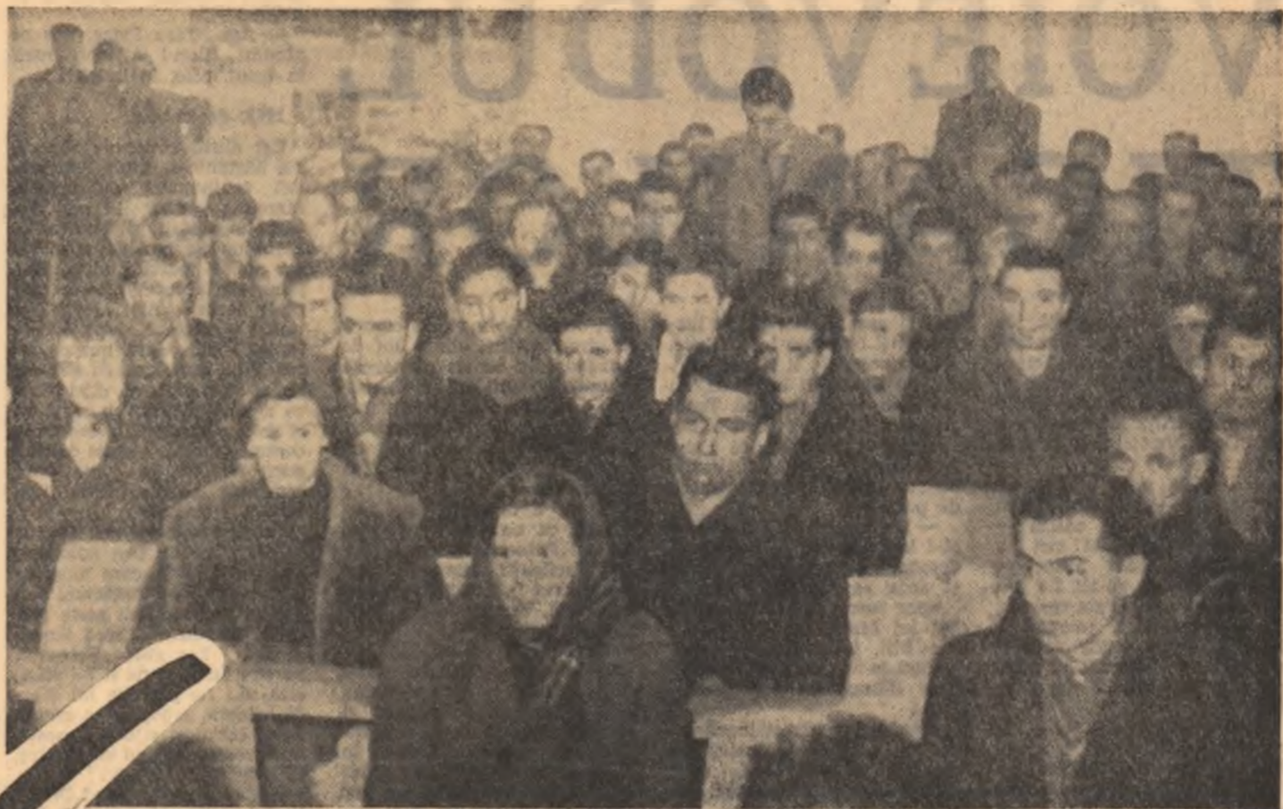
Un aspect din sală

Mi-a plăcut foarte mult vo- lumul Frunze de Argezi, apărut recent. În el am găsit o expresie a tîneretului, cu to- ate că vîrsta marelui scriitor este înaintată. Versurile din acest volum sînt excepționale.