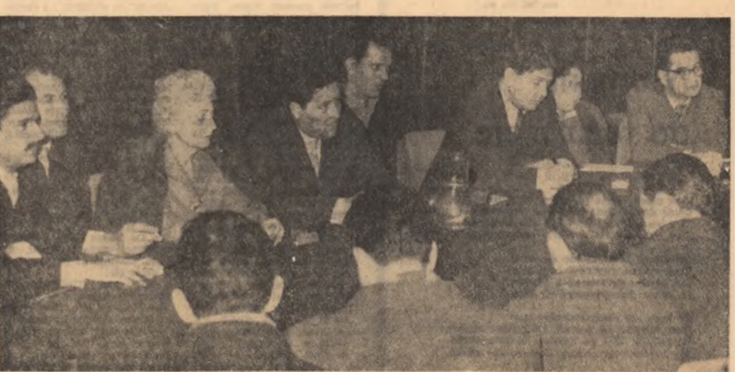
Scriitorii participanți la consfățuire

S-a referit la problema lim- baului în unele romane, arătînd că stilul cîrților este ofte, odată greoi, prezentînd difi- cultăți de înțelegere pentru ci- titori.