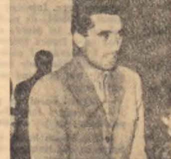
Criticii de la Uzinele „Republica“ își spun cuvîntul.