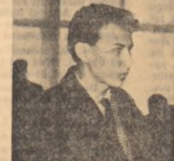
Criticii de la Uzinele „Republica“ își spun cuvîntul.