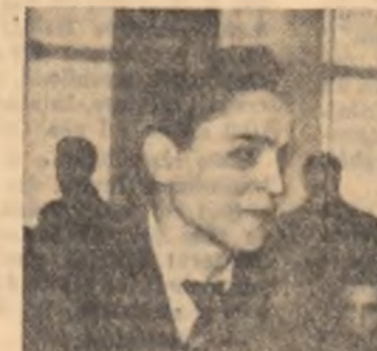
Criticii de la Uzinele „Republica“ își spun cuvîntul.

de a stimula pe scriitor să scrie la un nivel artistic înalt, care să fie demn de marile fapte eroice ale oamenilor muncii.