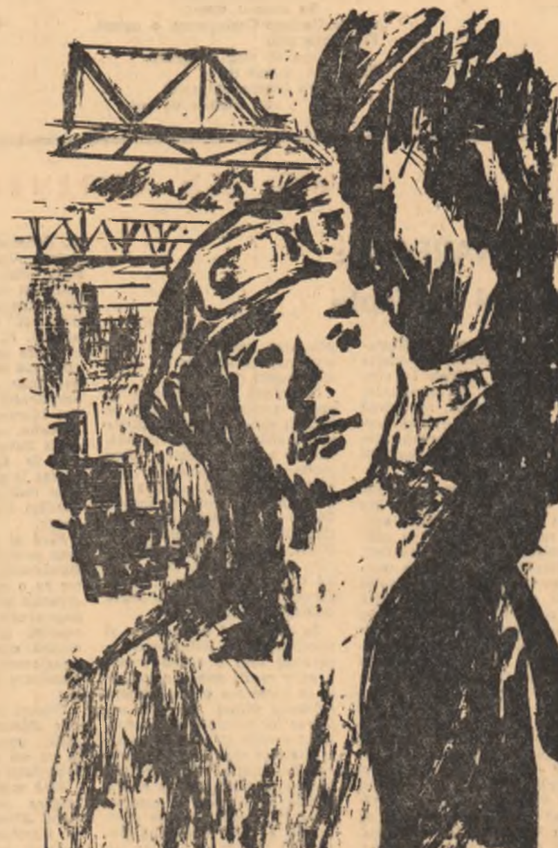
Desene de V. SAVONEA