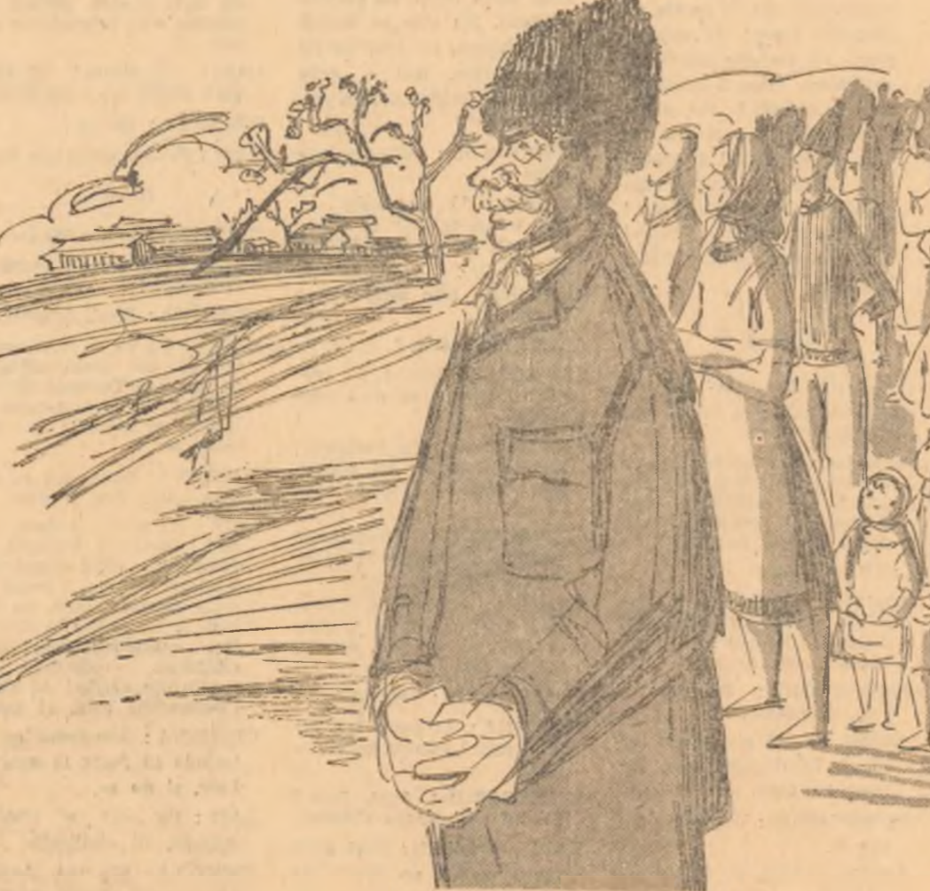
Desene de TIA PELTZ