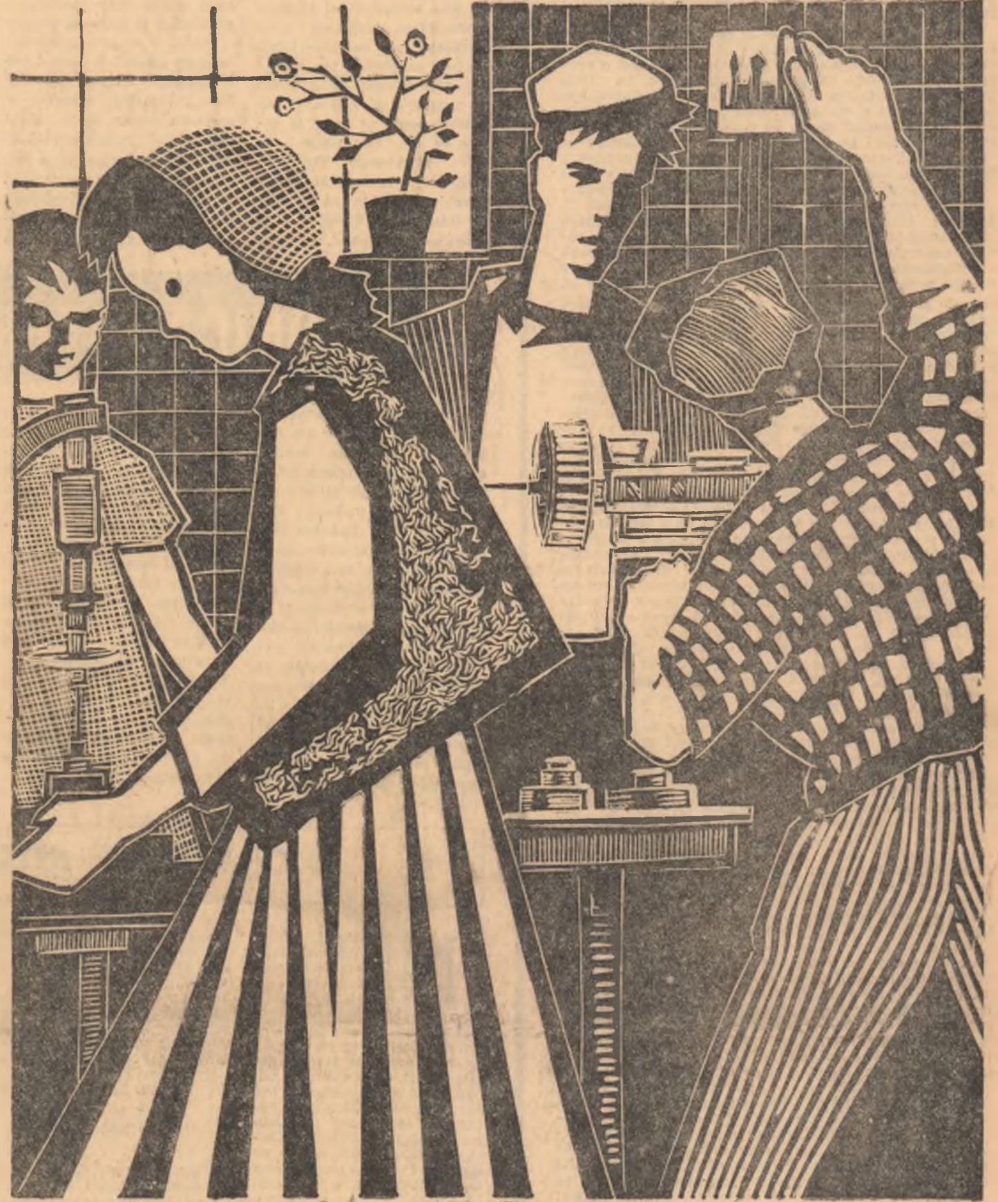
ELEVI LA PRACTICĂ (linogravură)