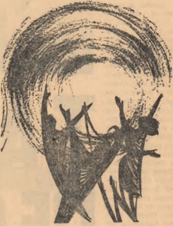
Desen de NICĂ PETRE