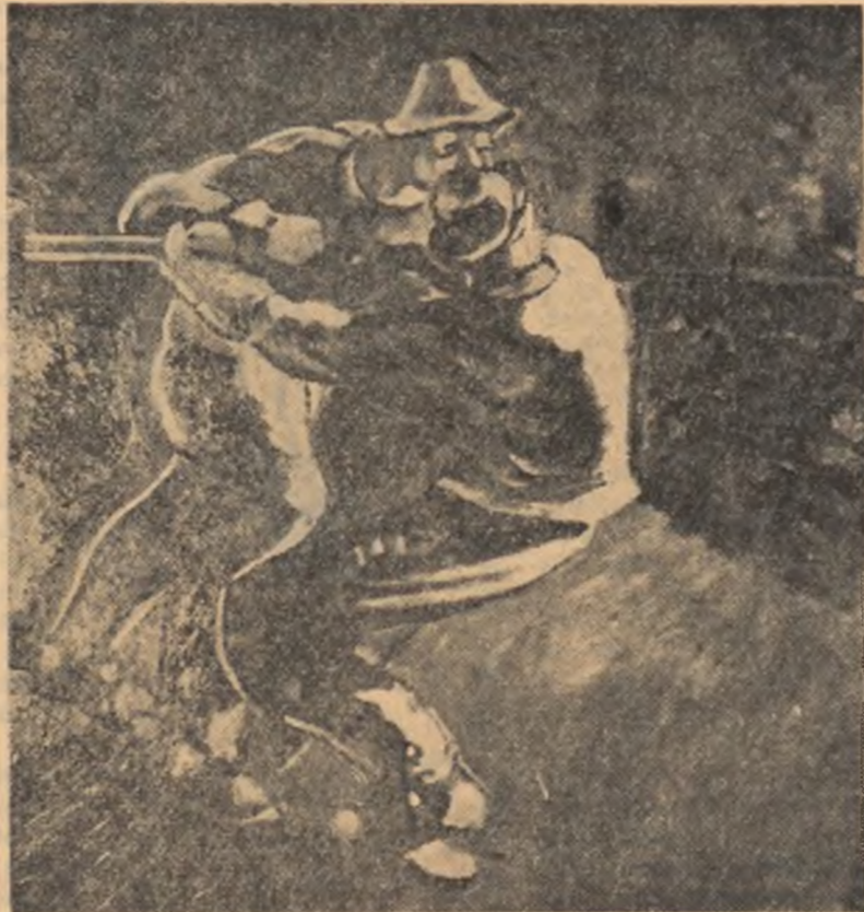
FURNALE POPOVICI AUREL-Oțelara