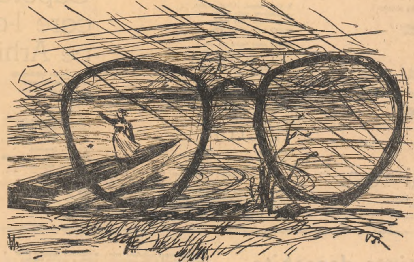
Desen de V. SAVONEA