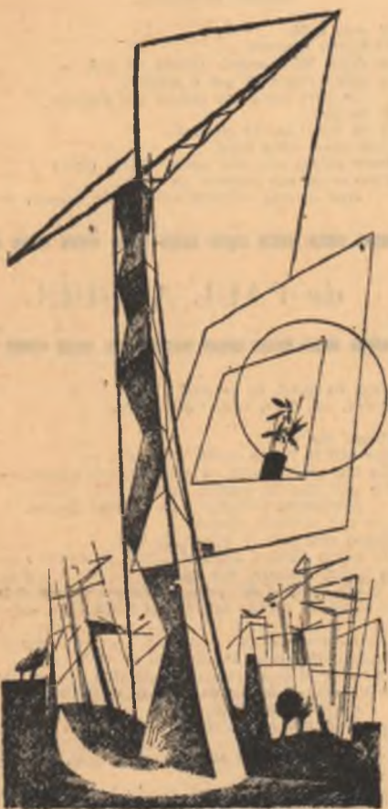
Desen de N. ȘERBAN

Nici un suspin, nici o culoare tristă, — cresc gloriile noastre în ritm egal. Mărețe, patria socialistă Străluce-n noi ca flacăra-n metal.