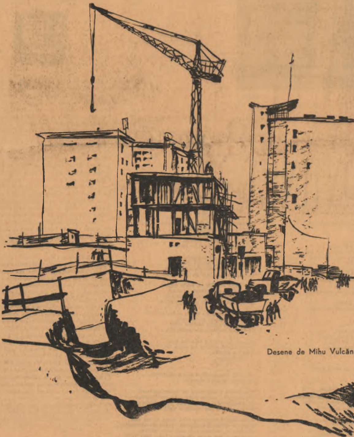
Desene de Mihai Vulcănescu

Curios! Nu doresc tumultul marilor orașe care aci e înlocuit de acela al muncii, de urcusul treptelor către un scop bine cîntărit dinainte, coordonat. Frenesia sterilă a marilor bulevarde s-a schimbat într-o agitație creatoare, plină de satisfacții reale. Sînt atât de nerăbdător să urc aceste trepte!