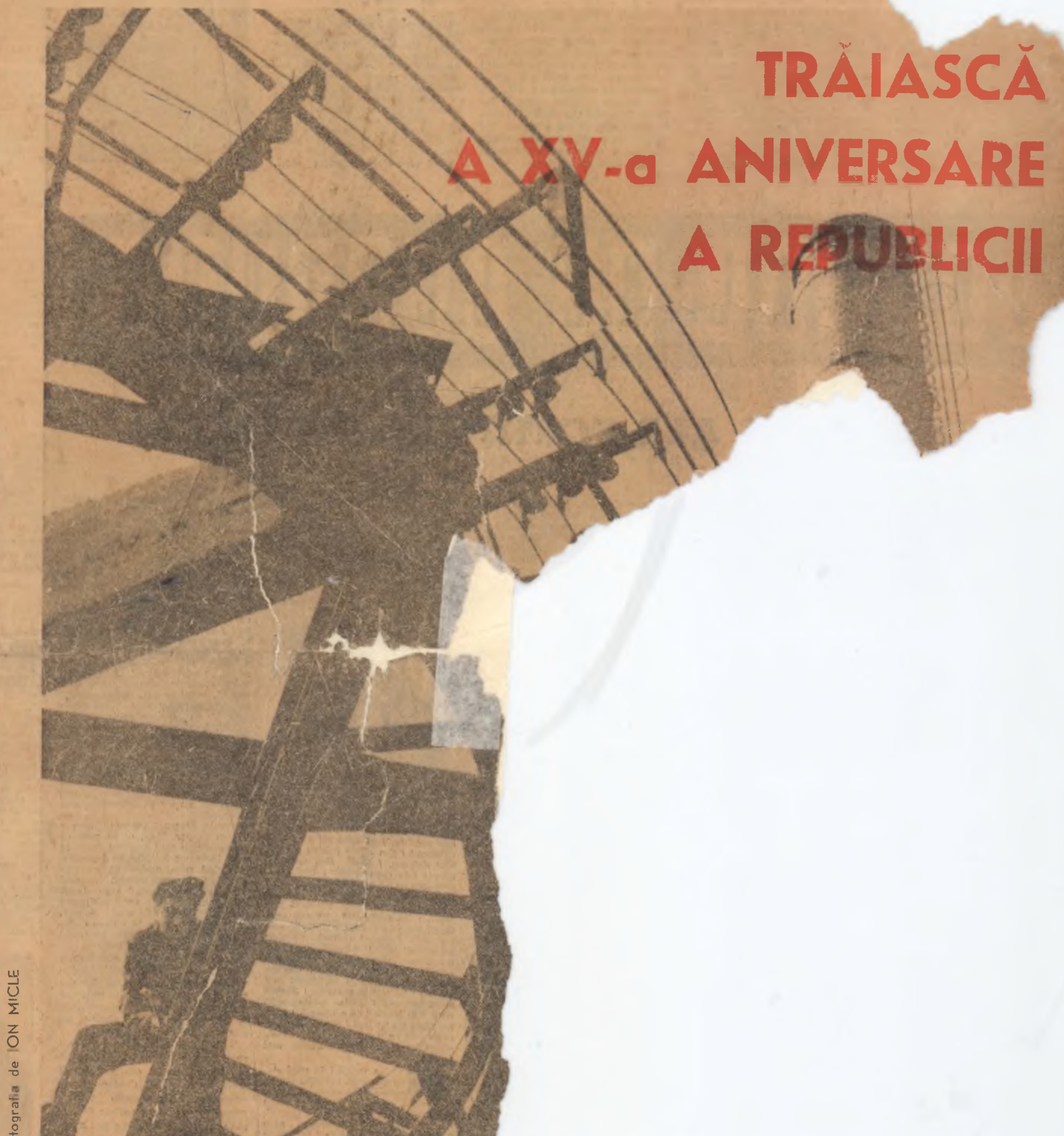
Fotografia de ION MICLE

Mi-ți inima asemeni cu-o stemă-a țării-ncît O porți cu-n fruntea unei sărbătorești coloane, Trecînd prin leța lumii cu pasul hălărit, O inimă cum încă sînt opt'șpe milioane.