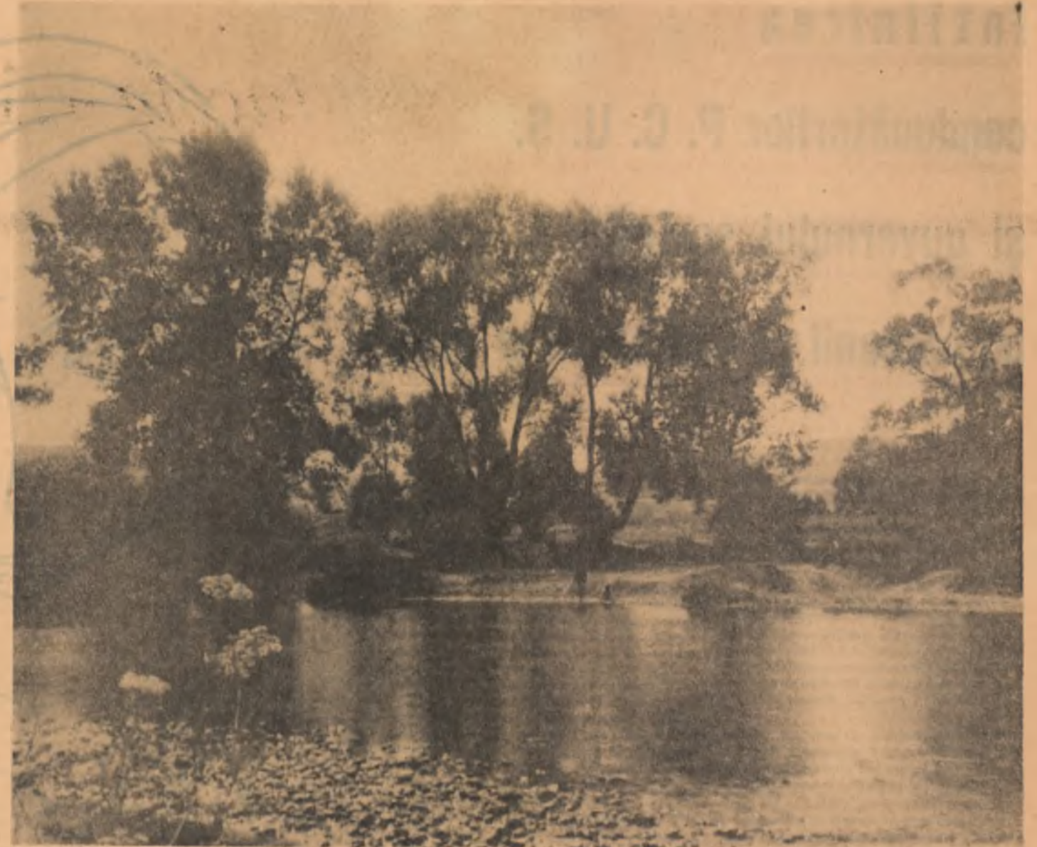
PEISAJ PE SOMEȘ