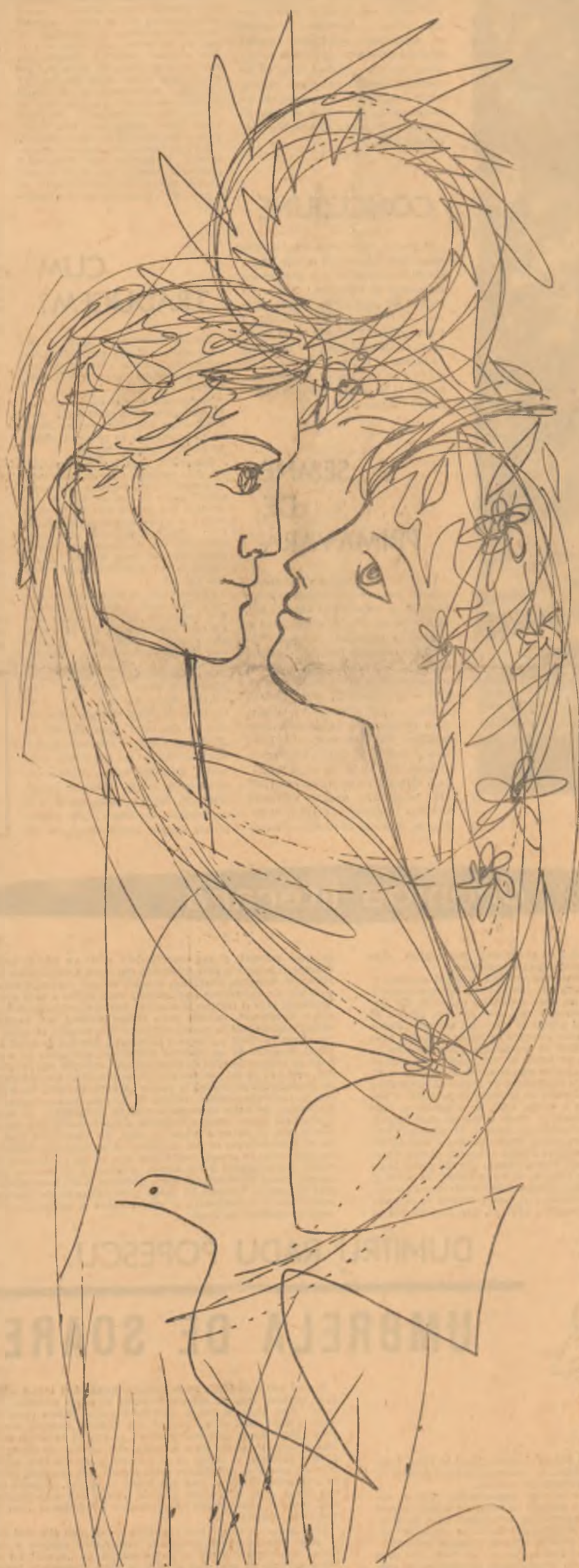
DESEN DE EUGEN MIHĂESCU