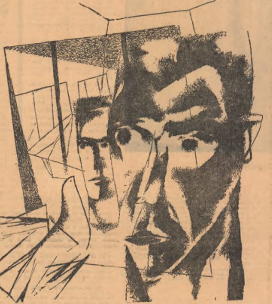
Desen de N. ȘERBAN

— Ei, asta-i! Anulat! Ștampilat! Rechiționat! Aștia îți iau zilele și nu ți le mai dau, își bat joc