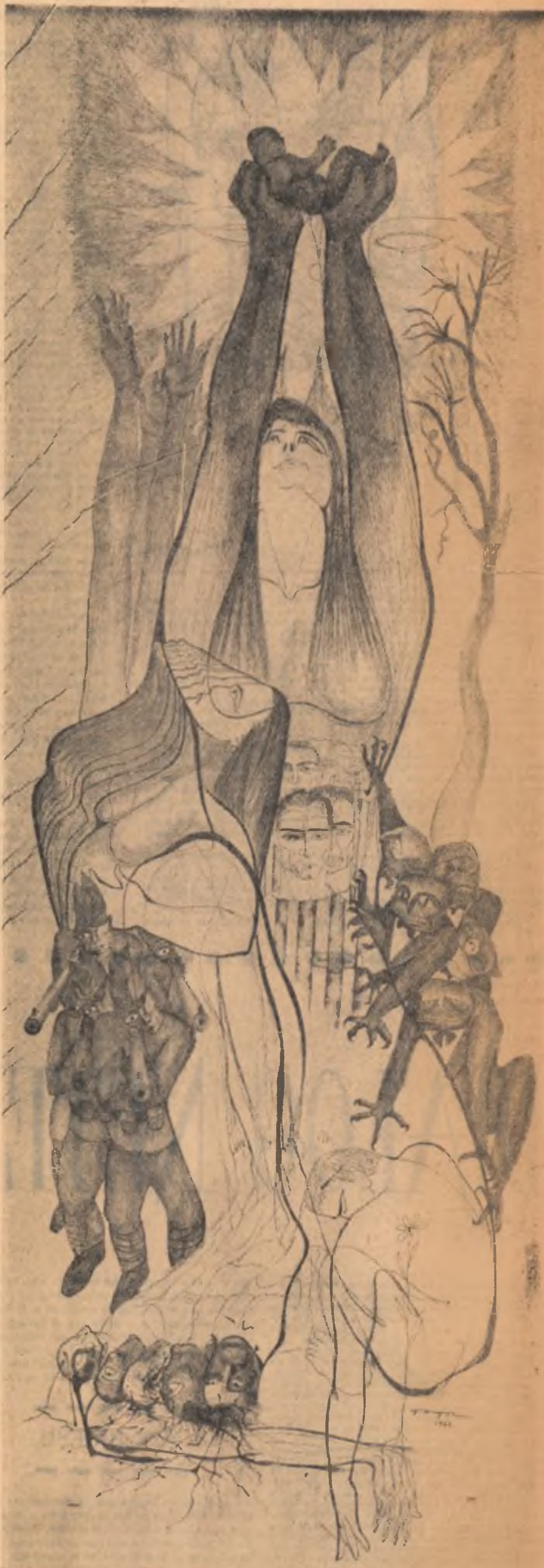
Desen de VICTOR CUPȘA

Primește cititorule această încercare-a mea de cîntec, tinerească, iar unde nu s-a smuls deplin din minereu cu inima o prelungesc, cu trupul meu.