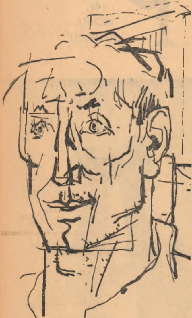
Desen de DONCA IOAN

Înainte de miezul nopții, Achim văd că era în lan, cu seceriștoarea, rupsesse cuțitele, iar cele cinci greble, fixate în trunchiul catargului, se-nvâneau în gol, ca aripile unei mori de vânt. Pe podul de tablă, lucios, un iepure de cimp, gras, cenușiu, sălta și se rostogolea peste curmezeșul grebelor : ochii lui cit alcele, nărginiți de-o dungă roșie, scinteau umezi în aerul fraged. „Îți bați joc, spuse Achim. Săi că te pun cu o botul pe labe !” Luă sfoara pentru legat snopi, făcu un laț și, o mișcare rapidă, neașteptată, îl aruncă înapoi și iepurele se pomeni purtat pe sus, cu gîtul strîns ca într-un cerc de gheață. „Uite, că te-ai dus pe copcă, îi spuse Achim, zăbănitor. Să văd acum dacă-ți mai dai mina săo o faci pe năgarul cu mine” — și-l îndesă în buzunarele pantalonilor. Iepurele îl bătu scurt, în coaste, cu lăbuțele. Achim rise, apăsându-l o-zăcinte o-aldului, și-n clipa aceea, cuțitele seceriștoării începuseră să taie din nou, retezînd, o dată cu patele, lumina albă care juca la suprafața lanului.