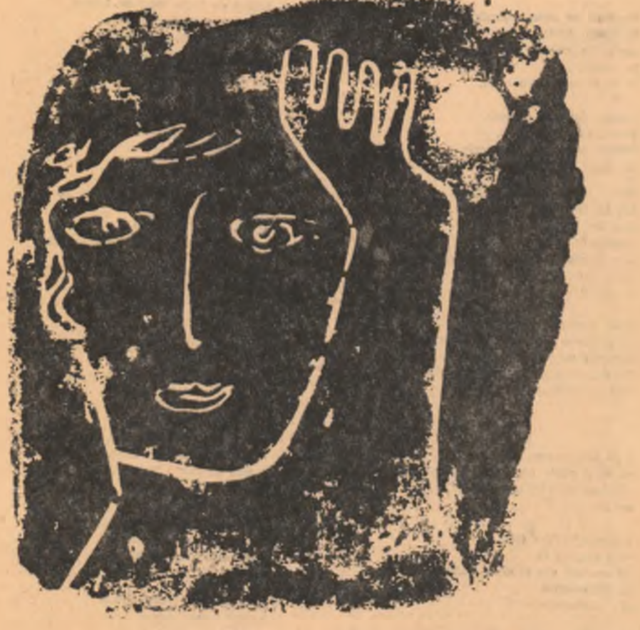
Desen de DAN IONESCU