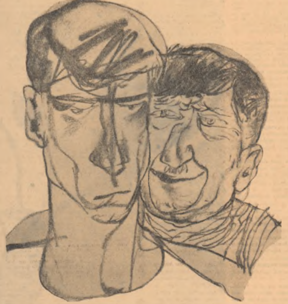
Desen de POMILIU DUMITRESCU

Electricianul se potănește îndărătnic, mai face un pas și rămîne proptit de aripa mașinii. Mîria ceva și întinde gît înainte. Ochiul îi rămîn piro-