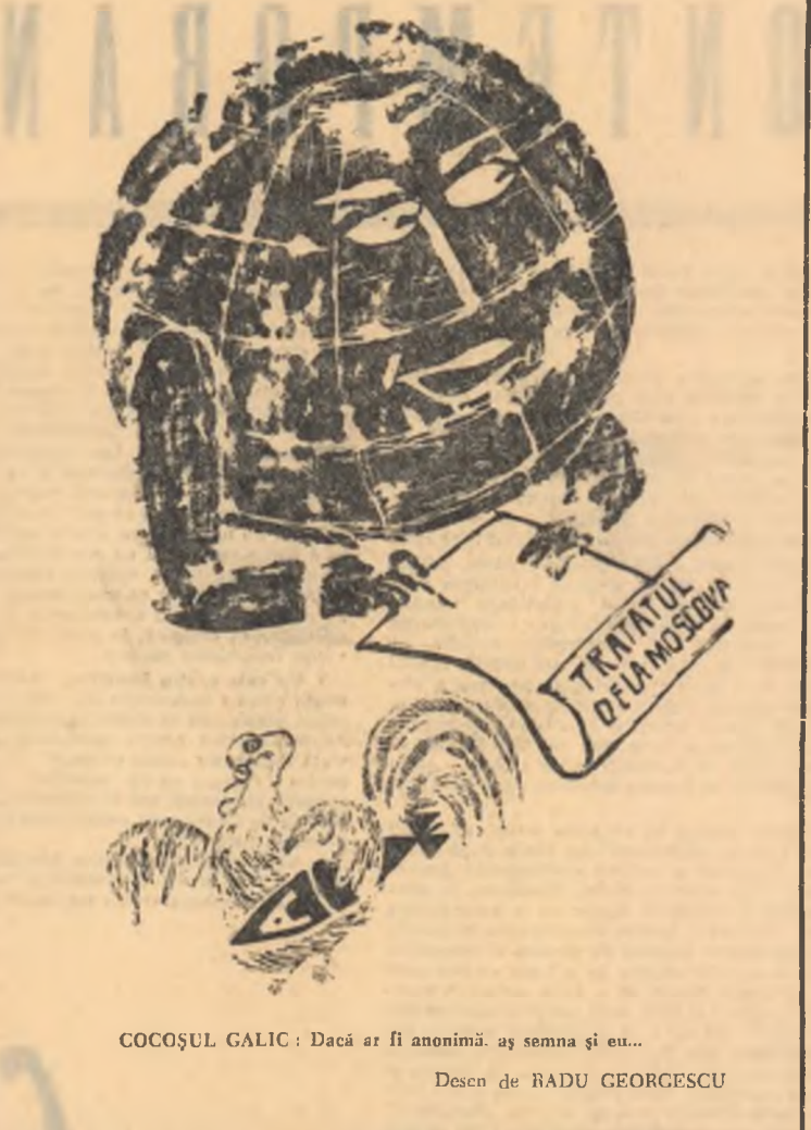
Alăgîndu-și protestele popoarelor, guvernul francez coborîndu preapătirile în vederea electurii de noi experienze nucleare.