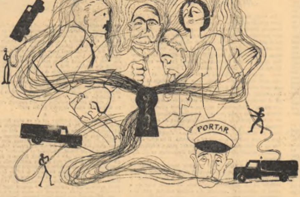
Desene de V. CUPȘA