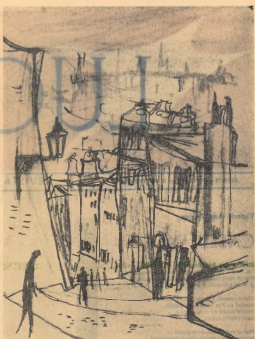
EUGEN MIHĂESCU — PEISAJ DIN PRAGA