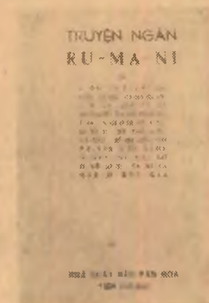
Povestiri românești — Clasici și contemporani — (R. D. Vietnam)