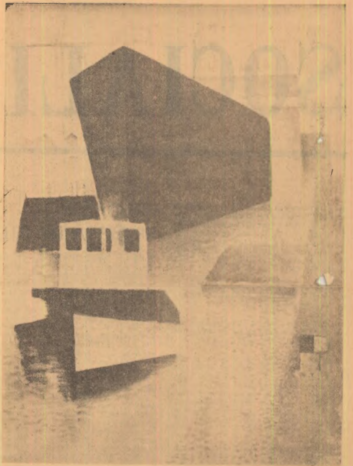
CONSTANTIN PAULEȚ: „Cargou lansat”