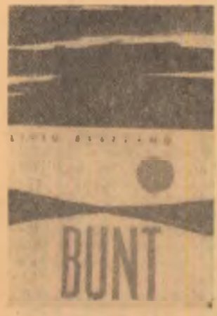
Lidia Rebreanu Răscoala (R. P. Polonă)