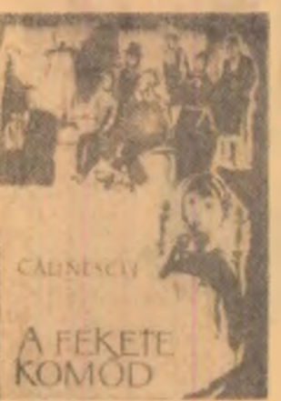
G. Călinescu Scribul negru (R. P. Ungară)