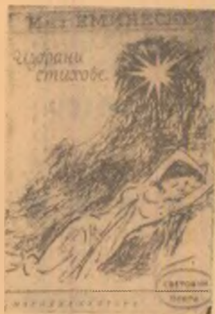
Mihai Eminescu Versuri alese (R. P. Bulgaria)