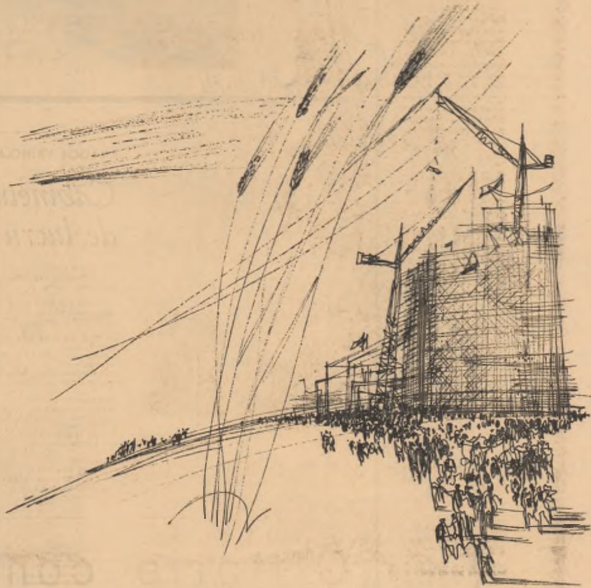
Desen de EUGEN MIHĂESCU