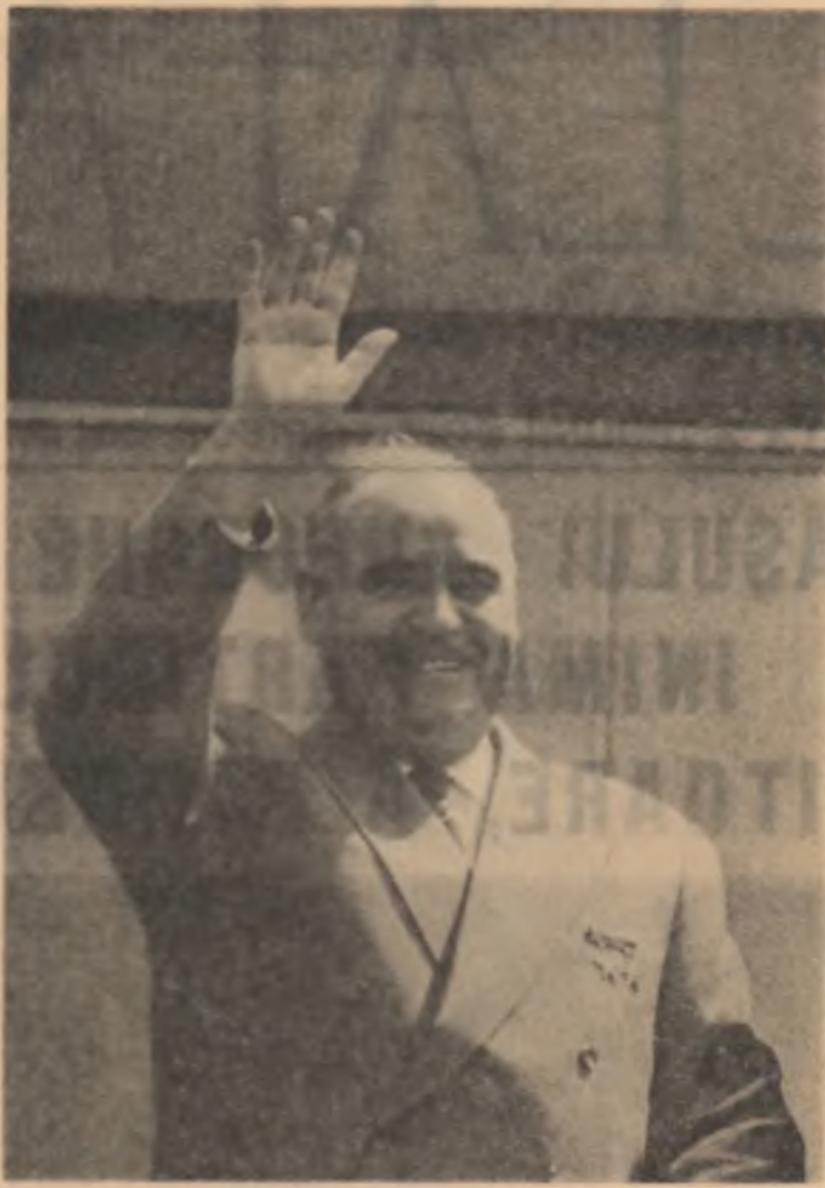
Adine marea de paraxmasă moarte care a răpit din mijlocul nostru pe tovarășul Gheorghiu-Dej, solidar cu milioanele de oameni ai muncii, deplin în dispartia lui, pierderea celui mai încercat și înțelept conducător al poporului nostru.

Ridicat din mijlocul poporului, el s-a identificat cu aspirațiile lui, care l-au înclădit energia unei lupte neînfrînte pentru împlinirea visurilor lui de dreptate, libertate și lumină. Prin încrederea lui în viitorul poporului său, prin căldura sufletească și generozitatea care l-au înclădit toate acțiunile, a înfățișat cele mai alăse călăuzi ale poporului nostru. Așa se explică profundul lui umanizant, preocuparea „atarnată” de a răspunde în masă populară cele mai înalte ecereri ale gândirii și artei.