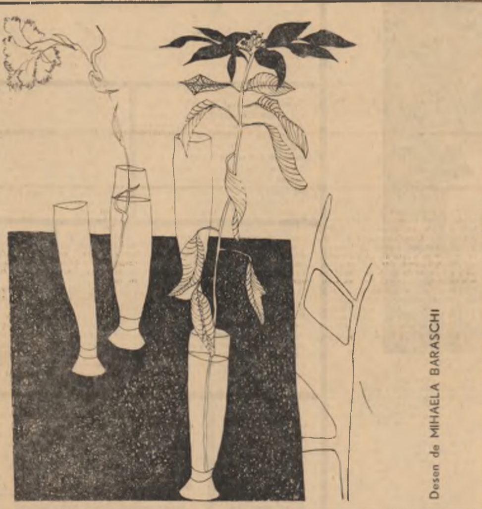
Desen de MIHAELA BARASCHE

Și fără gînd de bătălie ne regăsim învingători, copii și tată și soția plantați de vii între culori.