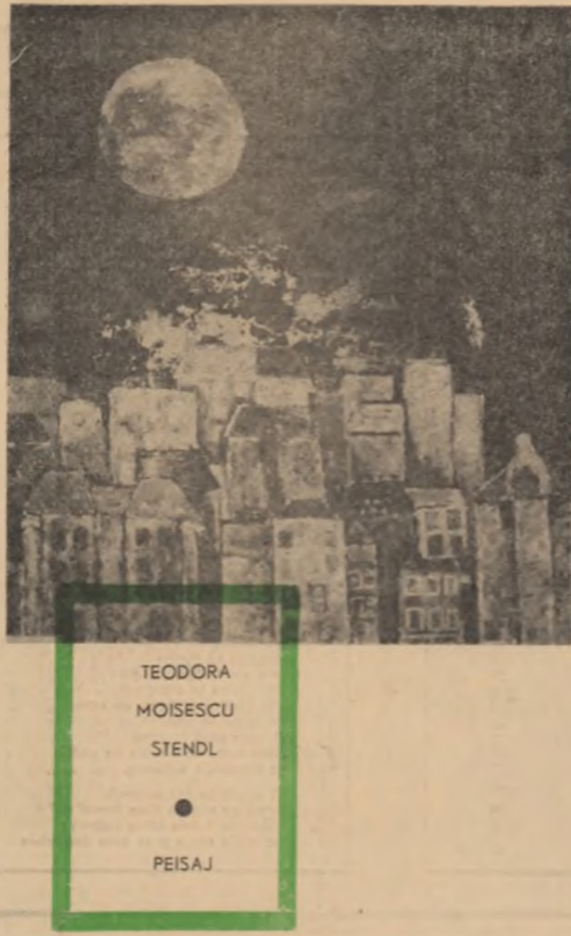
TEODORA MOISESCU STENDL PEISAJ