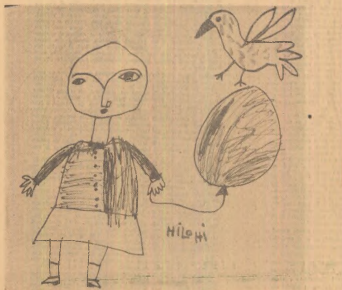
CRISTINA HILOHI (5 ani) — Portret (tuș colorat)