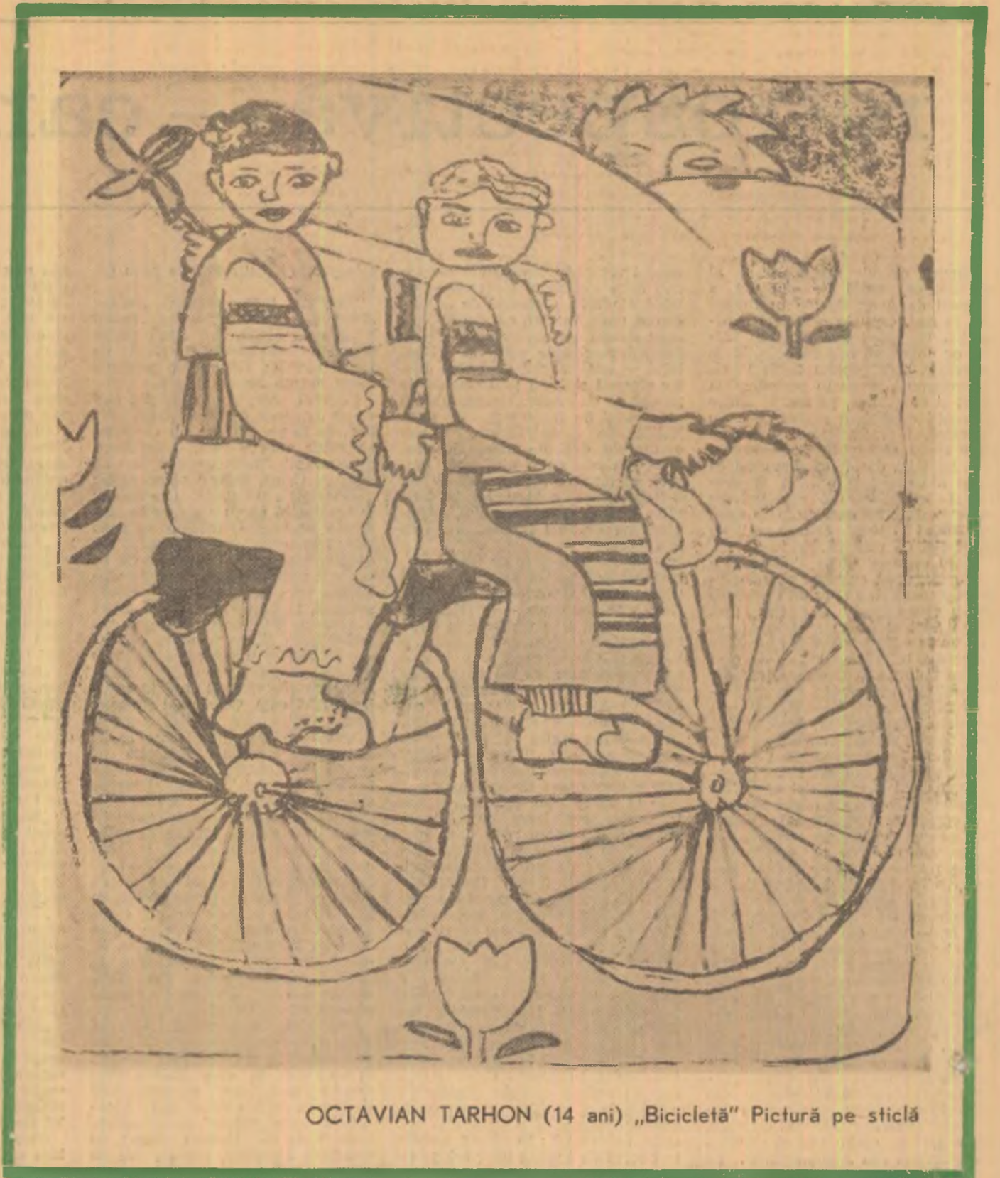
OCTAVIAN TARHON (14 ani) „Bicicleta” Pictură pe sticlă