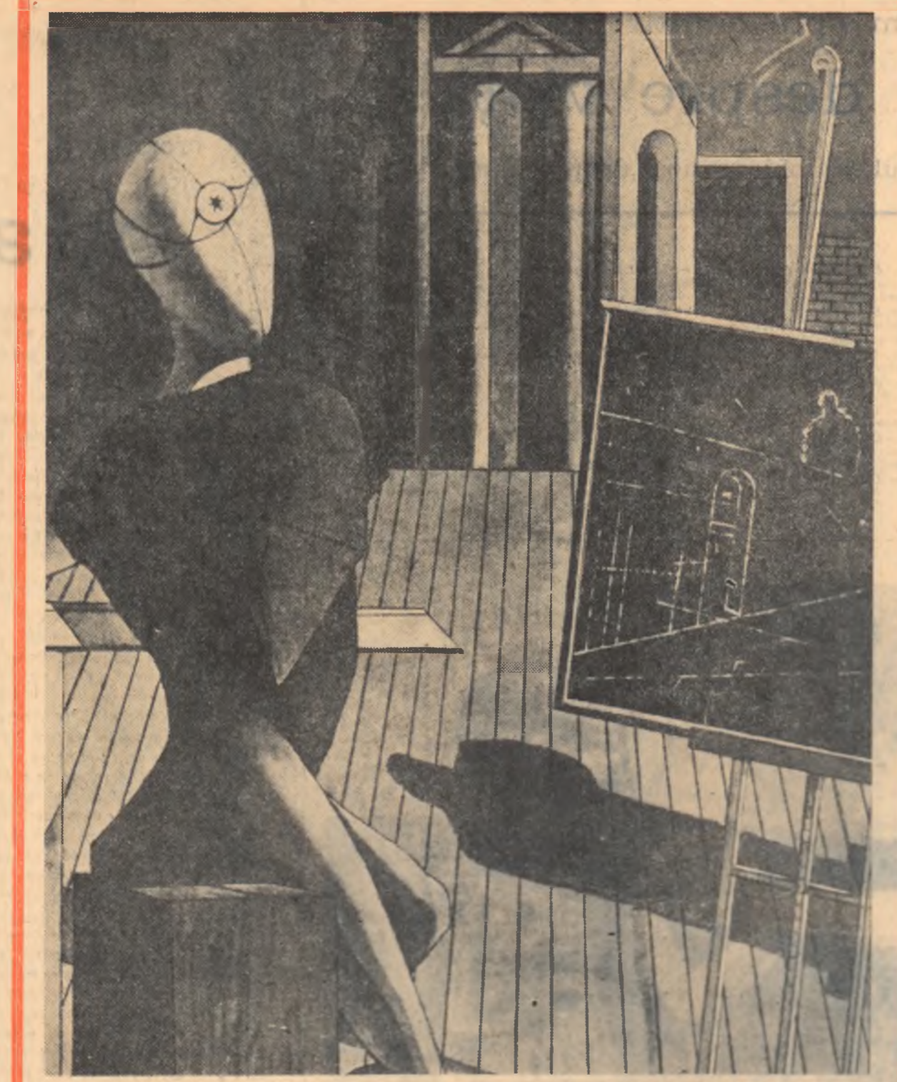
GIORGIO DE CHIRICO: „Vizionarul”

„Inteligența normală”. — Ce poate să însemne formula aceasta? Care e criteriul normalității în materie de inteligență? Statistica? În tot cazul, cînd spunem despre o inteligență că