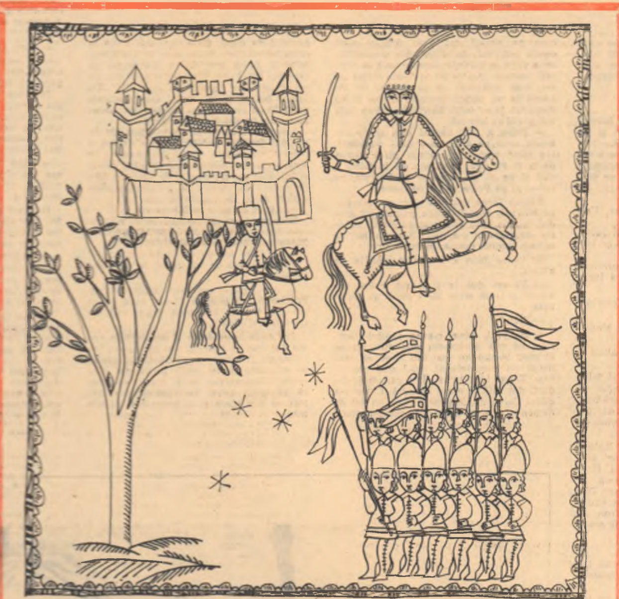
Desen de MIHAELA BARASCHI

Bănică Bănișor cu lan' Parasca și-ov păpat bolii dela plugurar.