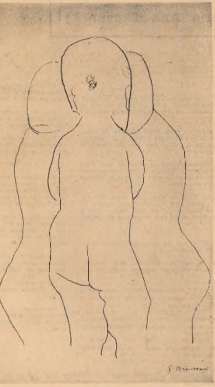
Șchiță de C. BRÂNCUȘI

Mai înainte de a fi un cioplitor, Brâncuși este un filozof în înțelesul major pe care-l avea noțiunea în antichitate.