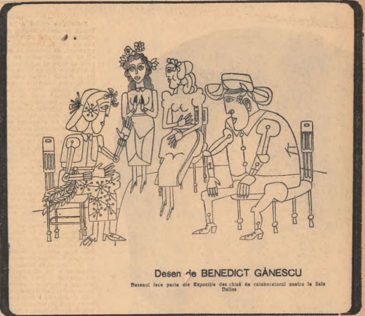
Desen de BENEDICT GĂNESCU Desenul face parte din Expoziția de chestii de colaboratorului nostru la Sala Dalles