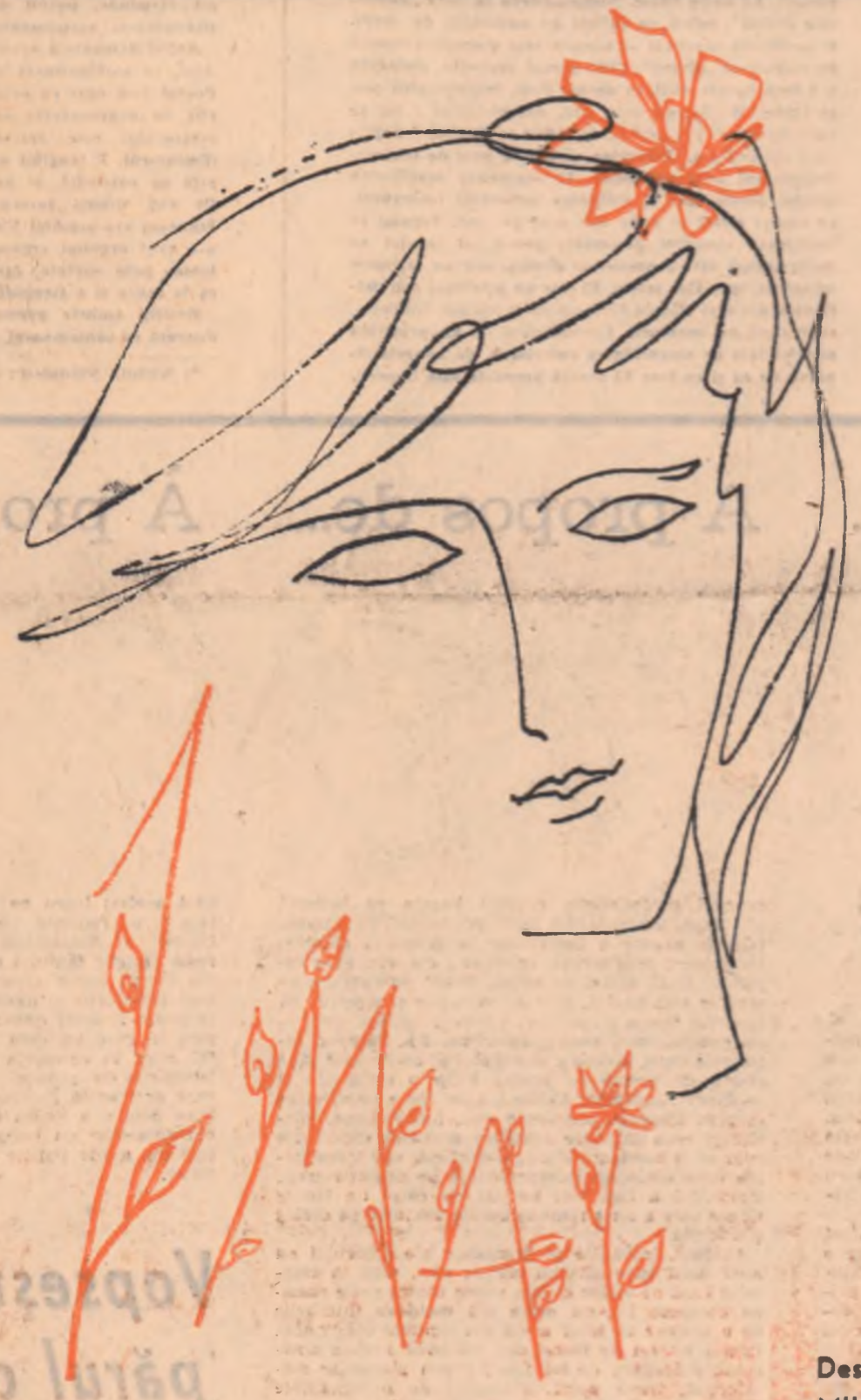
Desen de MIHU VULCĂNESCU