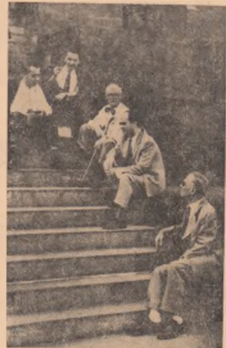
Cu soritorii sirbi

Nu cred că e lipsită de interes pen- tru documentare, citirea celor citorva rînduri pe care Arghezi le-a scris în cartea de aur a Muzeului Militar, or- ganizat în fostul fort Kalemegdan, vi- zîndu-l în ziua de 22 iunie 1962, după ce a străbătut toate galeriile lui de arme, bravuri și documente ilustrînd relațiile istorice ale popoa- relor iugoslave cu vecinii tuturor timpurilor: „Dovezi mari și pildui- toare despre cum un popor încărcat