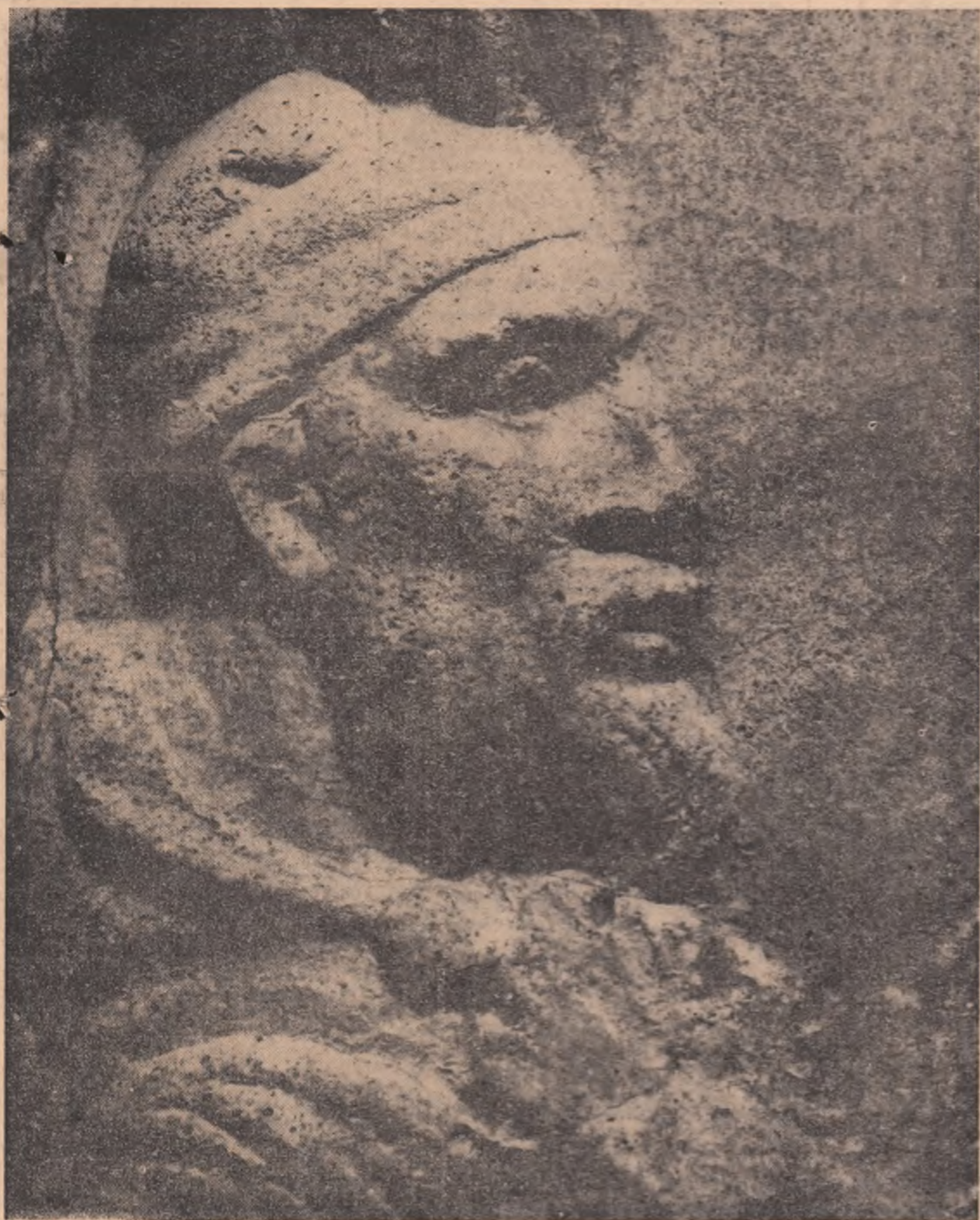
ROMANIA ANTIQVA de ION NICLEA, ce e proiect de CONSTANTIN DAICOVICIU și alții găsiți de ION BRAD — esk liber la EDITURA MERIDIANE