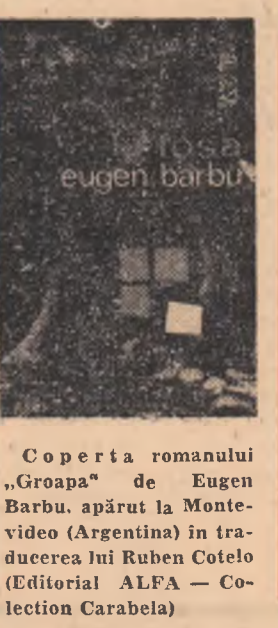
Coperta romanului „Groapa” de Eugen Barbu, apărut la Montevideo (Argentina) în traducerea lui Ruben Cotelo (Editorial ALFA — Colecția Carabela)