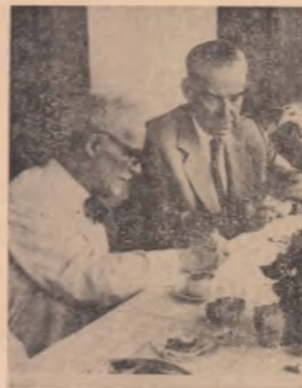
TUDOR ARGHEZI și IVO ANDRICI

I-am fost mina dreaptă în toate vi- zitele, în toate întîlnirile, prin toate