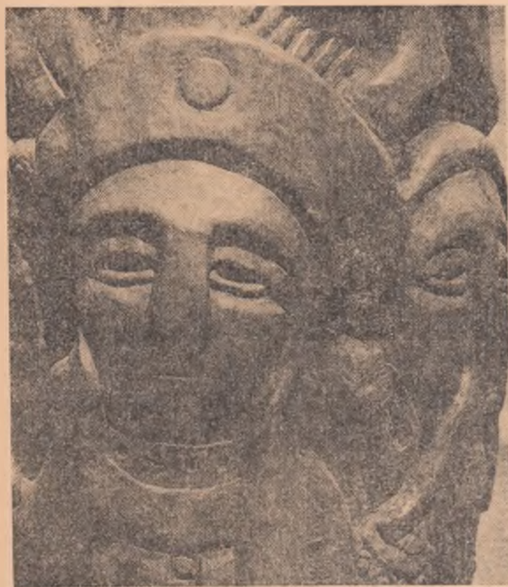
Sculptură de BOGOSAV ZIVCOVIC