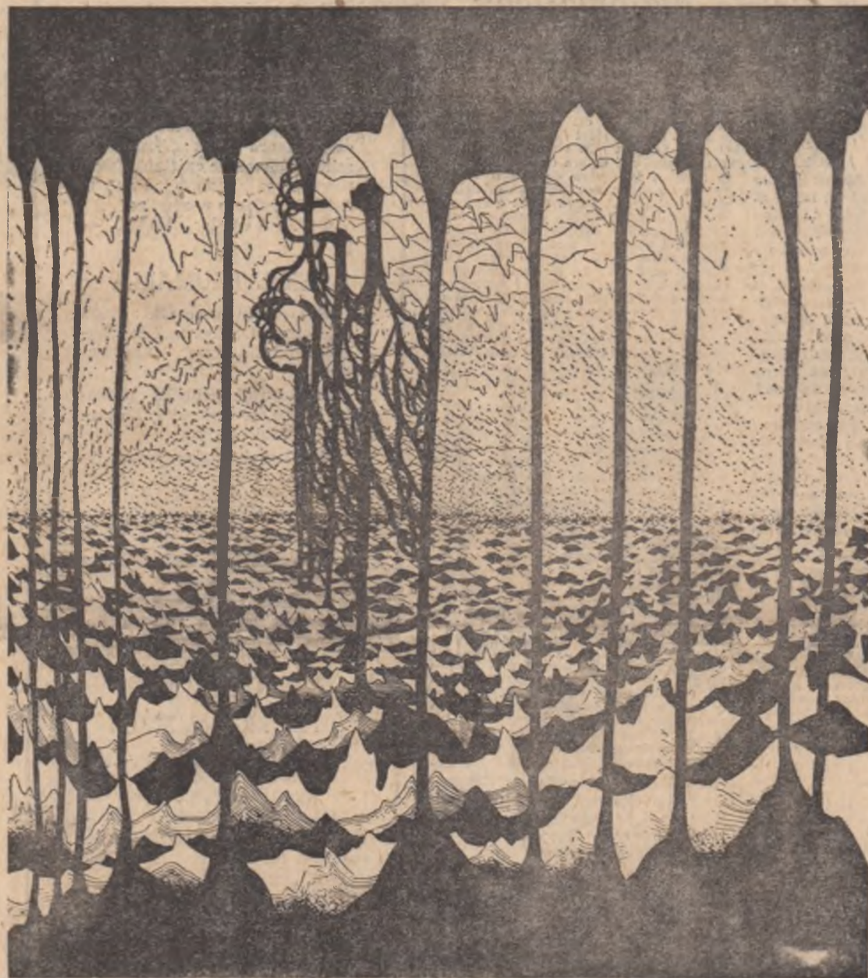
Desen de FLORIN PUCA