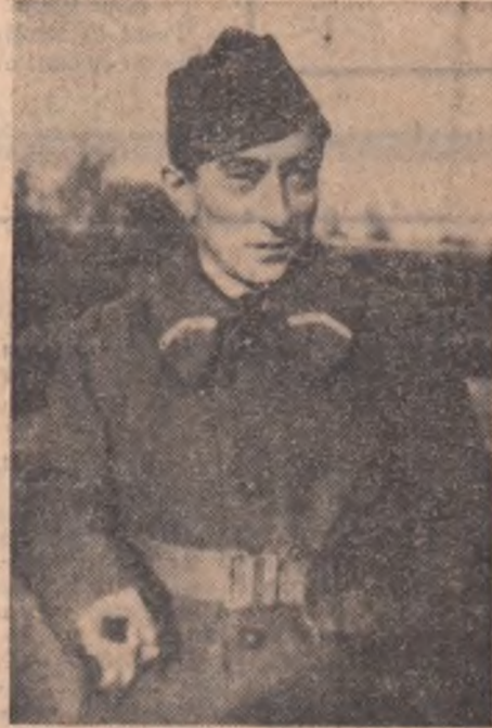
IPOSTAZE ALE POETULUI