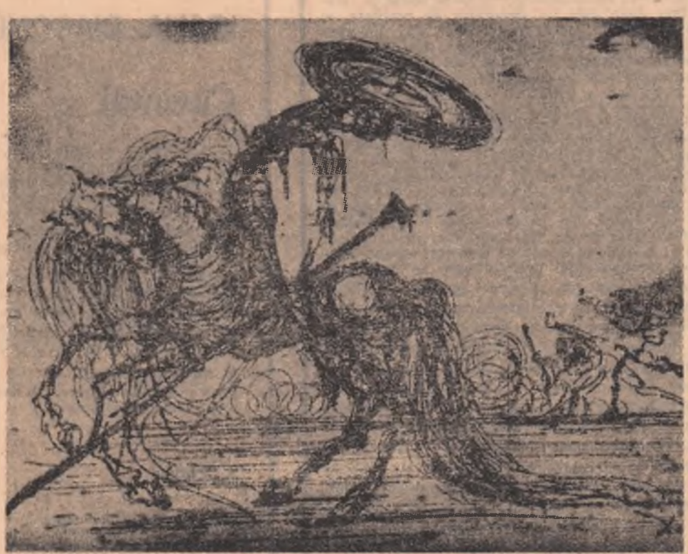
SALVADOR DALÍ Don Quijote

Mult mai frămîntată este poezia lui Nichita Stănescu. Apare aici „drama formalizării”, nu pentru faptul că poezul n-are reușit să-și structureze propriile