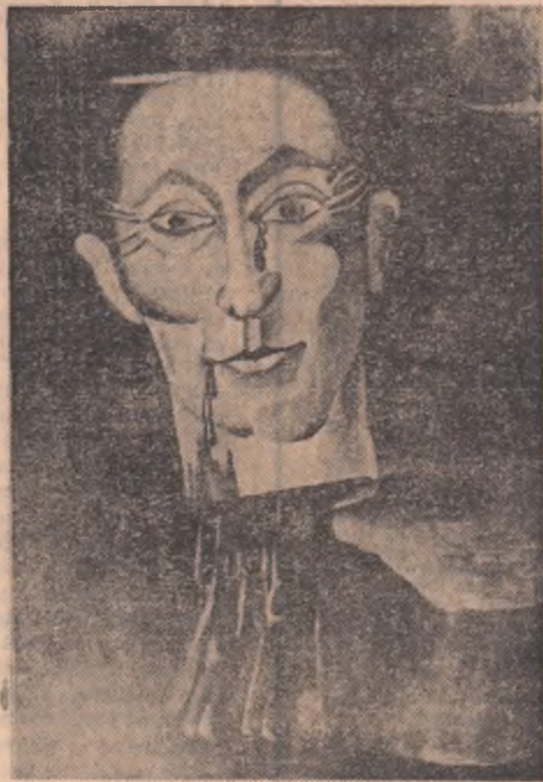
FUNDOIANU în viziunea lui BRAUNNER