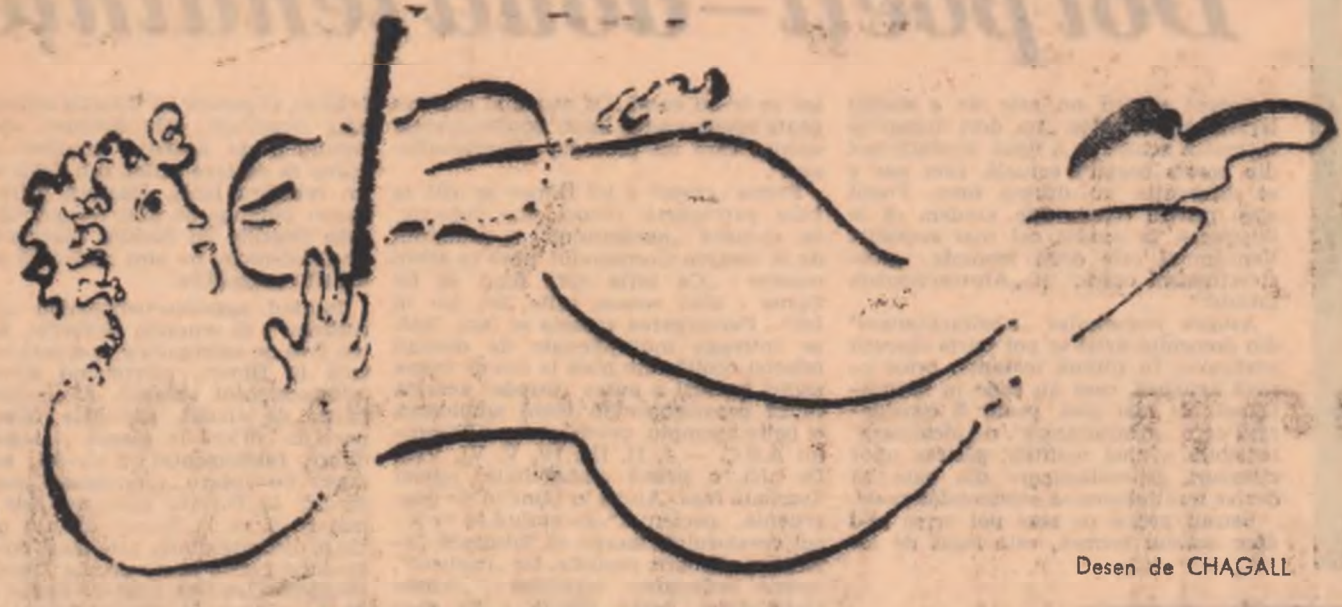
Desen de CHAGALL

voi de revelația simplei decurjeri a obiectelor din numele lor, și nu ironiei care se distrează pe seama decalajului rămas.