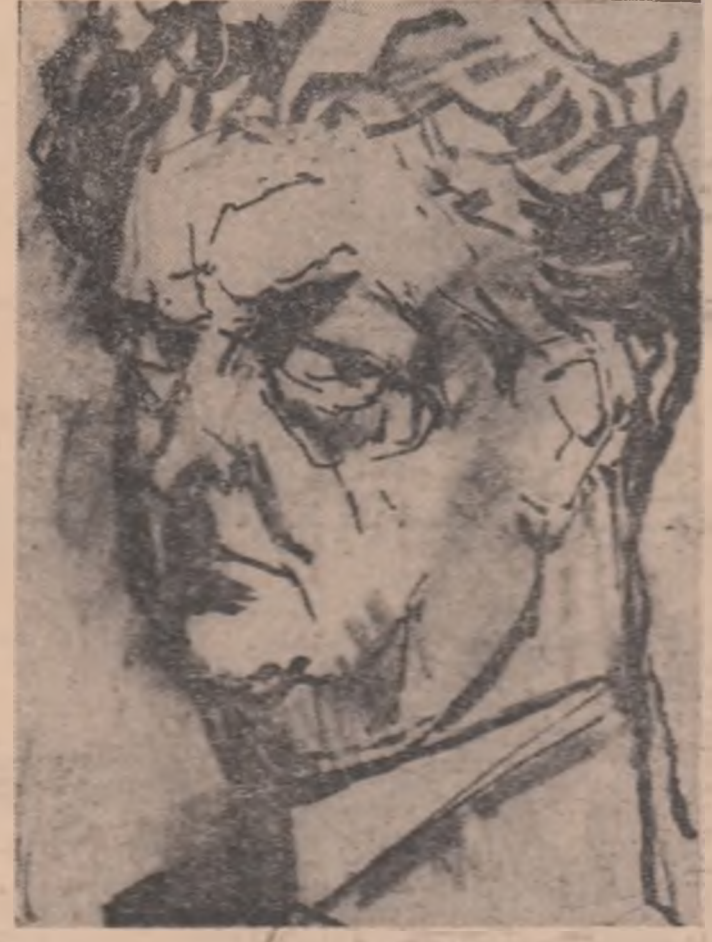
Desen de EUGEN DRĂGULESCU

miracolul descoperirii chiar al existenței, a misterelor vieții, a primelor inițieri dureroase.