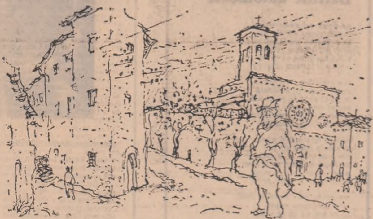
Desen de EUGEN DRĂGULESCU

Cînd stă pe loc, coama atîrnă inegal: mai mult în stînga și mai pușin în dreapta. Fugînd împreună cu posesorul ei de carton, hîrtiile se întind depăr-tîndu-și capetele unul de altul. Nu se întind însă niciodată prea tare fiindcă nici calul nu fuge prea tare. Cîteodată se sfîșie între ele sau cedează cu un pocnet în locurile mai slabe, fluturînd pușin prin aer și coborînd apoi în zbor răpat.