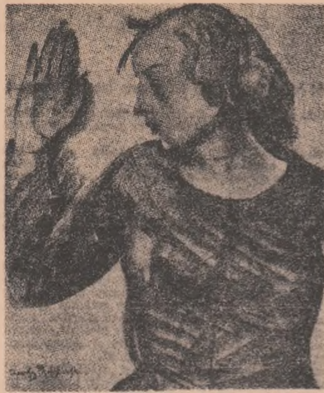
Desen de T. PRUSZOWSKI

Un val-virtel, o stare de confuzie atroce pe care as fi înjurat-o dacă o întîlneau orînde, în paginile vrebunei cărți. De la Florina neubiută, la Loti iubită, — de la ele la Natașa-Maimuțica , o rusoaică amuzantă și pietistică, toare deopotrivă. Pe urmă iar: mi s-a părut că Florina e ideală pentru mine, apoi din nou retracții. Loti mi-este