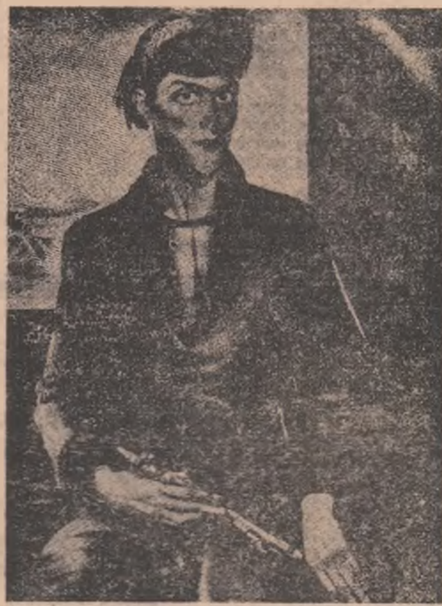
Desen de A. MICHALAK