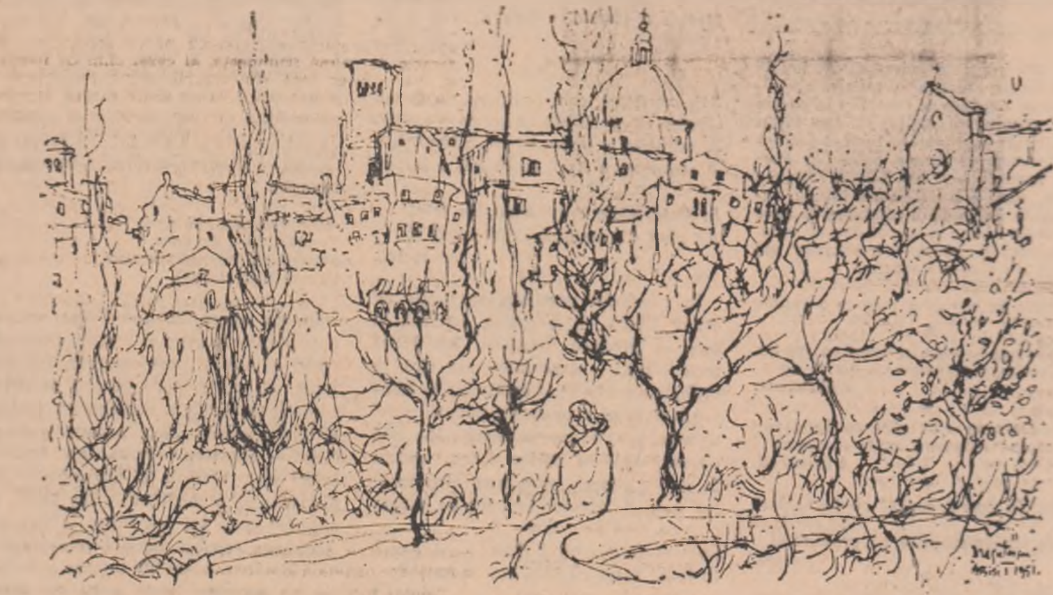
Desen de EUGEN DRĂGULESCU

Întoarce-te în casa muntilor pe trepte de minereuri, întoarce-te în azima aerului să nu-și mănînce umbrele inima. Spală-te în miazăzi unde dihorul pămîntului n-a trecut și unge-te de sus pînă jos cu ceara visului neozuit. Ocolește pădurea de nouă ori, odată cu ochii închiși, odată cu îndoaia pînă în ultima zi cînd miezul nopții se desprinde din trupul tău, lăsîndu-te pe la cîntatul cocoșilor în țara nimănuși jumătate de om călare pe jumătate de cai șchiop.