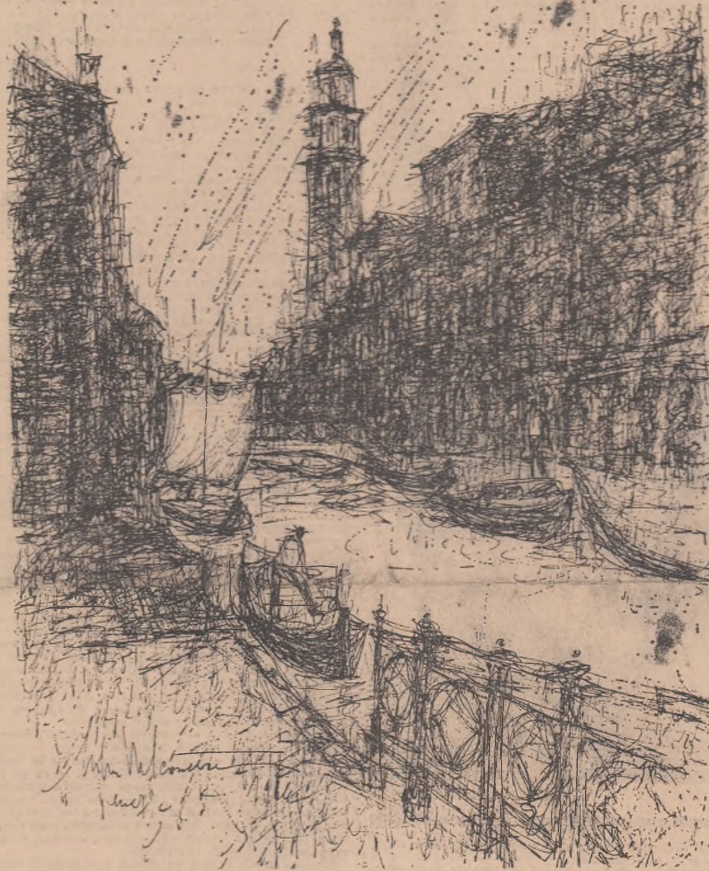
Desen de MIHU VULCANESCU