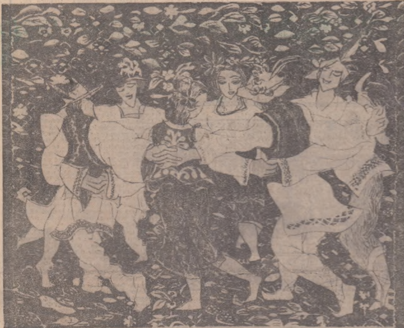
EUGEN DRAGUȚESCU — „DANS POPULAR”