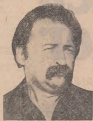
Poezie LEONID DIMOV „7 poeme” ; „Pe malul Styxului”