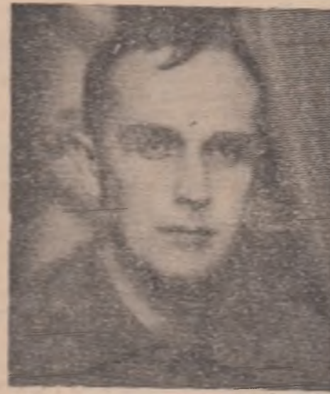
Critică literară și eseu ION NEGOITESCU „Poezia lui Eminescu” și ediția la „Texte critice” de E. Lovinescu