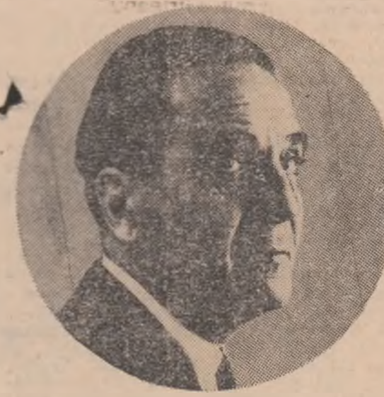
Traduceri VLADIMIR STREINU „În căutarea timpului pierdut” de Proust