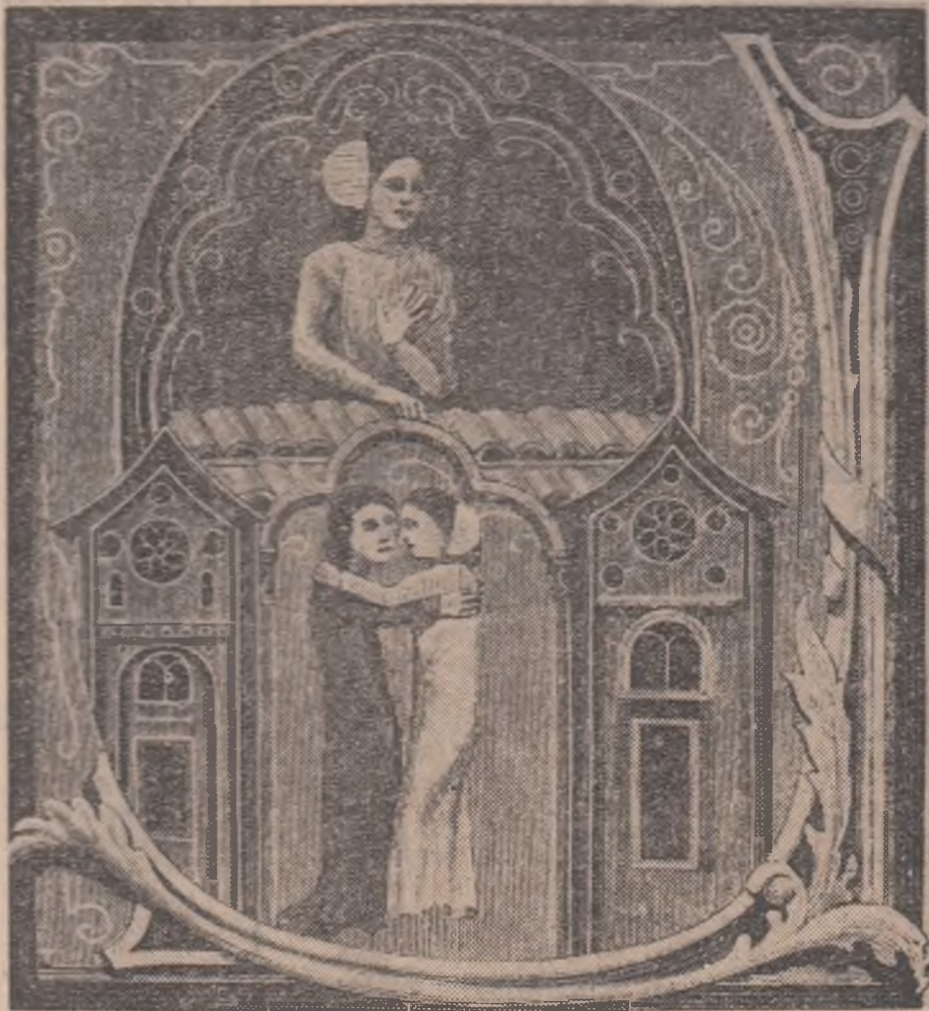
Gravură din secolul XIII