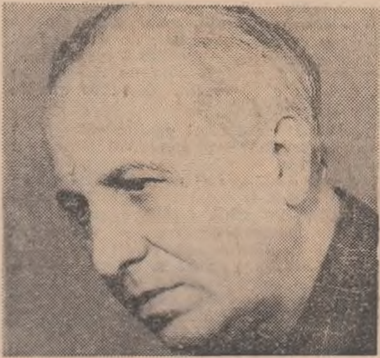
Poezie VIRGIL GHEORGHIU: „Curent continuu”