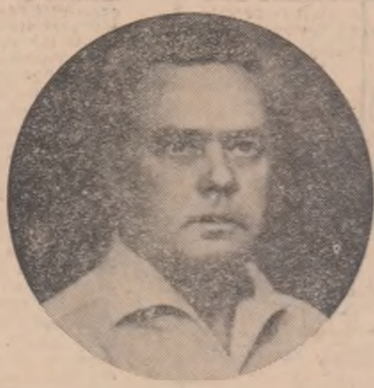
VIRGIL TEODORESCU „Poeme” de Paul Eluard