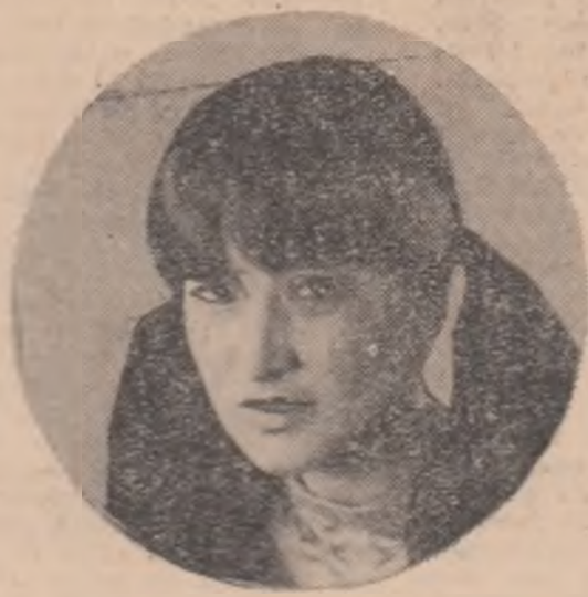
Poezie GABRIELA MELINESCU „Interiorul legii”