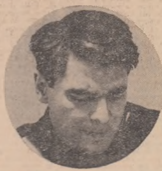
Proză CONSTANTIN TOIU „Duminica mușilor”