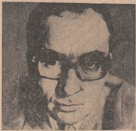
Proză MARIN PEDA: „Intrusul”