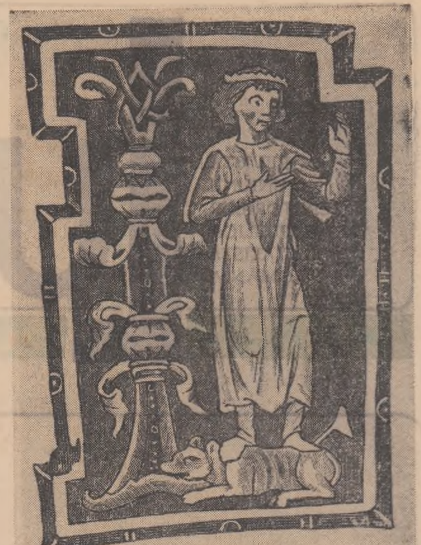
Gravură de la sfîrșitul secolului XIII