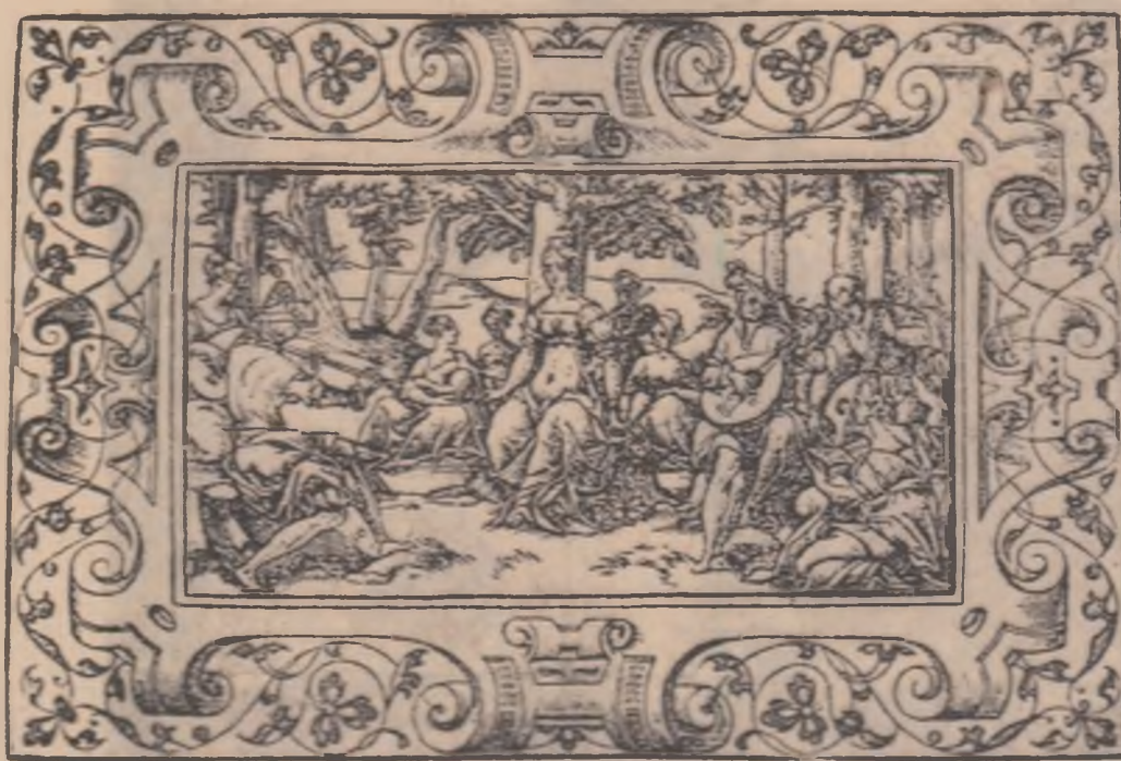
Gravură din secolul XVI

suferă de un ciudat „spleen”, fără a găsi soluții salvatoare. Insignifianta, nimicul sint copieștoare.