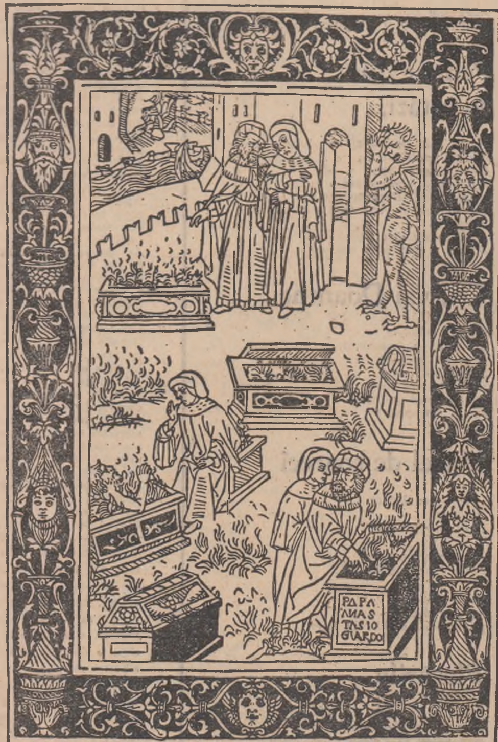
Gravură din secolul XV

Pe scară încrustați vecinii pe care i-am surprins cerîndu-se și nerecunoscîndu-și viața, în calea lor nu știu cum e pustiu. Stăm toți ca-n burta animalelor viscerale și suferim, tu, iartă-ne, Maria, aștept să vină cineva cu pașii grei ca minereul să ajîntesc asupra lui cărți, litere, plumb și reviste.