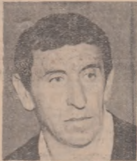
CORNELIU REGMAN „Cărți, autori, tendințe”