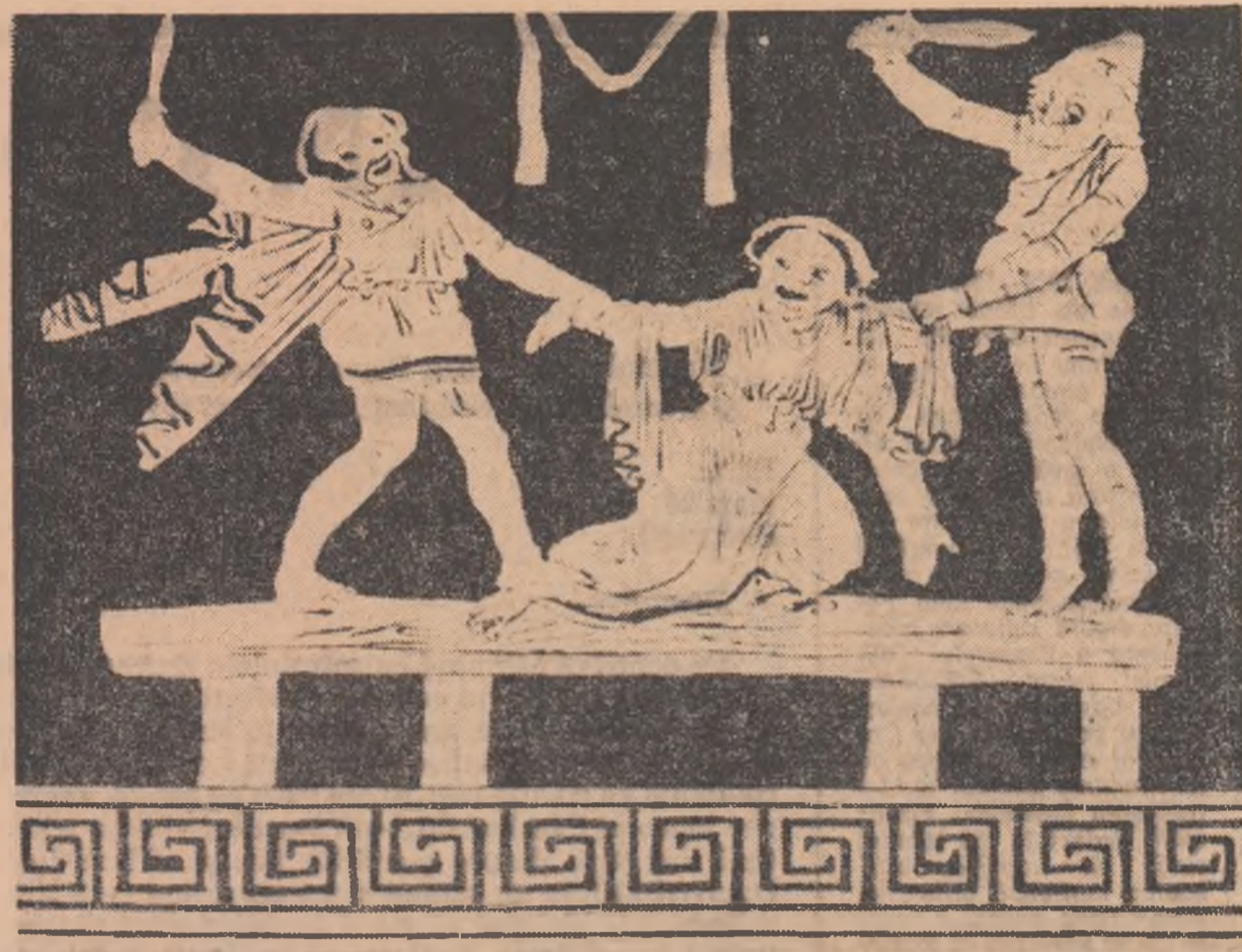
Pictură pe vas — „Norii” de Aristofan

12 AUGUST. Acum la ora 8 dimineața ne găsim tot pe șlepurii. N-am pornit încă spre Oltenița.