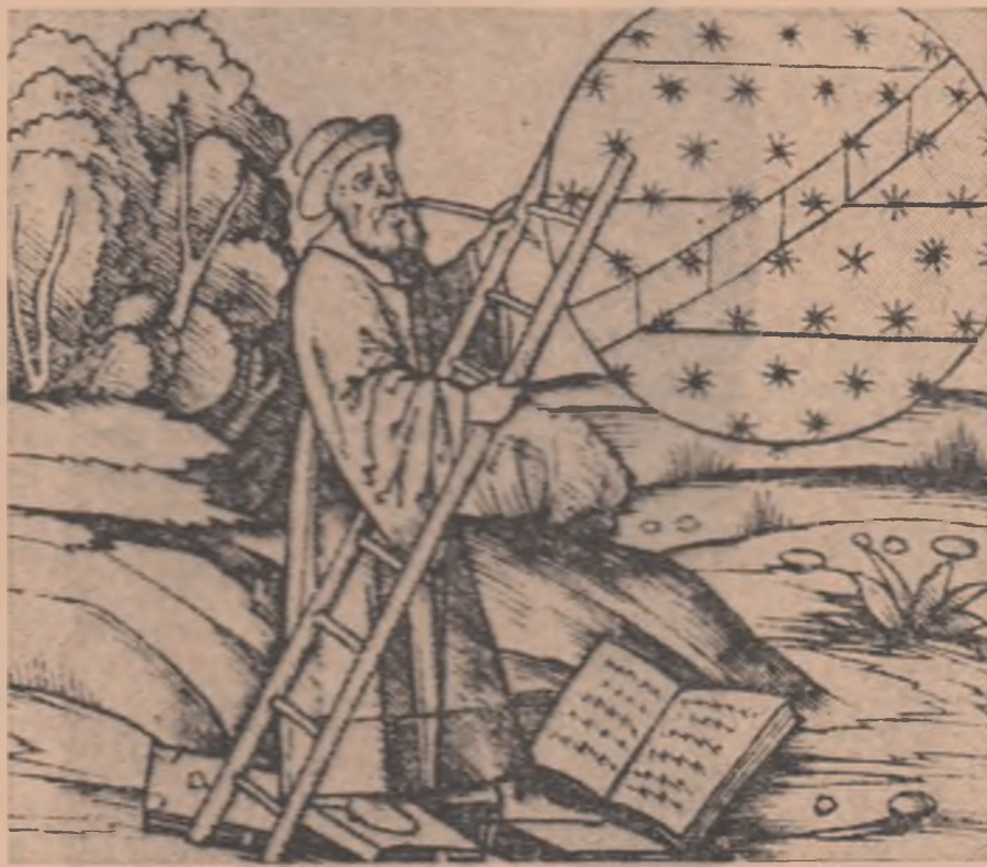
„Astronomia” (Venetia, 1529)