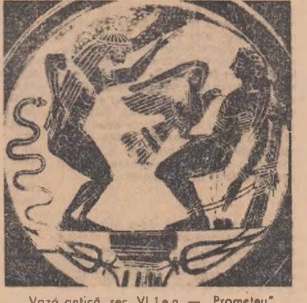
Vază antică, sec. VI î.e.n. — „Prometeu”

29 IULIE. Compania mea a plecat azi dimineață de la 6.