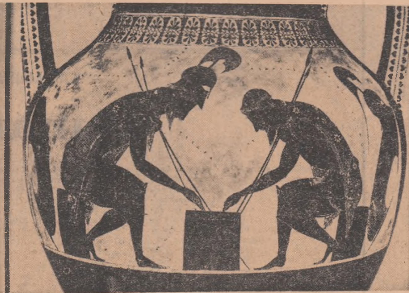
Achile și Ajax jucînd zaruri (amforă etruscă)