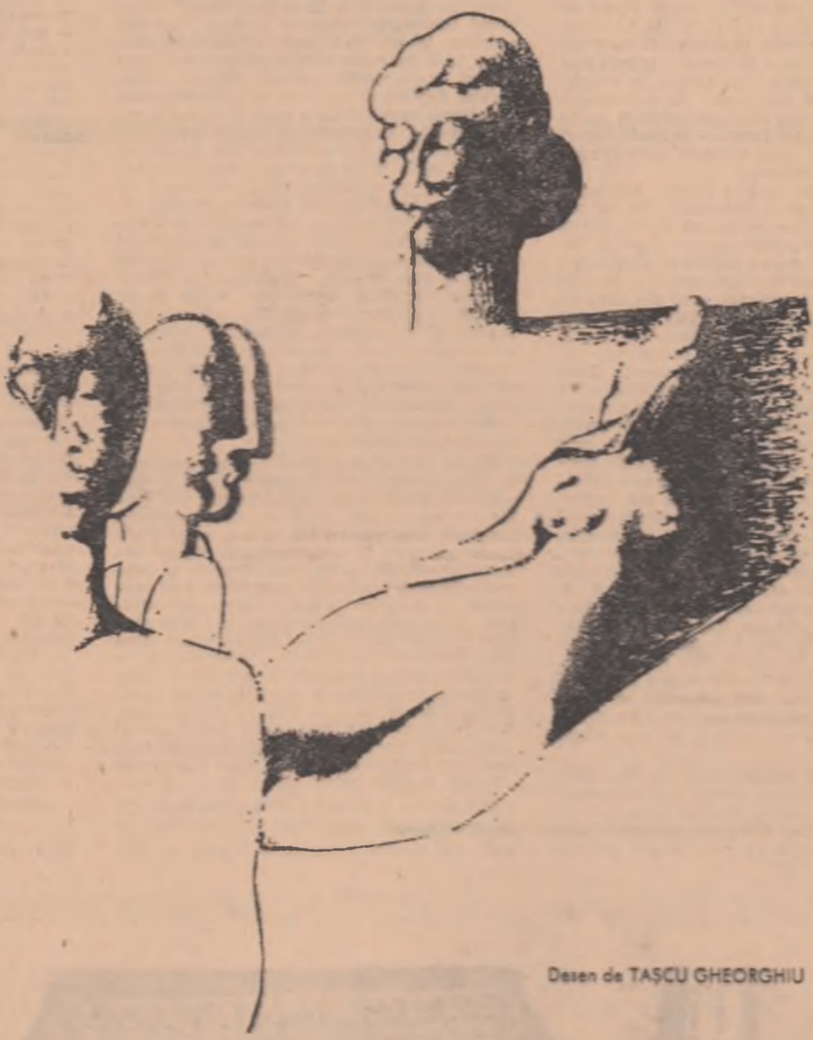
Desen de TAŞCU GHEORGHUI