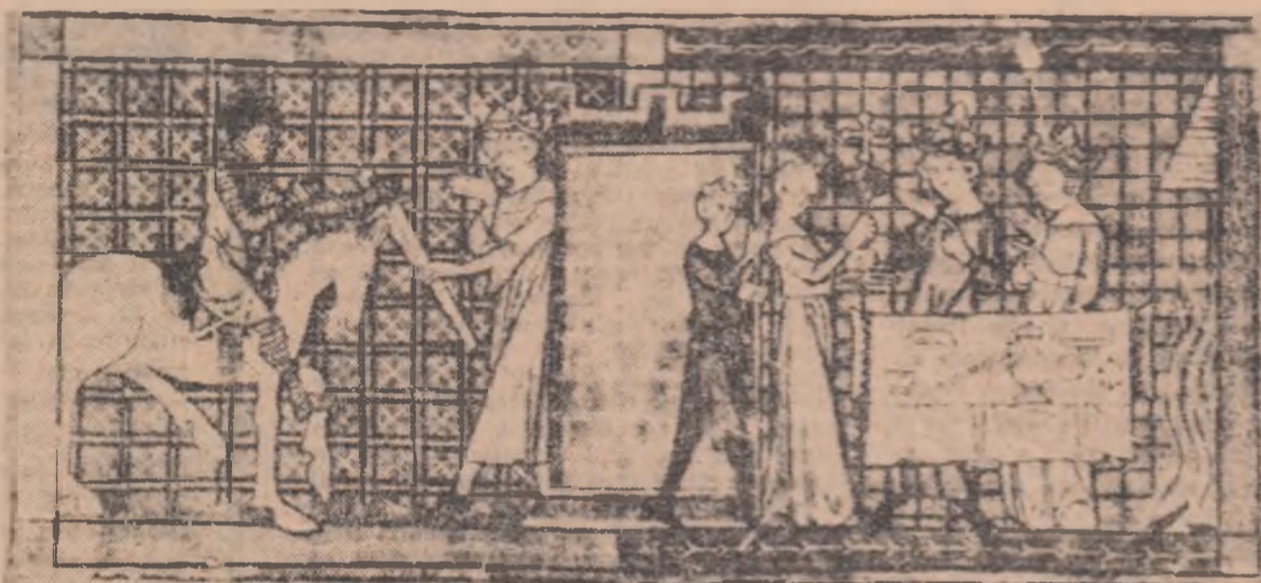
Ilustrație la Legenda Sf. Gheorgii

Se zice că stăm aici o zi pentru odîlnirea trupeii — după care vor urma trei zile de marș și cinci de carantină lângă București. (Mi se pare că comandantul de regiment nu are altă libertate de acțiune, cît ar trebui. Sterza dacă ar fi avut-o, ar fi condus regimentul cum trebuie. În timp de poce trebuie să primeze necesitățile de salu-