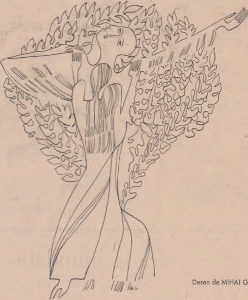
Desen de MIHAI GHEORGHE

E interesant de observat că însăși funcția spirituală pe care le-o descoperează Blaga unor asemenea credințe populare implică ideea „jertfei” din drama expresionistă a „vestirii”. Ele s-ar sacrifica pentru a ajuta împăcarea, pronunțate atracții spre „organicitate” a matricei stilistice autohtone cu ecumenismul creștin, circulînd fără nume, fără paternitate și fără a se dezvolta într-o doctrină, asumîndu-și forma aceasta de existență subterană, eresurile au îngăduit păstrarea intactă a credinței ortodoxe și au îngăduit biruirea ispitei schismatice „printr-un proces de sublimare pe planul imaginației legendare și poetice”, lucrînd ca niște adevărate „ventiluri” sufletesti. Sincretismul social, politic, etic și religios din drama „vestirii” se realizează, la Blaga, cu prețul „jertfei” lor și „Tulburarea apelor” ne-o arată foarte elocvent sub o formă simbolică.