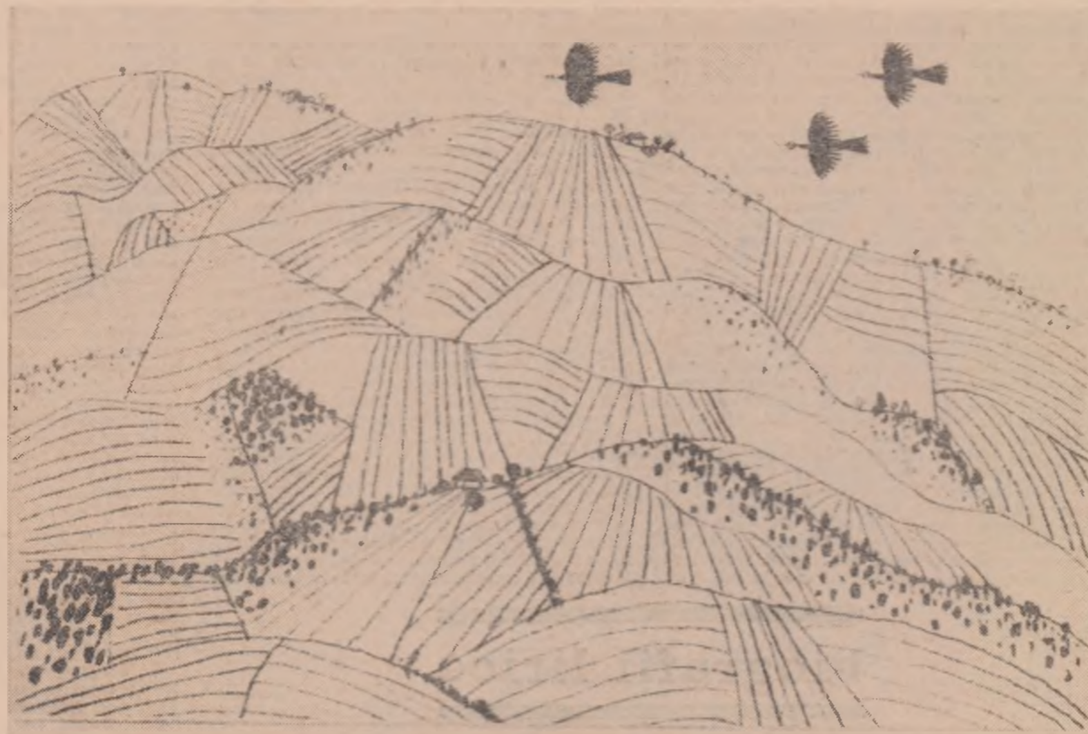
Desene de VIOREL MĂRGINEAN

Și pe sub cotul tatei văzui roșu, cîmpul cu maci, înainte. Intrară în el și soră-mea cînta vechiul cîntec. Se duse prin fața tatei, opri cîntînd din goană și se dădu jos, tristă, tare tristă, ca niciodată. Trecu cu mina ei catifelată pe botul cailor și se uită lung în urmă, cu ochii tulburați, în urmă, de unde plecasem și eu nu știam cînd. Apoi rupse doi maci roșii și-i puse în fruntea cailor, în cătaramele lor de alamă. Mai rupse unul, îl trase adînc în mări, și-l lăsă jos, pe drumul țîțat de roșile cociei între maci. Tata părăsea că se miră și dădu drumul încet cailor, gînditor; le dădu drumul fără hotărîre la hături, cum nu mai făcuse, lui, care-i plăceau să-i mine în galop. Se întoarse apoi cu fața în fundul cociei și ne privi pe rînd, tot gînditor și încruntat. Apoi fluieră scurt și trase. Și atunci începuse iar să o tăiem iute prin cîmpurile pîrjolite și părăsite. Soră-mea începu cîntecul ei vechi și începu bucuros să-mi desprînd buzele în acest cîntec și eu; și pînă-n urmă cîntam mai tare ca soră-mea și o acoperam. Dar rideam și mă bucuram cîntînd, goneam înainte, zdruncinat în fundul cociei, goneam înainte, mai sigur ca toți.