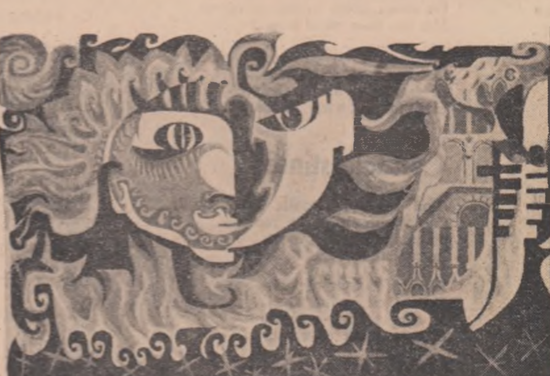
Linogravuri de MARIANA POPA

Surorile gemene au să mai semene? Surorile vitrege au să mai intrige? Căstele familii 'n ale lor cochilii