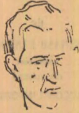
Vitali Ozerov (U.R.S.S.)

Floarea de lotus înfloarește la razele soarelui, Talenta înfloarește la razele cunoașterii Dragostea înfloarește la razele zimbetului Ce poate fi mai minunat pe lume decât asta ?