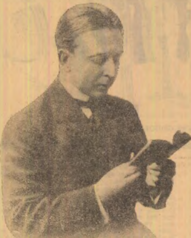
OCTAVIAN GOGA IN ANUL 1919