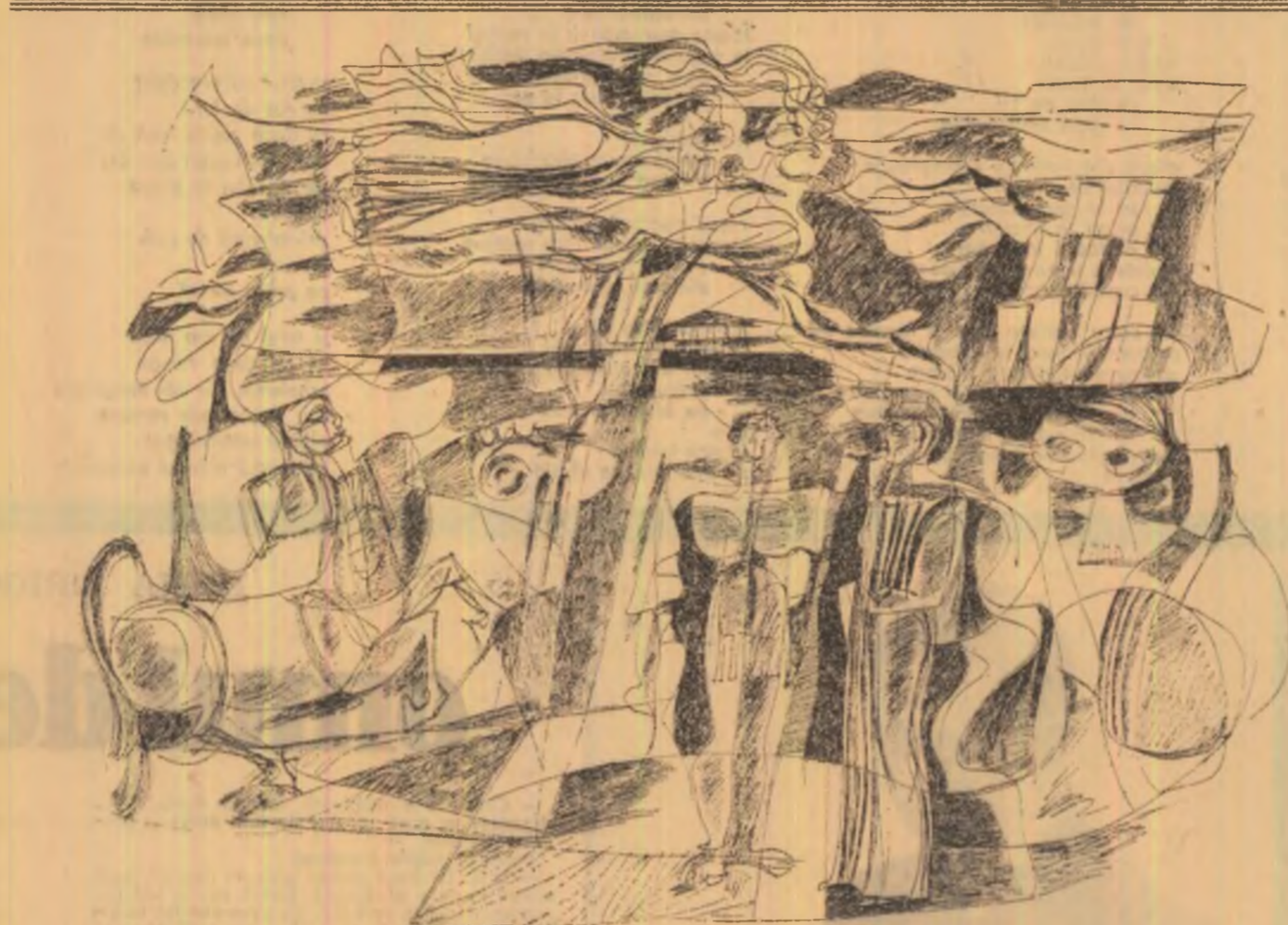
Desen de DIMITRIE GRIGORAS