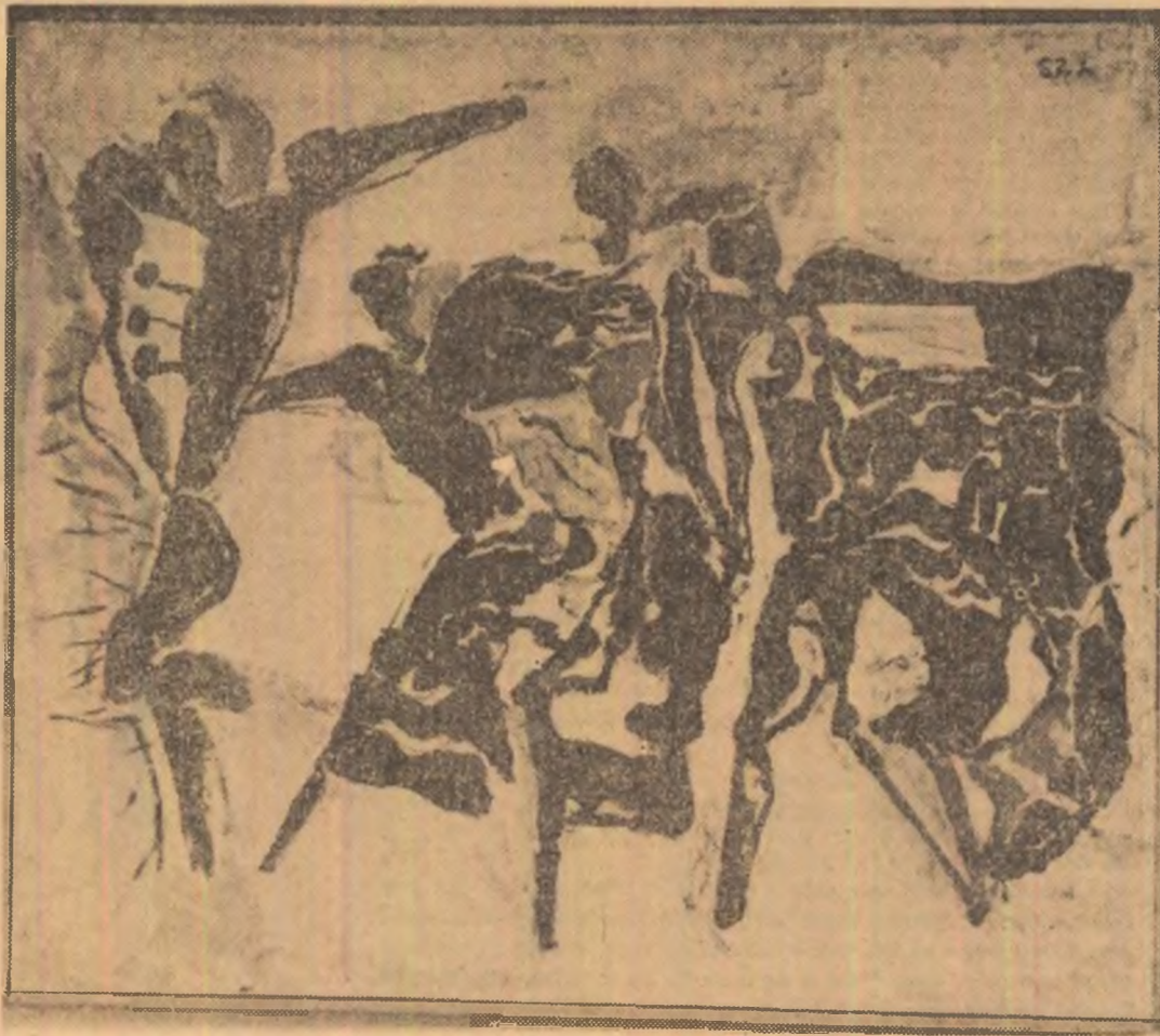
LIA SZASZ: ELAN