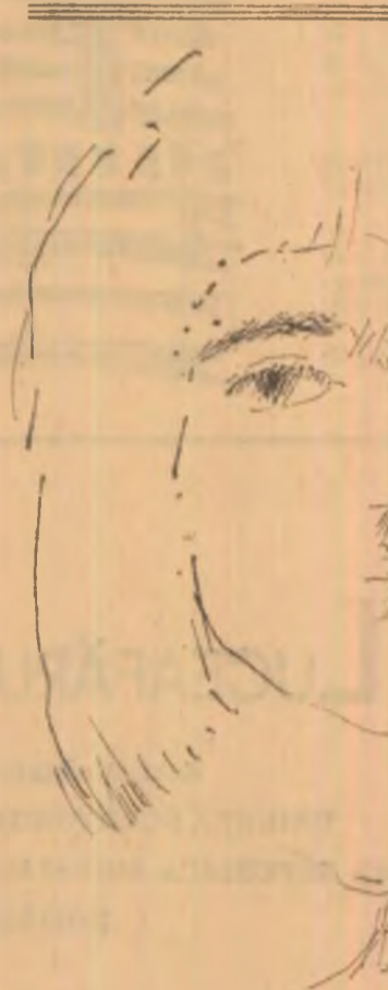
Desen de VIGH ISTVAN