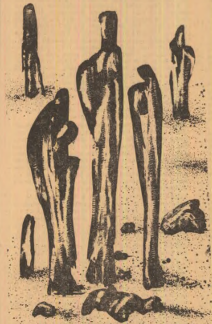
Desen de THEODOR SALAR

— Mi-era teamă, îngăvi femeia, iertați-mă, mi-era foarte teamă, — și stînjinită își reluă locul la volan.