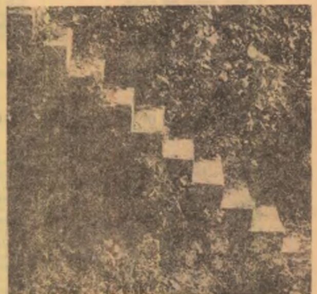
CIUCEA — TREPTE SPRE CASTEL