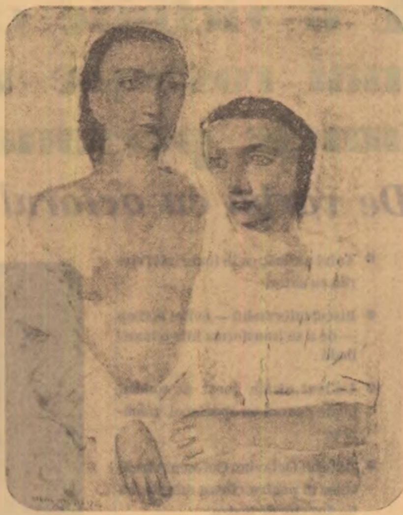
MASSIMO CAMPIGLI: Figuri din Argeș.