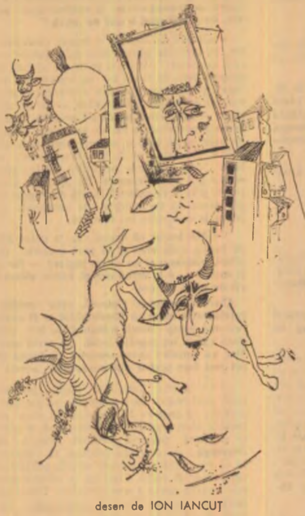
desen de ION IANCU