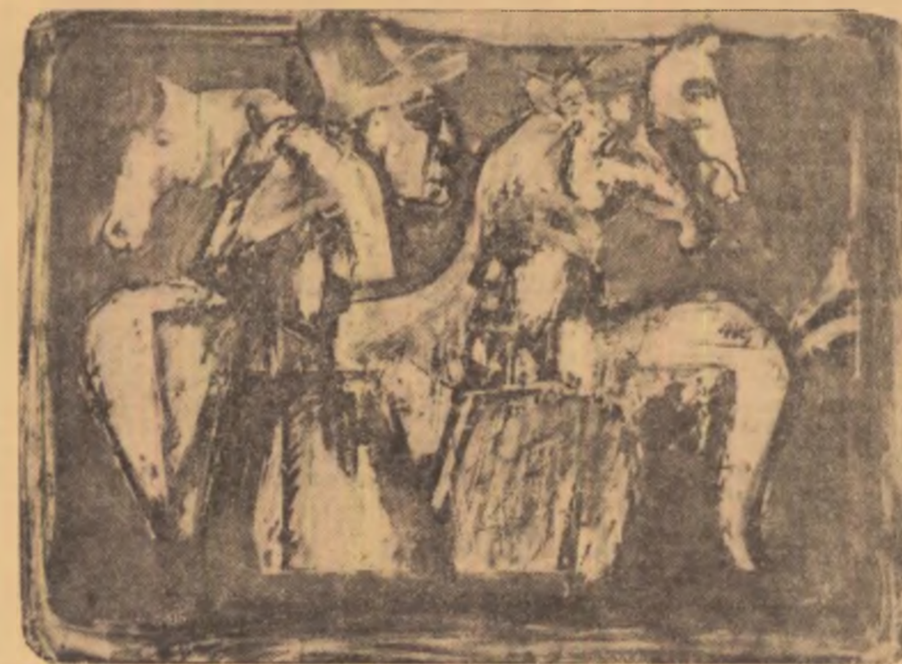
Picturi de AUREL NEDEL

* Trăiam după toate astea — și sentimentul unei violente nedreptăți. Căci — în orice stare am fi, ori cît de jalnică, sîntem cople-