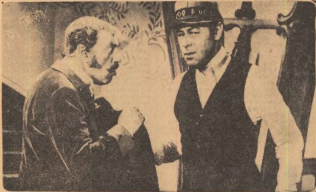
REX HARRISON (dreptu) în filmul „Bănuția”