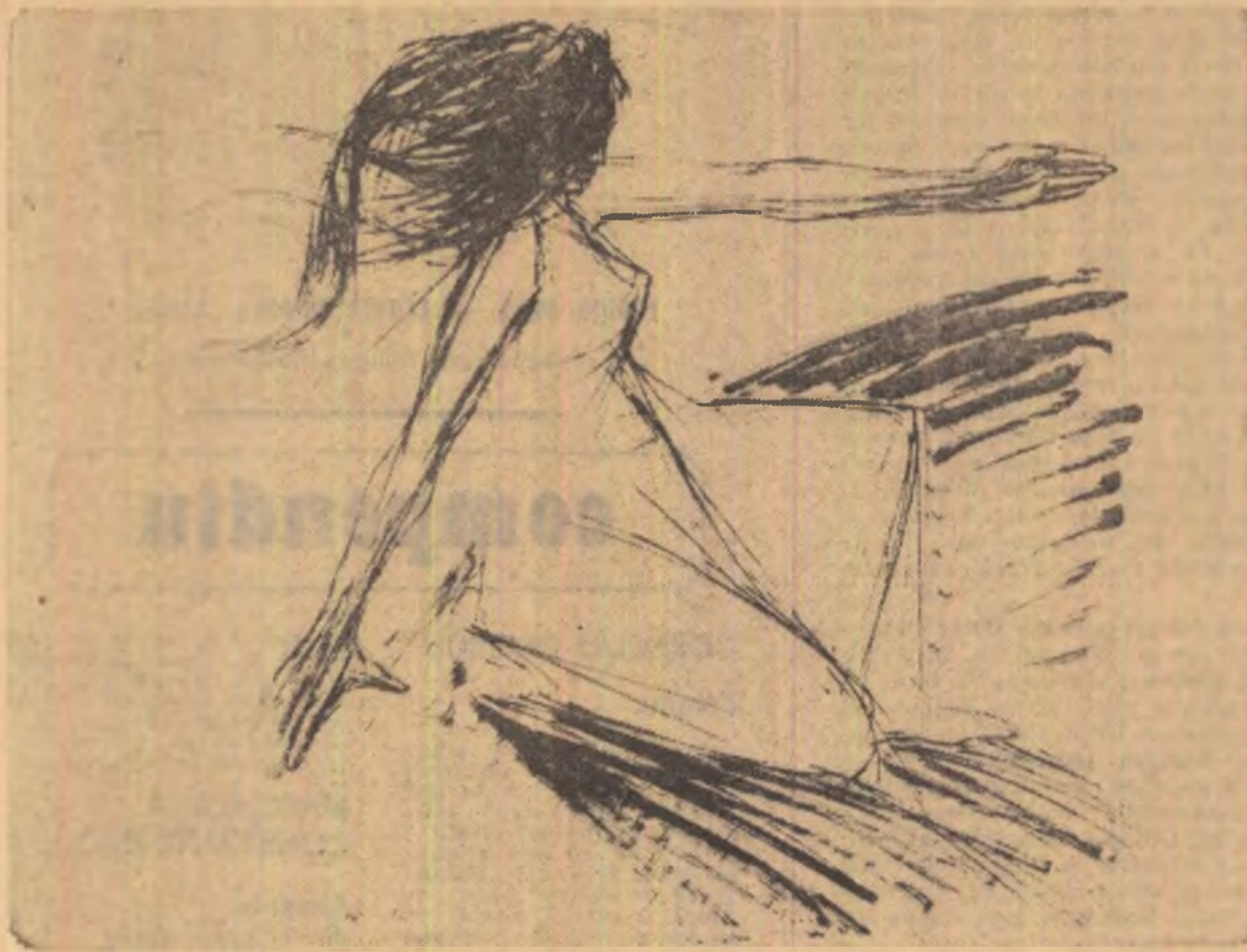
Desen de FLORICA CORDESCU