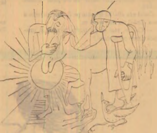
FLORIN PICA — LEONID DIMOI: „Eieusis”

O carte-spectacol. Editura „Mihai Eminescu”.