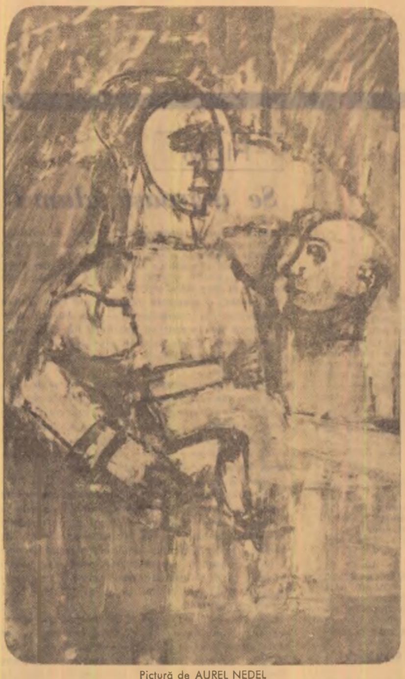
Pictură de AUREL NEDEL