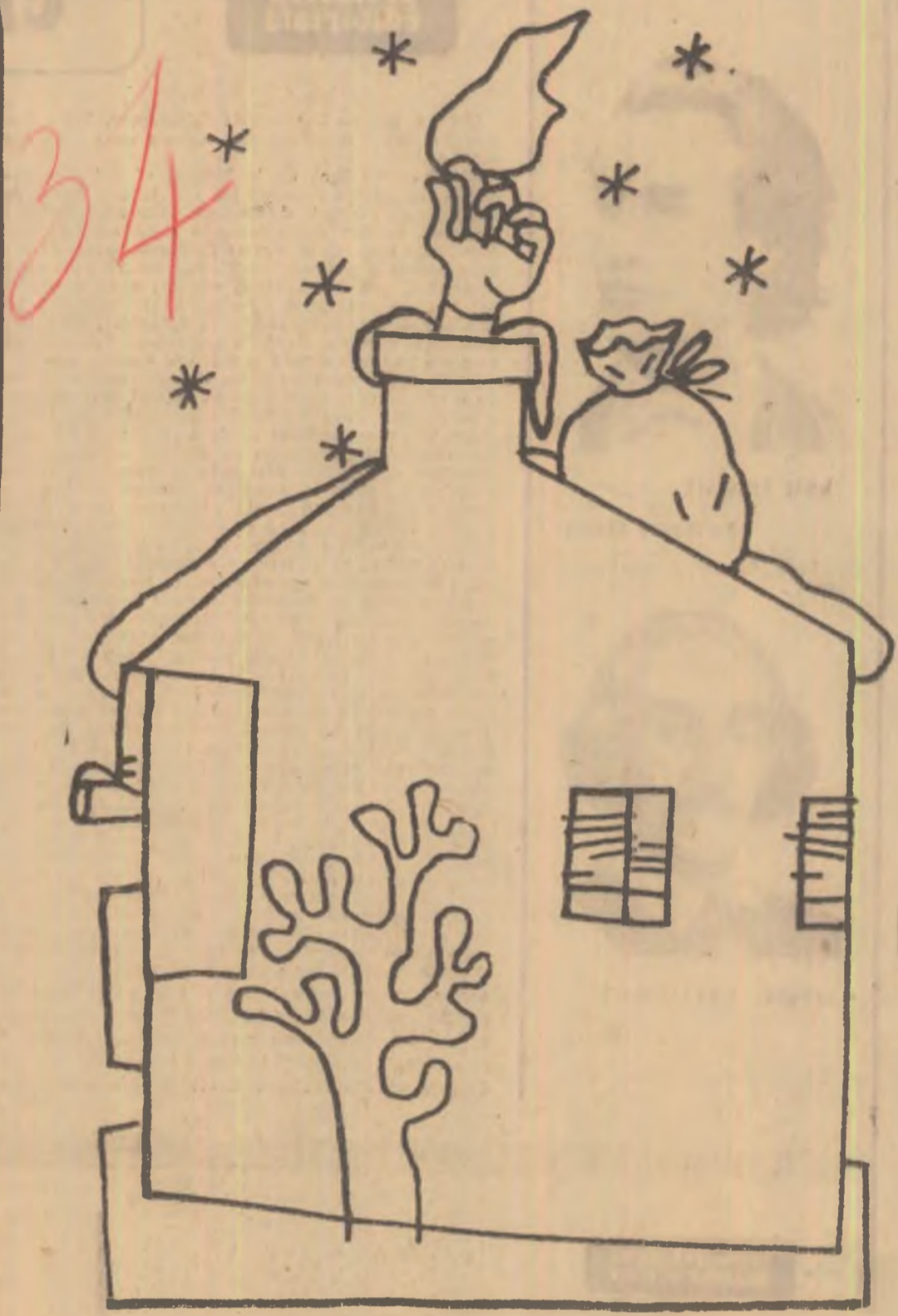
Desen de MIHU VULCANESCU