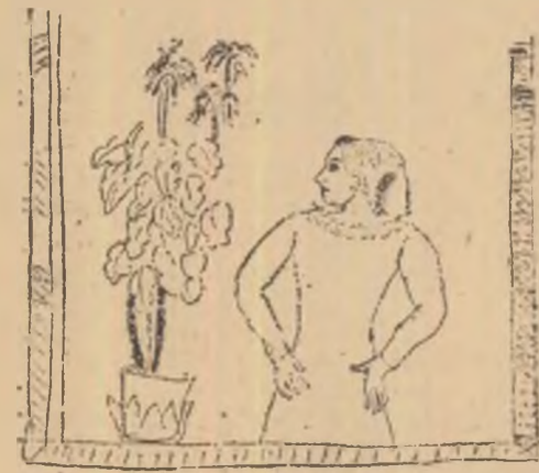
Desen de CHAGALL

La ora șase fără un sfert, pasul militar al nevestelor, pasul, mai dezinvolt al domnilor tineri, în costume vîrgate, cu garioafe de butoniere, cu brațele încărcate de pachete, trezeau spitalul. Era ca într-un „pub“: mini-