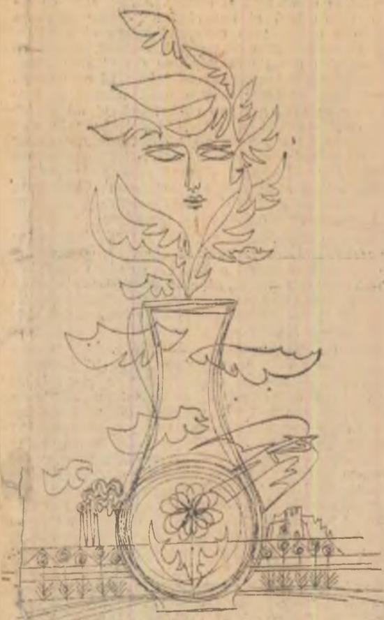
Desen de MIHU VULCANESCU