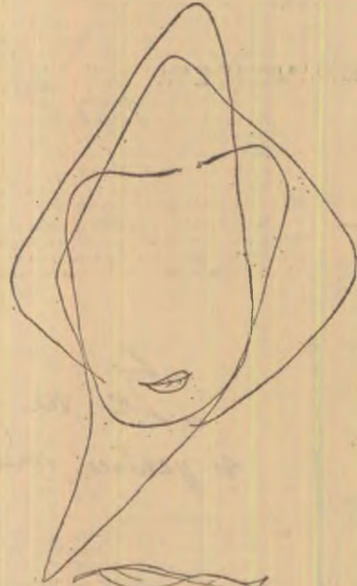
Desen de VERA HARITON

Degeaba ungeți clopotele cu miere de albină pruncii bătrîni vor refuza să vină pămîni, nînsori albastre s-or reîntraoare-n coajă foșnînd în solzi hiene vor cobori pe plajă, roua va fi o mare căzută în pustiu și lebăda o rimă cu briu trandafiriu sîmîniță prin sîmîniță arzînd pină-n pămîni cătronul îl vor trece înot duioșii sfinți prin trupurile noastre un măr rostogolit va izgoni instinctul cel dulce și oprit nici Dumnezeu în noapte nu va fi felinar buimacă ca niște fluturi vom da din aripi rar ne vom țiri în peșteri din peștera în ou femeile frumoase se vor țiri din nou din nou vor crede pruncii că nu-i nici un ciștig și-atunci căzut în ierburii va trebui să strig dar chiar din coif prin zale prin scut și prin armură cuvintele ca viermi mi-or înflori pe gură.