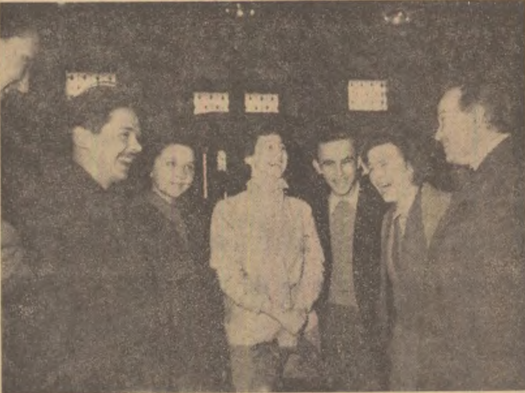
ASPECT DIN TIMPUL PRIMEI CONFERINTE NAȚIONALE A SCRITORILOR TINERI

Iar cînd se umflă apa și nemilos strivite Dantelele din unde în liniște se sparg Cu nepăsare, parcă, privesc cum zarea-ngहितă Nostalgicele plute ce trec fără calang.