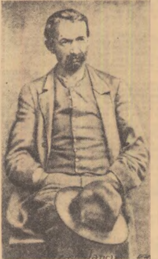
AVRAM IANCU IN 1870

„Pe scurt vom iarăși a vă spune și exclamăm: de aveți în cer un Dumnezeu pe pe pământ o patrie, luați alte mijloace de-a trata cu noi, convingeți-vă deplin că între voi și noi armele nu pot niciodată