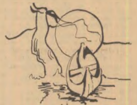
Desen de C. E. DRĂGAN

Mă-mprăștiu tot în aer să te simt a mea Sint numai ochi plînd în vulturi Și-ți cut umbra-n umbră dar abia În pretutîndeni o aud și-n vînturi