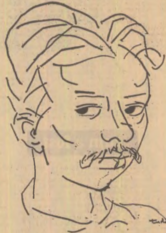
Portret de TUDOR JEBLEANU

critică. Viața lui nu poate fi judecată însă de pe teritoriul indiferenței. Liber în mîndria lui neagră și etern nostalgic după peisajul pădurilor natale, cu cojocul de oaie, umblînd prin oraș și-luietă singură; dar și cu formidabila lui valiză de piele, cu fermoar, raft călător al volumelor de poezie franceză... dar și cu eleganța primului — și singurii lui — costum cu vestă, dar și cu stilul său citadin luînd un filtru la Capșa, cu tabieturi de vechi bucureșten. Greu de fixat într-o formulă unică. Există un tablou al lui, mereu reproduis în volume. O cută demonică îi brăzdează fruntea, mustața se boltește peste colțurile unei guri amare. Dintr-o naivă credință că Labiș nu era așa, evit totdeauna înfățișarea sa. De la el ne-au rămas puține fotografii, abia cu cineva în plus decît de la Eminescu. Intimplarea făcea să am una, de grup, pe care Labiș o cerea într-un bileț grăbit: „am nevoie de jumătate de poză pentru un carnet” (de student, probabil). Era făcută în 1952, la 17 ani.