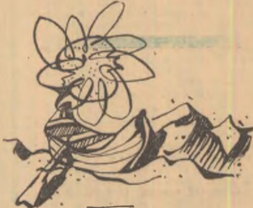
Desen de C. E. DRAGAN

Acum noi încă mai rămînem aici s-o mesteacă în tăcere dumnezeiasca apariție