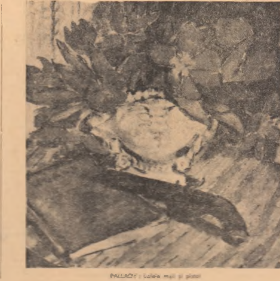
PALLADY: Fatale mai și pînă

Dar, mai încă, vei auzi se fel de bron, parcă furtivi anafel încercămoli în bur, la pîndă, și-or stîrîna alba vîntărie într-o suavă rîndă de scum. Apoi, auzul tău, vești în drum cu-ncheșuri de vînt scînd în cogit, va fi sorbit și alinat de mugul.