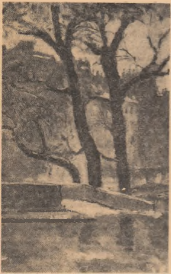
PALLADY: Peisaj de iarnă: Seno