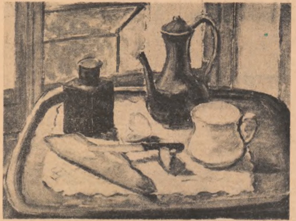
PALLADY: Pinea zilnică

reia Tăcerea, ardarea tăcută, aeriana tăcere lionardescă, solia solară, lunară, nici eu nu mai știu... ...Noi continuăm cina s-o cinăm și continuăm să vorțim. Faamea bîntuie, eram călcați în picioare de Foamete și Frig, cavalerii apocalipsului. Și în fiecare din noi se trezea primarul din Cork, generații de primari din Cork se trezeau, primarii hămînzii din Cork după 90 zile de grevă a foamei. Și cînd un apel se făcu apel repetat, alarmat, pe domnișorul păstor ia-i de unde nu-i! „S-a volatizat”, a răcnit cineva și răcnitul dreptate avea. Ușile, toate, lerecate, le-estrelle toate închise erau ca pleoape de fier. —Și mai era, căzută din cer peste locul cinei, o placă de marmură grea ca un păcat capital, marmură ca în cimitire. Și lere de loc într-o neștiră înscrise pe ea: INCHIS IN TIMP DE IARNĂ.