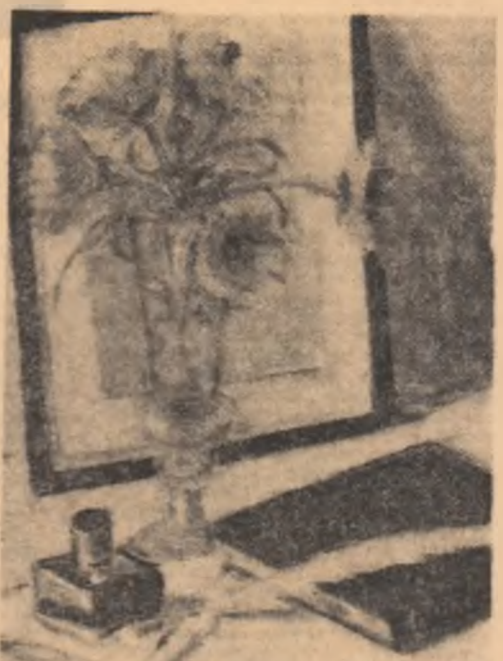
PALLADY: Vos cu gîlbenele

și de ajutoarele lui: în căruțe erau lăzi, probabil, cu cercuri de fer, în cari se puneau cite 30—35 de pușgi. Îndată ce o ladă se umplea, Visterierul o încheia și o peoțuia cu peoțea lui. Muzicele cîntau în tot timpul cărătului banilor, iar bucureștenilor li se scurgeau ochii după gramada de bogății cari se duceau în Turcia”. (Ionescu-Gion). Tot Del Chiaro pe care l-am citat, ne da o descriere a palatului Brîncoveanului: „Este tot de piatră, cu o scară mearșă, mare, de marmură, Sala cea mare e făcută pe bolte și susținută pe un ordin de coloane care sînt scunde. Mai e o altă sală mare pentru Divanul cel mare și pentru ospețe la zile de sărbătoare. Sunt apoi