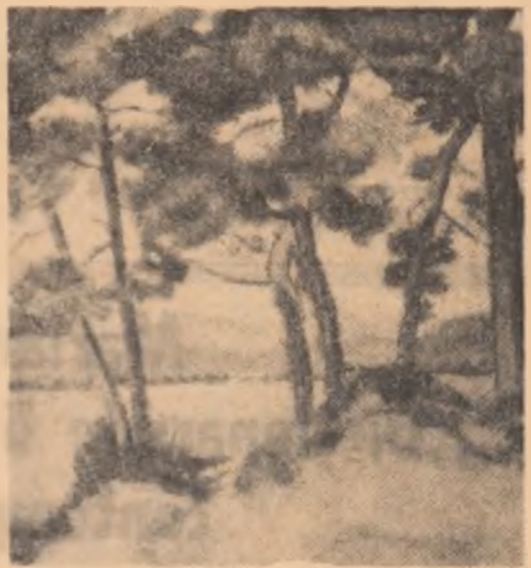
PALLADY: Peisaj din Longo Mai