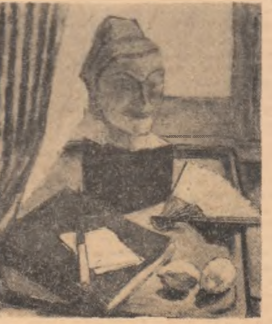
PALLADY: Statuie și evantoi

Peste această formă de timpă s-a așezat o boabă de nisip zic Nu e nisip zice, este ochiul ei pus dinadins într-o partă; De fapt partea aceasta e ția ei de tinără zeitate Care de restul pietrei, prin linie rotundă se desparte, Și linia aceasta rotundă este de fapt linie dreaptă Este cercul soarelui de peste sori Făcut anume așa ca ochiului să nu e, se arate Ci numai țimpa să îl simtă uneori. Și ca să fie întru totul simțită Linia merge ușor pe șira spinării ei Și numai undeva șira spinării e înrîță Ca să nu pară o unei zete ci o unei lemei. O singură vertebra se vede și tu pari să o recunoști după ea Dar unde este restul strigi pînă cînd Din vertebra ei se face un lanț Pe care îl ții în mîni tremurînd.