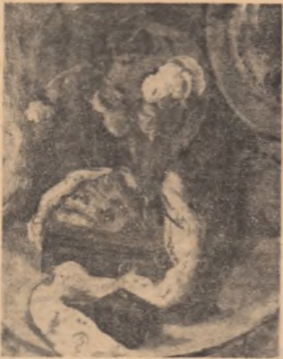
PALLADY: Flori și evantai

Pentru marmoră poșii mei aiergînd cu durere destinul are voce de templu o, cine mă va iubi cu ecourii timide? corabia navigînd pe izvoare? o, cine să știe ochii mei ce vor fi fără soare?