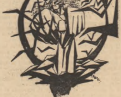
Desene de VLADIMIR CIOBANU

Prin pădure și apoi pe creastă, imediat sub călcarea Bălei, nu mai e o problemă urcușul. Miine ne va aștepta o încercare mai grea.