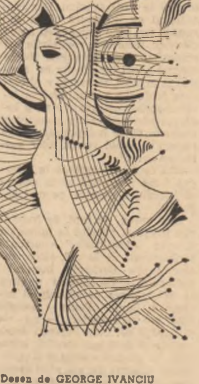
Desen de GEORGE IVĂNESCU

și iar ascuți către ușă și cafeaua fierbe încet și trandafirii sint negri ca scrumul, după miezul nopții adormi.