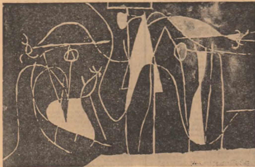
PICASSO : Ceramică

ca el să topească bezna ! ca el să spargă gîla ! ca el să-mi deschidă inima care scrișnește !