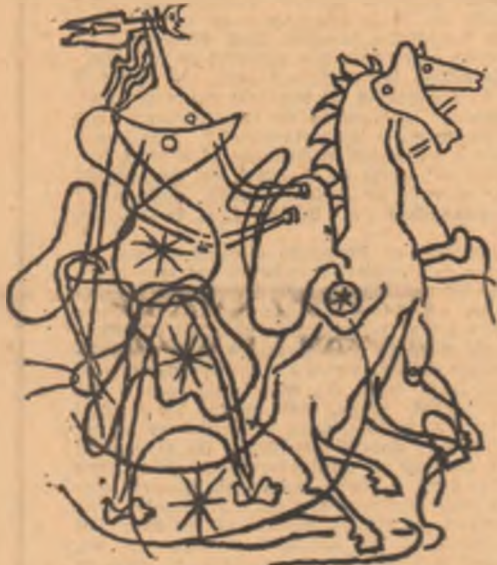
BRAQUE : Hellus

între aproape nimic și nimic se apără și înfloreste alb cireșul.