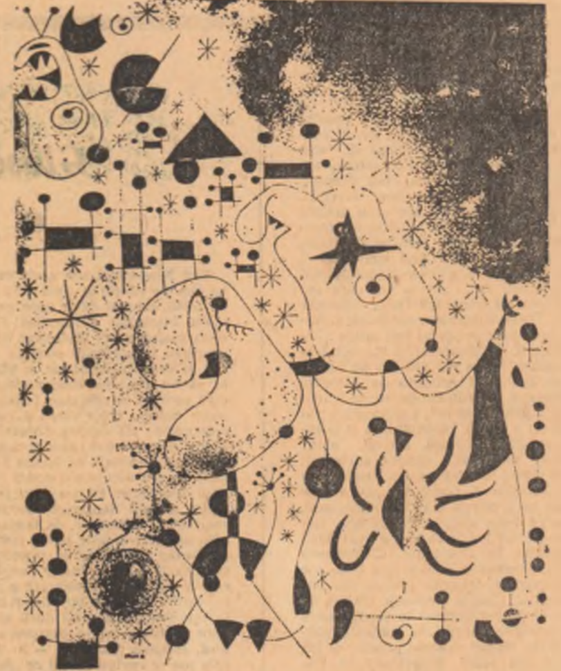
JOAN MIRO : Pasărea migratoare

lăudați să fie tîlharii : voi, ațișindu-i către siluire, trintiți-vă pe patul trîndav al supunerii, scîncînd încă mîntiți. sfișiați vreți voi să fiți. voi nu schimbați lumea.