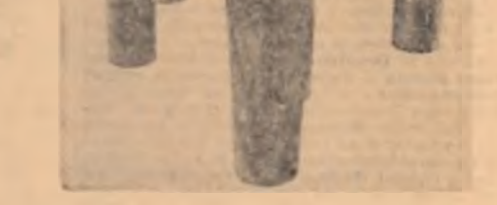
In românește de Virgil Teodorescu