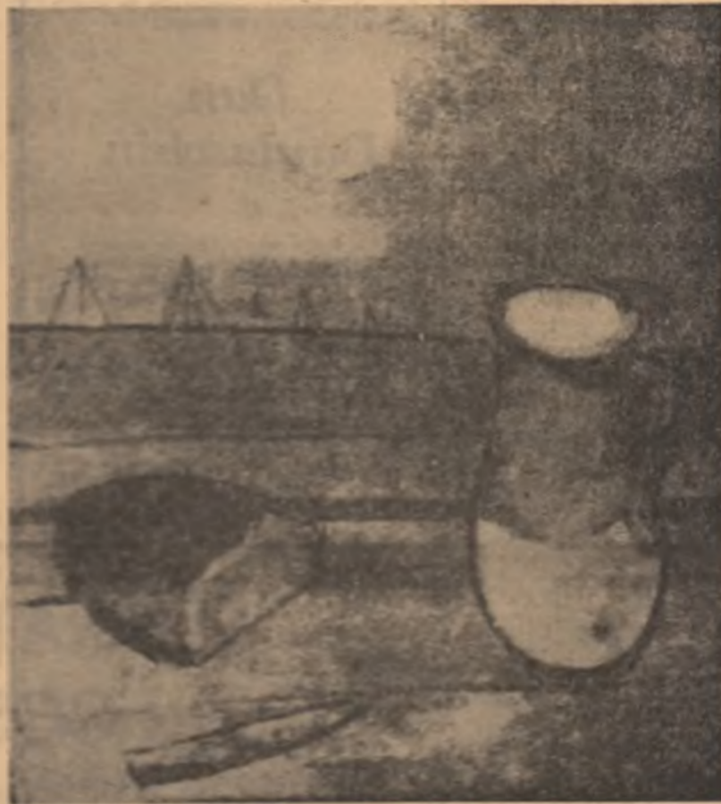
I. BERZIN : Pîna și scorbă

Pe strada Dimitrii Ulianov trecem Spre bulevardul larg din cale-afară Și-n timp ce-n ciocotul modern te legeni Ți-apare-n cale mica, solitară