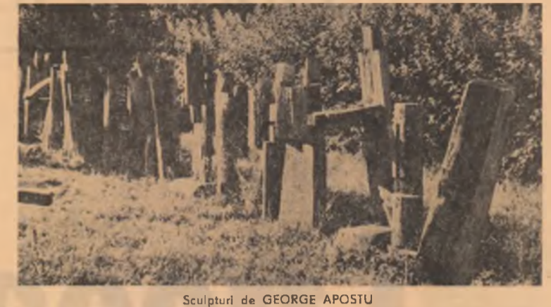
Sculpturi de GEORGE APOSTU