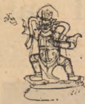
Desena de Analia Firan după piese din Colecția Avakian