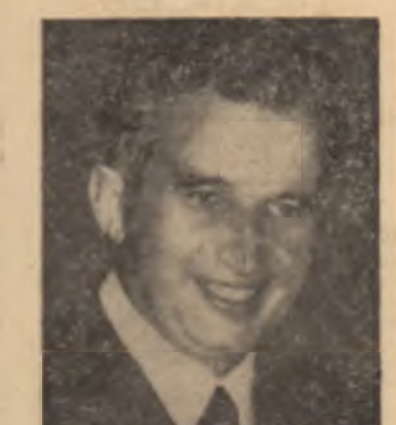
CEAUȘESCU OCH RUMĂNIEN

terii profunde a spiritului poporului, ale tradițiilor sale milenare. În România, relevă autorul cărții, noțiunea de tradiție are o semnificație mai mare decât în multe alte țări, inclusiv tradiția luptei cu toate mijloacele pentru independența națională. Firul roșu al tuturor etapelor istorice continuă în era nouă, socialistă. Stră-