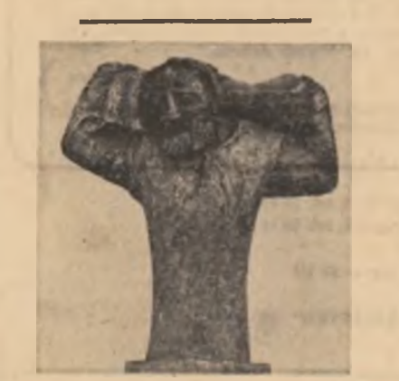
Aurelian Bolea — 1907