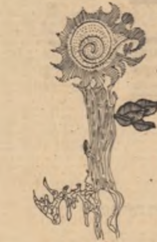
Desene de Sorin Trușcă

În iederă se face somn Și-i verde talpa de sîni, Lîngă fîntina din poveste Domnițele mai fac mătîni, Pînd cail împușcați de lună, Căpeștrele de abur singă De pe pîmînt de sub pîmînt Răsare craiul de ferigă. Un viscol se învinge-n singe Rîmîn pe dunga nopții prins, Îmi port picioarele prin lume Cu-n felinar de griu aprîns. Cunosc doar urma din potcoavă