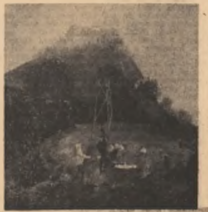
„Se pun bazele unui patrie”

Dacia, cind este Feniks, este viul ce sporește. Cei ce dau realitate patriei, sint muncitorii fizici. Sint și slujitorii instituțiilor. Idealul Patriei îl edifică Ginditorii cei aplicativi și cei ce umbli-n stele, slujind graui. Datoria, Nalta Operă, a muncitorilor cei fizici, este și să fie în nemulțumire față de materie și de unelte. Opera și datoria Ginditorilor este din nou nemulțumirea față de relațiile dintre ce-i real și ce-ar fi să fie ideal. Patria să și-o iubești; cind îți dă anaruri, nu e greu. Cind te cheamă Ea la masă, cind te laudă îți dă bani și decorații. Nu e greu. Apoi meritele cum devin, cum se fac? Meritele cum se recunosc, meritele cit durează!