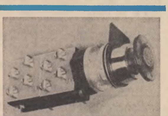
Buton ciupercă cu lampă

„Drumul de la idee la realizare presupune pentru fiecare produs o dragoste mare atît pentru idee cit și pentru produsul finit, dragoste manifestată de toți, de la proiectant pînă la directorul general. Aici la I.A.E.I. Titu — îmi măr-