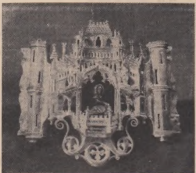
Pafta de aur (sec. XIV) descoperită la Curtea de Argeș