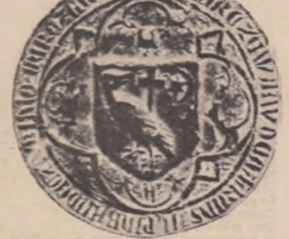
Sigiliul lui Mircea cel Bătrîn

— aflate la periferia zonei de cultură romano-bizantină, manifestările de artă de la Dunărea de Jos, îndeosebi din Banat și Dobrogea erau