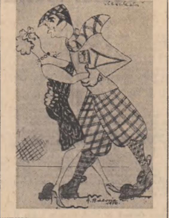
Doou desene INEDITE de G. BACOVIA: „Cearteleon” (sus) și „Gura mahalalei” (jos)