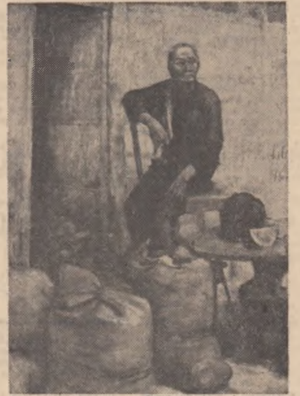
To Duy : „Mamă din Sud”