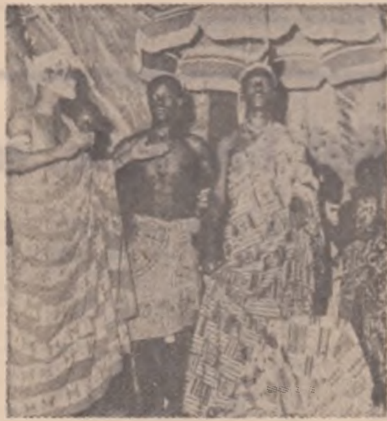
Scenă dintr-un spectacol al „Teatrului popular” din Coasta de Fildeș

Lucrările teoretice care încearcă să explice, să teoretizeze acest fenomen intitulat, generic, „teatru popular” (asa cum ar fi, spre exemplu, lucrarea lui F. J. Amou d'Aby apărută mai demult în Editura pariziană Larose) pun accentul, în primul rînd, asupra caracterului său de improvizație. Temele sale sint cel mai adesea, sociale, piese, asa cum subliniază profesorul Valdenaire, „atî de puțin scrise încît se reduce la o simplă schemă pe care actorii o dezvoltă mai apoi în funcție de imaginația lor și, mai ales, de situațiile în care se află. Spontanitatea, caracterul său de «joc» este una dintre primele calități ale acestui teatru. El se impune, înainte de toate, ca un mijloc de comunicare ce a căpătăt din ce în ce mai multă importanță tocmai în contextul marilor schimbări aduse de urbanizare precum și de evoluția rapidă a societății din foarte multe țări africane. Acest teatru nu este un simplu fenomen de supraviețuire al unor tradiții, ci este o adaptare a acestora la niste noi realități, la un nou univers spiritual... un teatru complex căruia i se adăugă muzica, dansul și mai ales poezia... un teatru specific african”. Să adăugăm, la toate acestea, funcția, deloc neglijabilă, de factor educativ, căci, dintotdeauna, manifestările artistice sint, pentru omul african și exemple morale edificatoare.