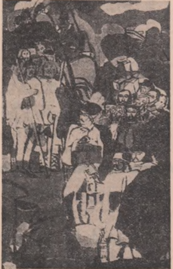
Lidia Nancuinschi: Pe colinele Feleacului - 1848