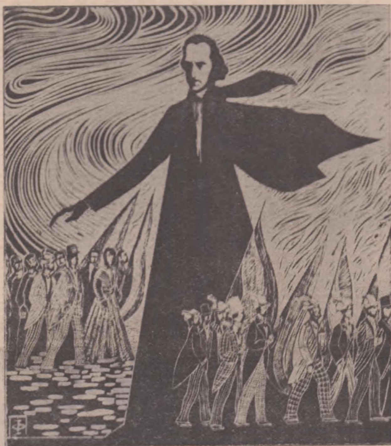
„Bălcescu” — gravură de Iulian Olariu