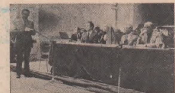
La ceremonia de inminare a Marelui premiu

Le Palais des Papes este nu numai un impresionant monument de artă medievală, conceput ca o fortăreață, cu turnuri și ziduri inexpugnabile, cu impresionante curți interioare și săli unice prin deschiderea și grandioarea lor: el este însăși inima legendară a acestui oras muzeu care își trăiește prezentul în deplină armonie cu gloria de odinioară.