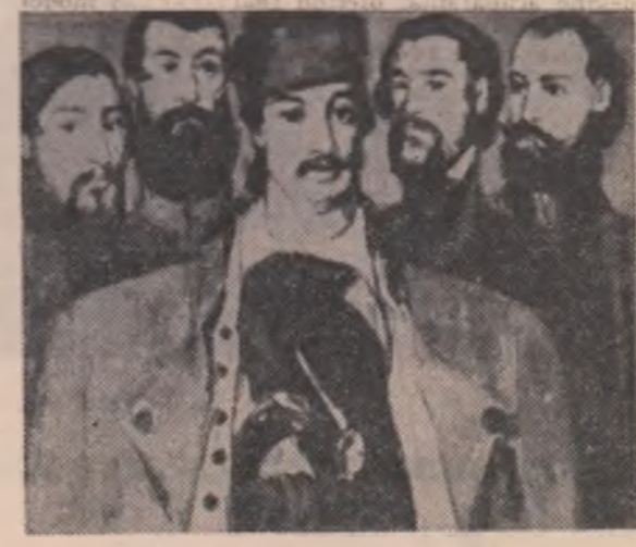
Petre Bedivan: „Avram Iancu”

Înaltă idee umanitară, prietenia, dragostea față de semen îmbrătată haina patriotismului pașoptist: ideea unității naționale . În altă parte acest imperativ capătă o formulare tranșant politică, subliniind necesitatea unirii tuturor revoluționarilor români împotriva pericolului ce amenință țara. „Un cîmp sîntem toți, și altu înțelegem, căci mai le-au trecut seara / Sînt greci este singurul punct comun între scriitor și generația sa; în contră, așa putea spune că ideile sale sînt trecute prin baia comună a gîndirii pașoptiste: „Eu ca scriitor nu pot să am nici un rău, nici patimă, câtă să n-ai (să povestesc) (n.m.) literaturile așa cum le știu și cum stau documentele de față”, spune Eliade într-o scrisoare către Georgehe Magheru (1851, mai 8/20, veritabil, unic tratat de morală și etică profesională. Frazele sînt aproape identice cu cele din „Introducere” Daciei Herte a lui Mihail Kogălniceanu din 1840: „Critica noastră va fi nepărtinitoare, vom critica curtea, iar nu persoana. Vrajmași ai arbitrarului nu vom fi arbitri în judecările noastre literare. Iubitori ai păcii, nu vom primi nici în foaia noastră discuții ce ar putea să se schimbe în vrajbe”. Alădată se adresează compatrioților săi (cître emigranții români internați la Brusa, 1849, iulie 20/1 august) nu ca organizator și conducător al revoluționarilor ci în calitate de patriot, de român: „Eram hotă-