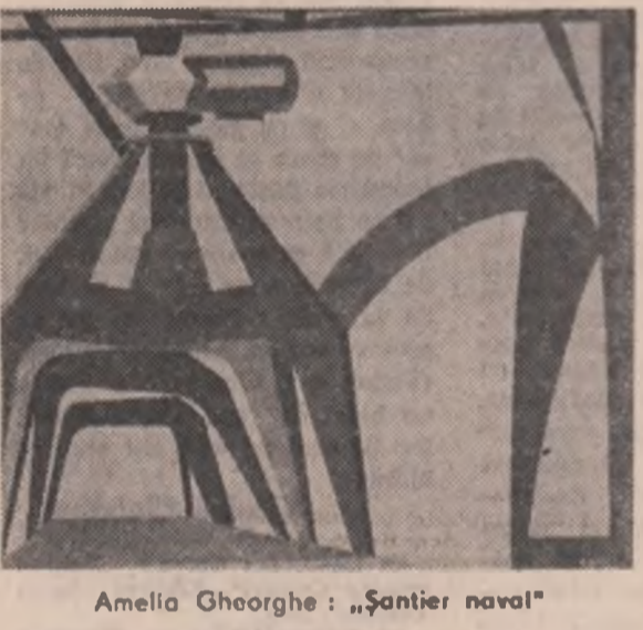
Amelia Gheorghie: „Șantier naval”

condiție deloc. Unspreezece frații... Locul vostru, tică, să fie pe linia industrial. Amin. Eu întodeuna — zicea — am dat 2 băncioare de grup pe 1 m de pinză. Griul se face o dată pe an, cămașa se rupe de două ori. Și zicea tata: toată viața nu mi s-a vindecat bubă din umăr. Oamenii din Voineasa de Olt aveau tot bube în umăr, de la împinsul cărutei cînd voiau să iașă din sat, din vale. Față de situația de la părinți, eu am venit la Craiova, la fabrică. Trimite-mi, bă, tată, bă, un fier de pluz și o foarfecă de vie... M-am trezit la 5 — cum spuneam — și am făcut mortarul. Eram în lucru la o cămăruță. Rămînea sotia să zidească. După veselia de la fabrică, auzind la radio comunicatul și după ce am strigat „ura”, cum se procedea pe atunci, m-am întors acasă să-mi reiau opera. Am cumpărat o stîcă de vin „Rezervat” cum nu mai băusem în viața mea.