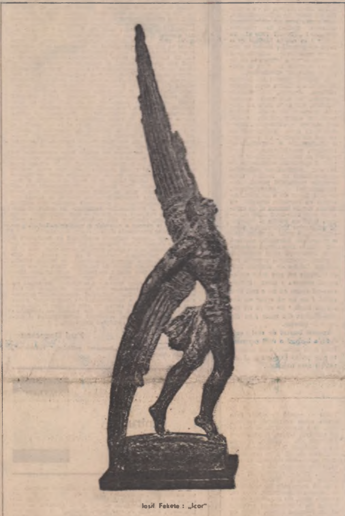
Iosif Fekete: „Lecor”