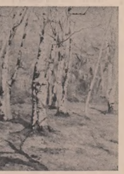
Ion Andreescu: "Pădure de fogi"